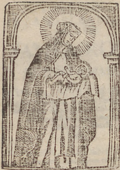
Santa Rosa de Santa Maria.