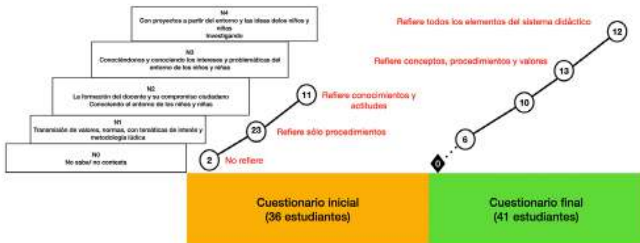
Figura 6. Escaleras iniciales y finales de la pregunta 1 de la unidad 1.

Cuando presenté en clase el análisis de los cuestionarios iniciales les planteé al alumnado una serie de preguntas a partir de sus respuestas analizadas: ¿qué valores y normas hay que enseñar? , ¿cómo el docente puede ser ejemplo y buen ciudadano? , ¿cómo conseguir una metodología lúdica en base a valores y normas? , ¿se educa la ciudadanía? ¿es transmisible? Mostraban su ingenuidad y comentaban los tópicos a los que se acaba constriñendo la educación para la ciudadanía, uniendo a ello una concepción de la didáctica con términos muy tradicionales, y ciertos prejuicios sobre las capacidades de los niños y niñas para ser ciudadanos. Esto se traslucía perfectamente en la pregunta siguiente.