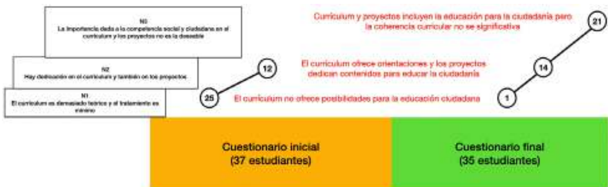
Figura 9. Escaleras iniciales y finales de la pregunta 2 de la unidad 2.

Pregunta 2. ¿Crees que, en el currículum, los proyectos educativos que conozcas se le concede la suficiente dedicación y el tratamiento adecuado a la formación para la ciudadanía?