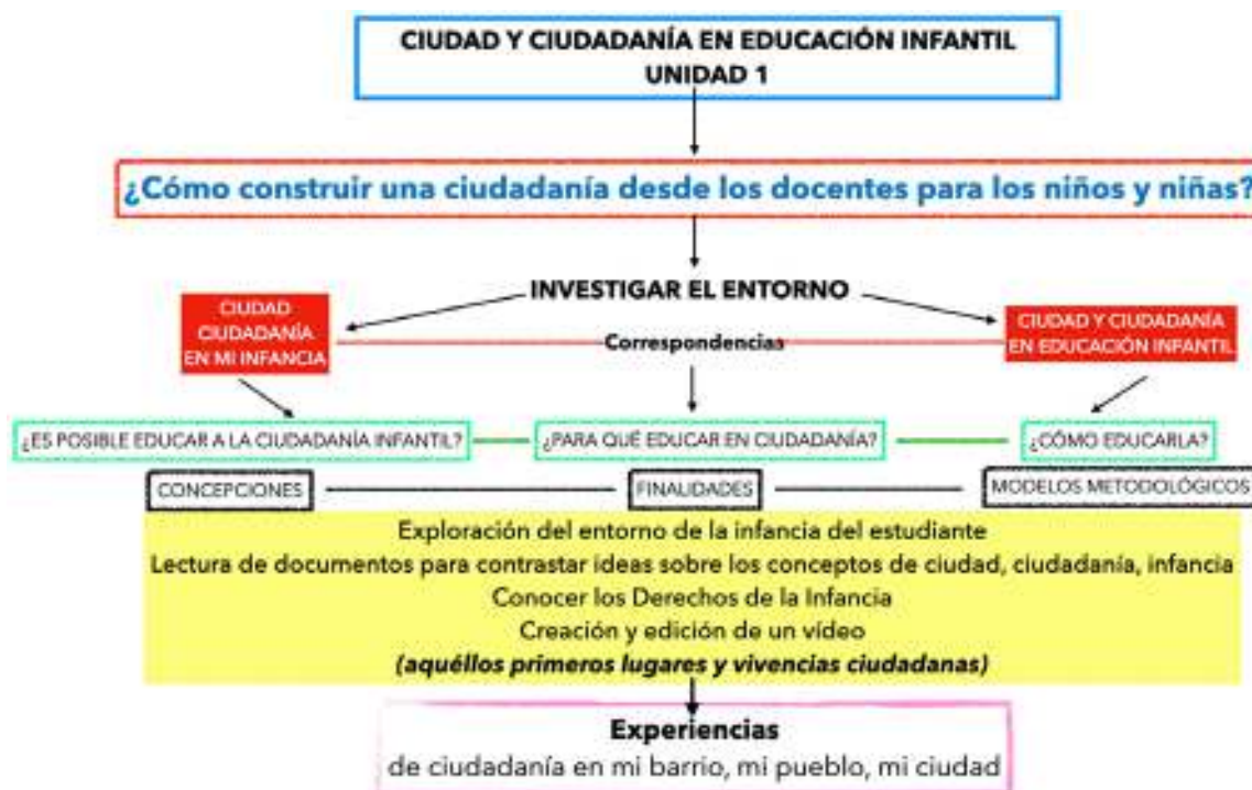
Figura 2. Mapa de contenidos de la Unidad 1.

De estas preguntas clave derivarán otras que permitirán dar respuesta a la principal y que presentamos en detalle en los mapas de contenidos. Advertir que las preguntas y subpreguntas están enmarcadas en rojo y verde, los conceptos en cuadro rojo, los procedimientos en amarillo y las actitudes y valores en marco malva.