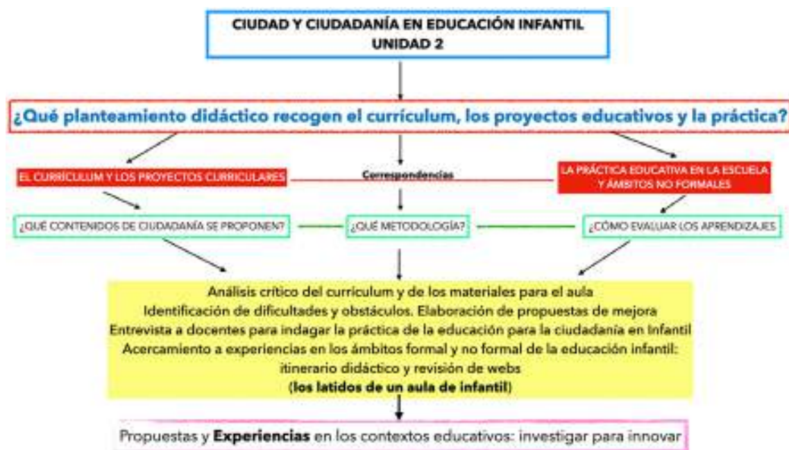
Figura 3. Mapa de contenidos de la Unidad 2.