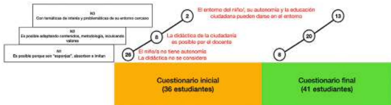
Figura 7. Escaleras iniciales y finales de la pregunta 2 de la unidad 1.

Pregunta 2. ¿Es posible educar a la ciudadanía infantil? Argumenta tu respuesta.