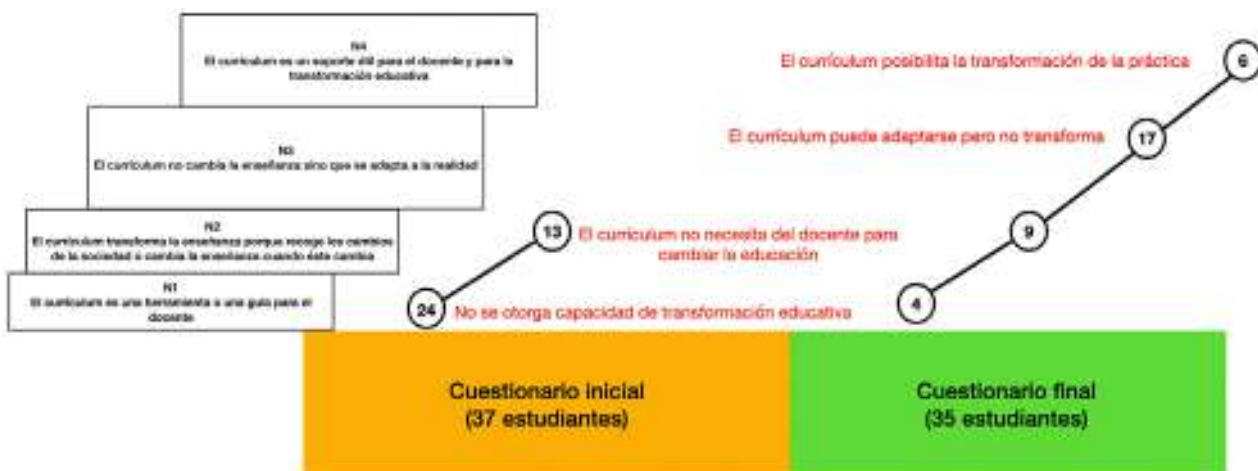
Figura 8. Escaleras iniciales y finales de la pregunta 1 de la unidad 2.

Unidad 2. Pregunta 1. «El currículum es una herramienta para la transformación de la enseñanza». ¿Qué opinas sobre esta afirmación?