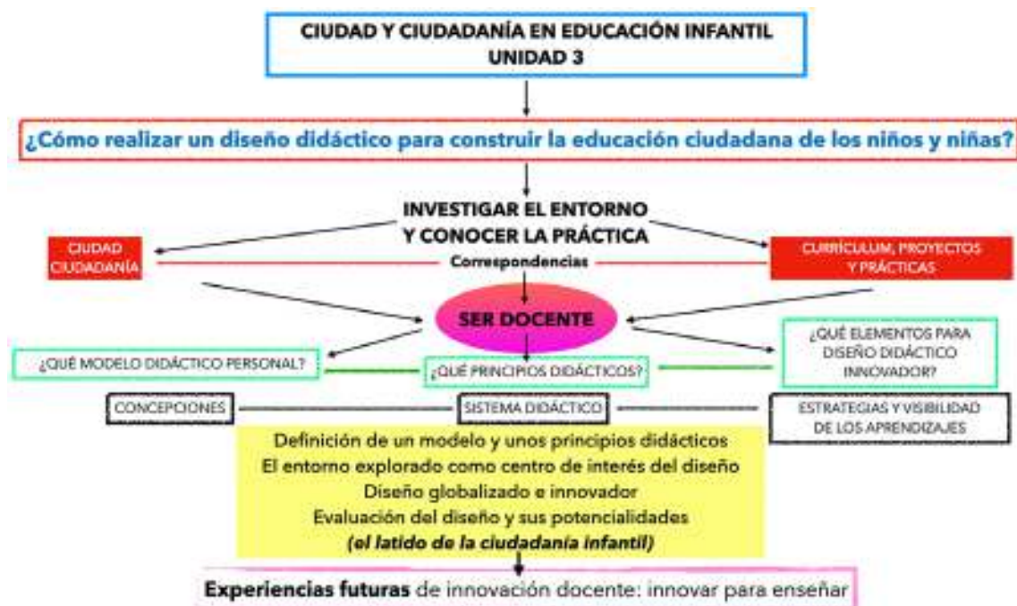
Figura 4. Mapa de contenidos de la Unidad 3.