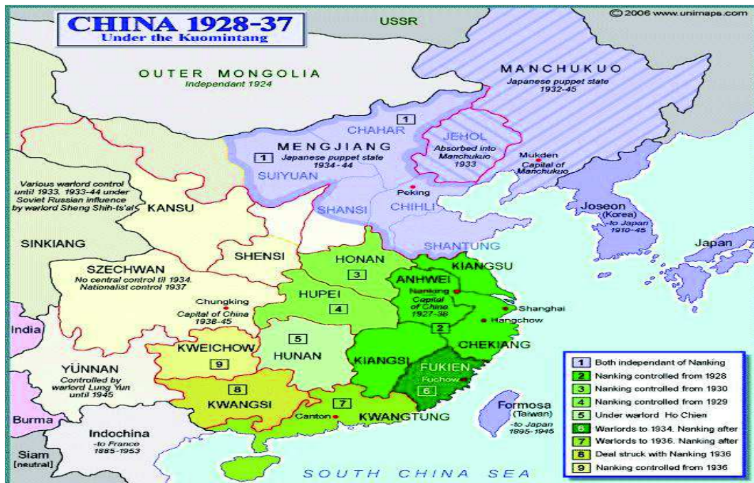
Imagen 2: Mapa del dominio del Kuomintang durante el decenio de Nankín.

Con esta alianza de 1922 se consiguió vencer a los caudillos del norte y unificar a China bajo la misma república. Pero con la muerte de Sun Yat-Sen esta alianza llegó a su fin, fue entonces cuando Chiang Kai-shek consiguió el control del Kuomintang , debido a su liderazgo de las tropas del norte que consiguieron doblegar a los caudillos militares. Con Chiang Kai-shek se produjo la ruptura definitiva con los comunistas y con ella, la unificación del país bajo su mandato en 1927. Es entonces cuando comienza el periodo llamado “decenio de Nankín”.