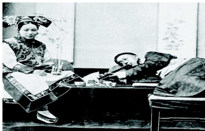
Imagen 6: Casa del opio de clase alta.