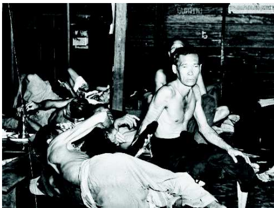
Imagen 4: Fumadero tipo guarida.

El convenio consistió en la concesión de licencias de venta. Los fumaderos de opio proliferaron considerablemente hasta multiplicar su número por cuatro entre los meses de abril y agosto, de unos 200 se pasó a unos 800. A su vez los fumaderos se dividieron en tres tipos: fumaderos tipo guarida, donde se vendía opio adulterado y de muy mala calidad; casa de opio de rango medio y por último las casas de opio para la clase alta y gente adinerada. La calidad del opio que se distribuía en cada tipo de local variaba del rango social a que se perteneciese. Las personas que acudían a estos sitios variaban proporcionalmente a la calidad del opio que podría consumirse (Paulès, 2009:495).