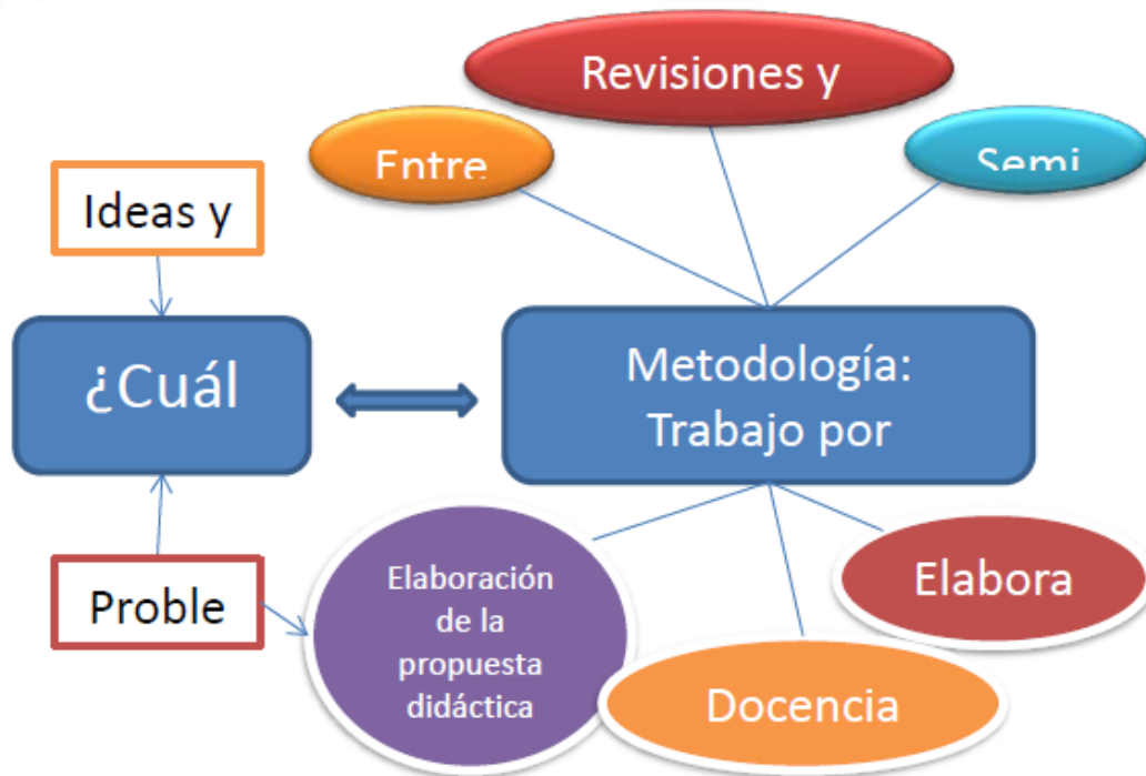
Figura1: Esquema del proceso de investigación.