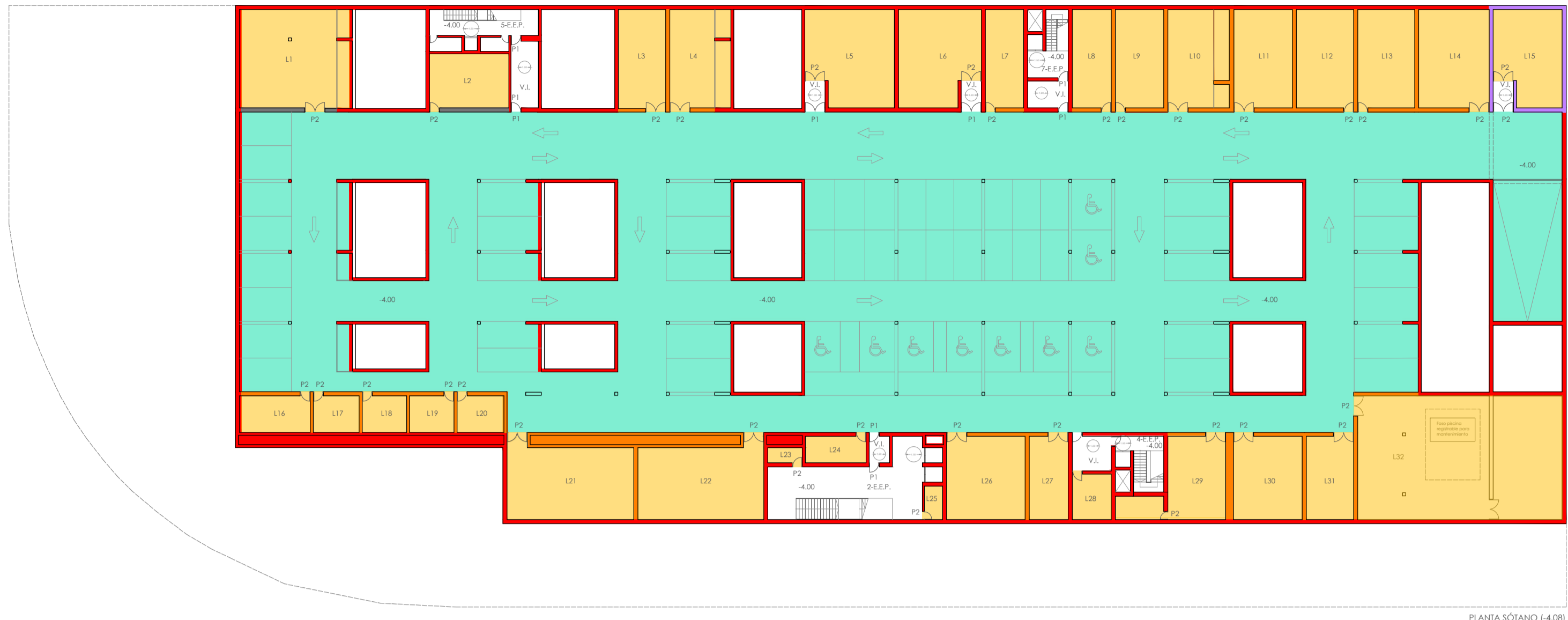
PLANTA SÓTANO | 1:400