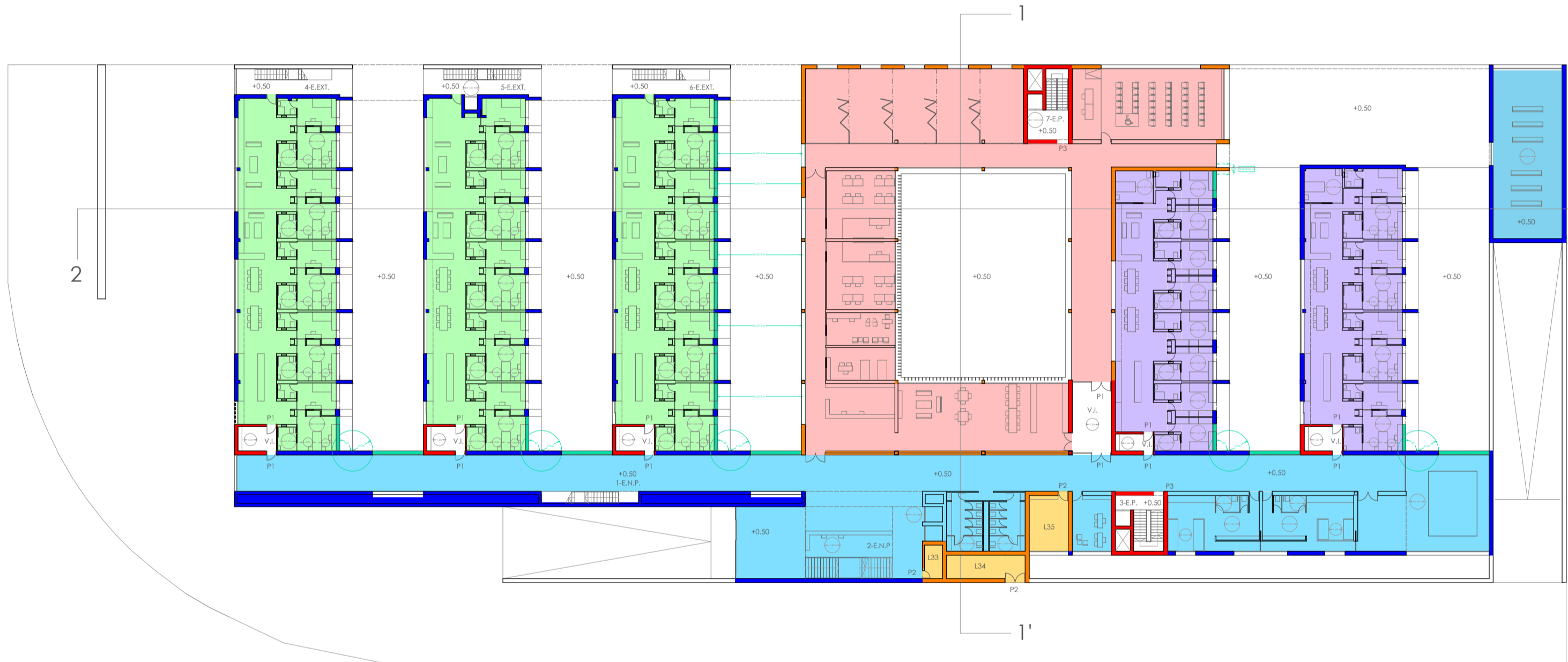
PLANTA BAJA | 1:500