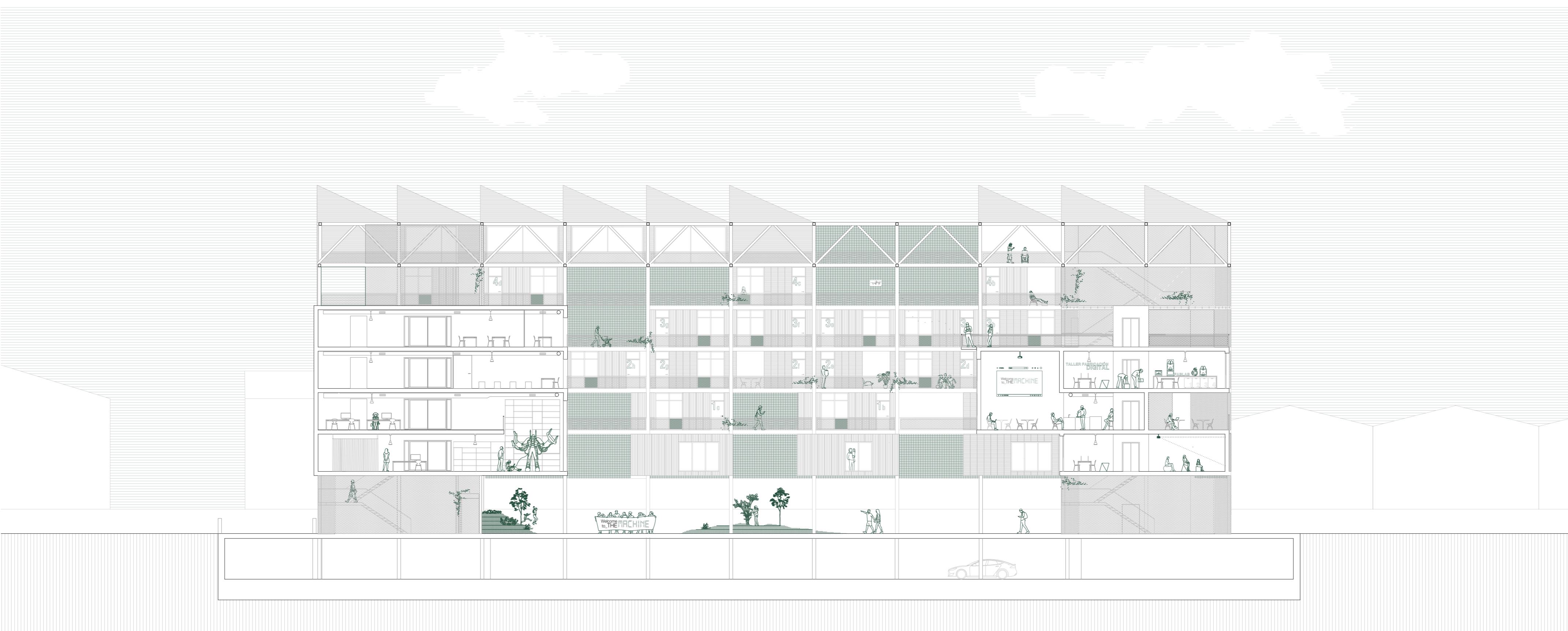
SECCIÓN LONGITUDINAL A-A' E 1:200