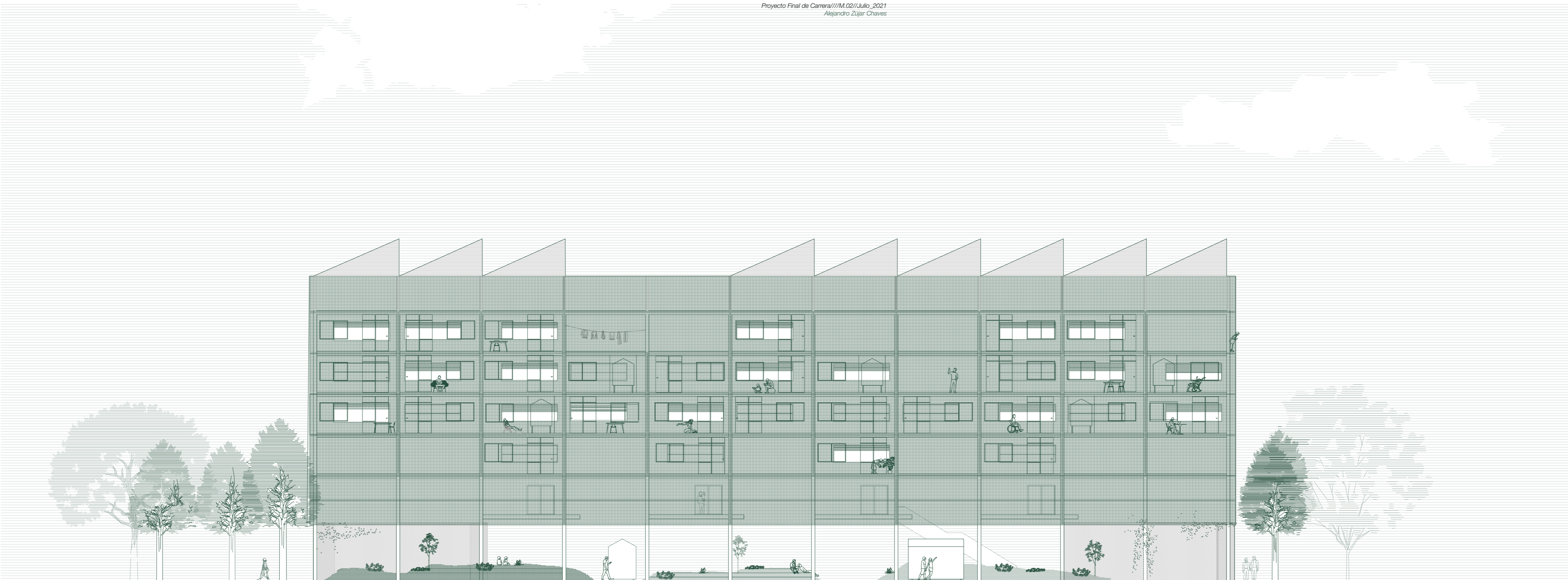
ALZADO SURESTE E 1:200