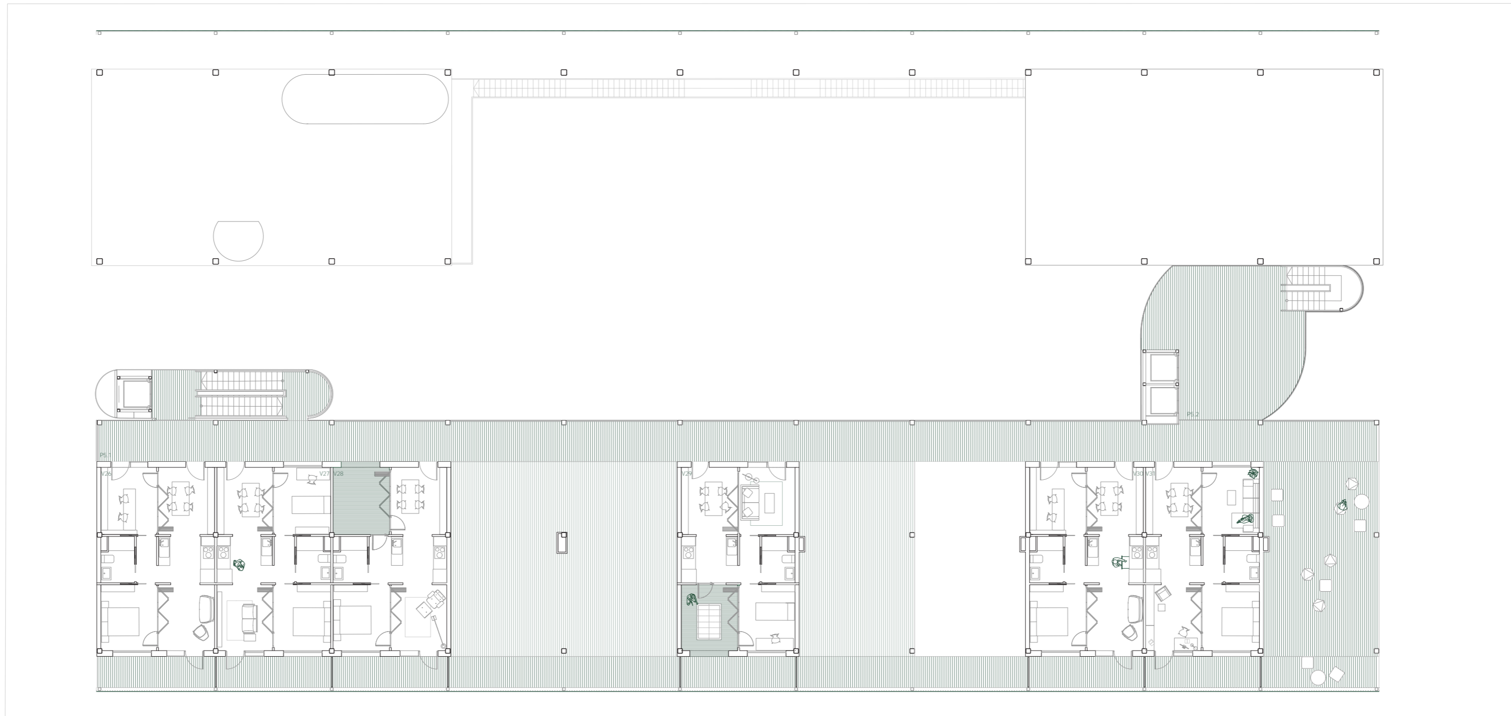
PLANTA QUINTA E 1:200