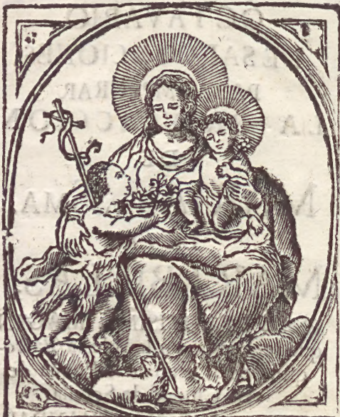
Nra. Sra. DE LAS MARABILLAS de S. Juan de la Palma.