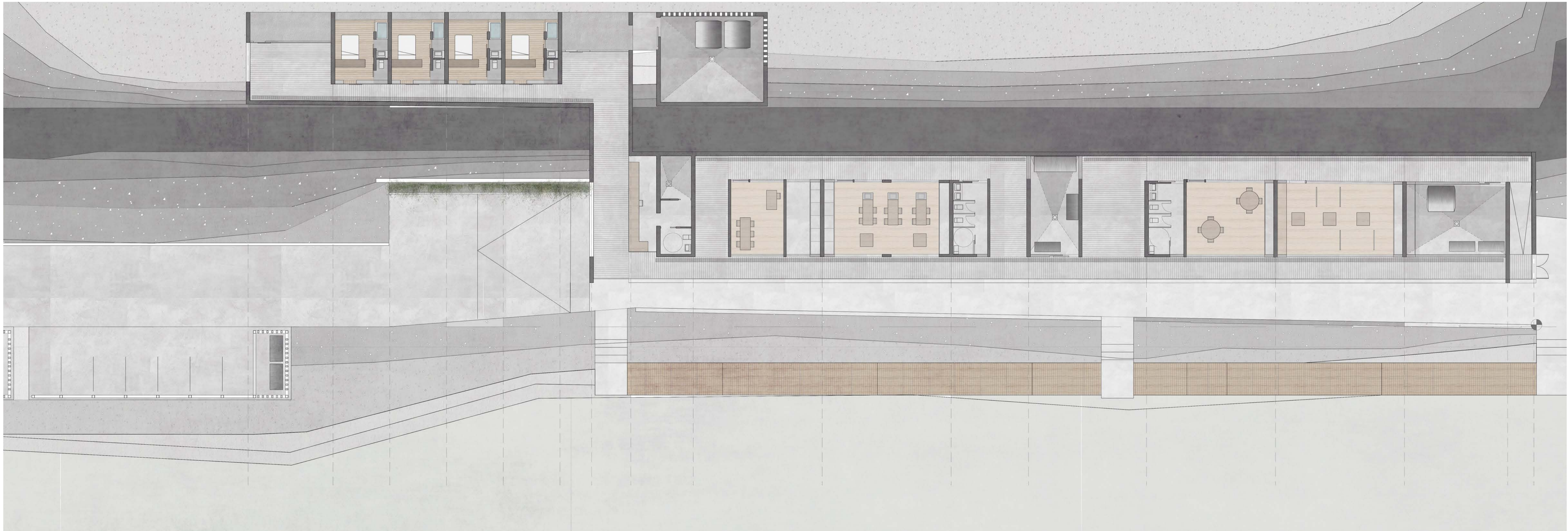
PLANTA BAJA E. 1/150 0m 10m