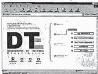
Figura 2: Web del Departamento

Unos de los servicios más relevantes que se ofrece, es la creación de varios foros de discusión, que clasificados por materias y temas, permiten que diferentes alumnos intercambien opiniones, resuelvan dudas, consejos, experiencias, etc. De igual forma se ha enlazado con foros de profesionales, en los que se debate y sobre todo se abstrae información. Éstos foros sumergen al alumno y profesor en un mundo de actualidad, permitiendo contrastar la teoría de la materia con la práctica.