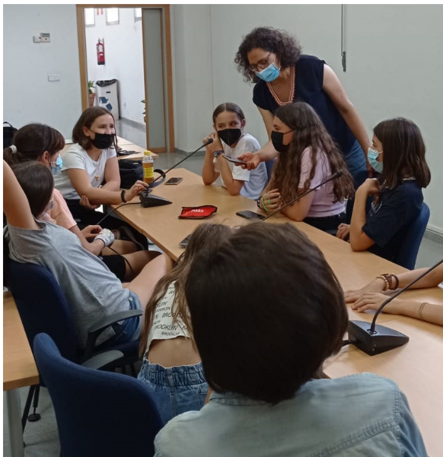
FIGURA 3. Realización del grupo focal con los menores de Radiolines (junio de 2021)