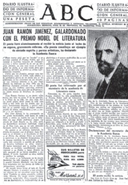
“ABC”, en su edición de Andalucía, en su primera de tipografía, narra, el 26 de octubre de 1956, sobre el otorgamiento del Nobel de Literatura a Juan Ramón.