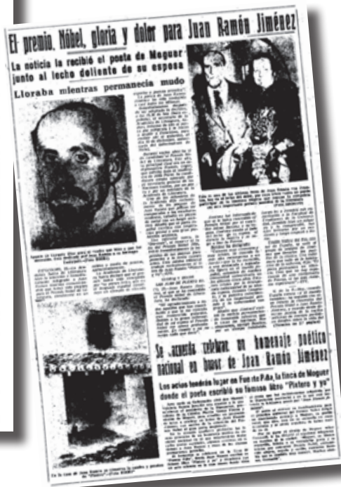
El diario “Odiel” dedicaba la última página (la 12), del 26 de octubre de 1956, a la concesión del Nobel a Juan Ramón Jiménez Mantecón.

16. En el orbe nacional del Estado español, se tienen los denominados Premios Nacionales de Literatura. Desde la conocida transición española, que correspondería históricamente al vivir tras la muerte de Francisco Franco en 1975, llevan solamente la variante de la modalidad, pues, con anterioridad, tuvieron una denominación fusionada al sistema autoritario de la España de aquellos años y tras el triunfo militar de 1939 no fueron de apelativo libre sino de nombre concretizado con marca del transcurrir franquista 16 .