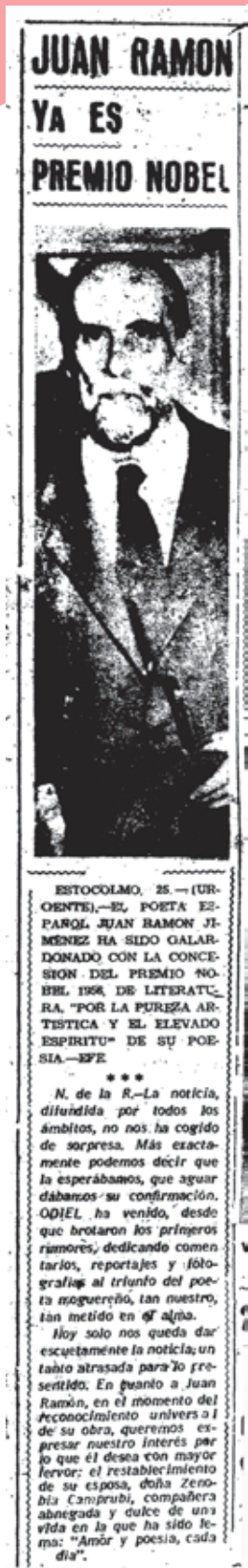
Primera columna de la primera página de "Odiel" el 26 de octubre de 1956, donde se informaba sobre la concesión del Nobel de Literatura a Juan Ramón Jiménez.

los siglos sociales y por consiguiente la Literatura vivificó en los pocos que accedían al ahora llamado Conocimiento. La mayoría ciudadana era estrato en la ignorancia.