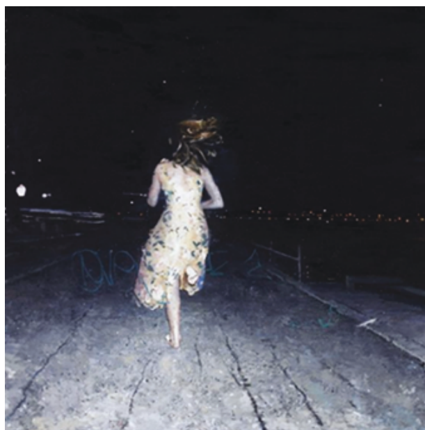
Ilustración 5. J. C. Naranjo. El camino , Óleo sobre lienzo, 2013.

El trabajo de Javier Martín no sería posible sin internet pues este soporte facilita la búsqueda de asociaciones entre texto e imagen. Su obra es el reflejo de una sociedad hiperconectada y globalizada, que se nutre de un repertorio de imágenes que vienen a objetivizar los conceptos que preocupan al artista: “Esas cadenas verbales con las que trabaja no hacen sino ampliar una serie de obsesiones y lugares comunes dentro de su trabajo que enriquecen la lectura de su pintura”. 13