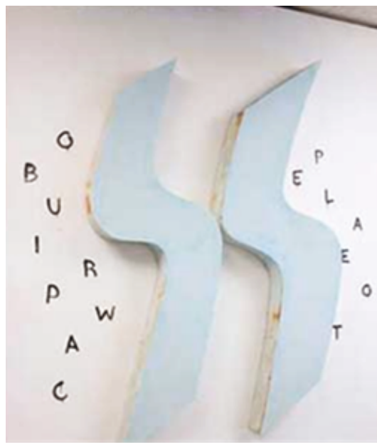
Ilustración 3. J. Martín. Hotel Picasso , 2015.

El proceso consiste en “...el equívoco referencial que en los buscadores de imágenes del navegador de internet se da asiduamente entre el término verbal de la búsqueda y el resultado de imágenes”. 11 Martín parte de una palabra que le lleva a una infinidad de imágenes que el buscador conecta con el término pero que a simple vista nada tienen que ver con él. Se produce una disociación entre la imagen y el concepto, una encadenación de malentendidos o equívocos lingüísticos e iconográficos 12 como el que genera la palabra Picasso. La idea surge de la realidad cercana del artista. El rótulo de un hotel abandonado en su pueblo, el Hotel Picasso, que provoca una serie de obras interconectadas. La ausencia de las dos eses en el dibujo (il. 2) conecta con la escultura Hotel Picasso (il.3) que sirven de nexo de unión para la construcción de otras palabras: de Picasso a picao. En definitiva se trata de la desintegración del lenguaje y de la imagen. Esta última a través de la técnica puntillista que descompone la realidad visual. Puntillismo que ayuda a configurar la tipografía de la obra Misunderstanding (il.4) inspirada en la Boîte verte de Duchamp. Escribe malentendido en inglés jugando con la inversión de las letras y también con los recorridos perceptivos.