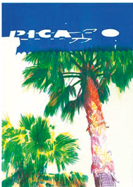
Ilustración 2. J. Martín. Cómo pinté algunos cuadros míos , 2015.

Si Andrea Canepa realiza una búsqueda cibernética de manera programada, Javier Martín se embarca en una aventura azarosa, de asociaciones disparatadas del lenguaje y la imagen en su proyecto El Vicio del Alcohol 9 de 2015. Es decir, el artista “ha creado partiendo de cadenas y familias verbales, relacionando palabras por su cercanía bien fonética bien paronímica, homonímica, etc”. 10 Un juego de palabras que remiten inevitablemente al que practicara Raymond Roussel en su obra Impresiones en África y que tanto influyó en el discurso de Marcel Duchamp. Si Roussel buscaba una narración absurda y desconcertante, nuestro protagonista pretende ampliar las múltiples asociaciones interpretativas, romper el lenguaje para motivar la fantasía, la reflexión.