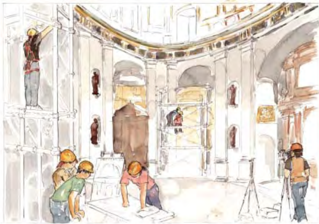
Figura 10. Boceto de la unidad didáctica en colaboración con la Fundación CajaMadrid

El IAPH, junto al Centro de Profesorado de Sevilla y el Gabinete Pedagógico de Bellas Artes de Sevilla, colabora con el Colegio Arias Montano en el desarrollo de un material didáctico de apoyo a la visita al Monasterio de la Cartuja de Sevilla, dirigido a alumnos de infantil y primaria en la fase ya iniciada, y de secundaria a medio plazo. La difusión de los valores de los patrimonios emergentes (patrimonio industrial, paisaje, contemporáneo, etc.) en Andalucía constituye una prioridad para la disminución de la brecha existente entre el reconocimiento académico y el desconocimiento público.