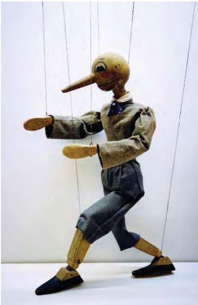
Figura 12. Títere Pinocho, de la compañía “La tía Norica”.

Pinocho es un títere de madera de la compañía de principios del siglo XX “La tía Norica”. Debido a su preocupante estado de conservación, Pinocho ha de trasladarse a los talleres de restauración del Instituto Andaluz del Patrimonio Histórico, para hacerle todas las pruebas necesarias para su intervención y proceder a su restauración. El alumno/a toma el rol de restaurador/a y va interactuando con otros profesio-