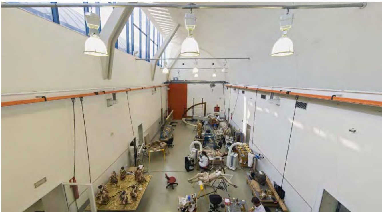
Figura 2. Talleres de restauración del IAPH.