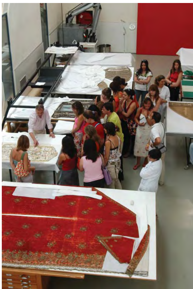
Figura 7. Visitas dirigidas a universitarios.

(“Matarile”) y carteles didácticos. Disponibles todos para su reproducción y difusión en la web institucional www.iaph.es , cuentan con estos contenidos básicos: ¿Qué es la arqueología subacuática?, La arqueología y el mar, Buceando en los archivos, Busca que te busca, En la máquina del tiempo: la excavación, La clave es conservar, Resucitar el pasado: la interpretación histórica, y la difusión.