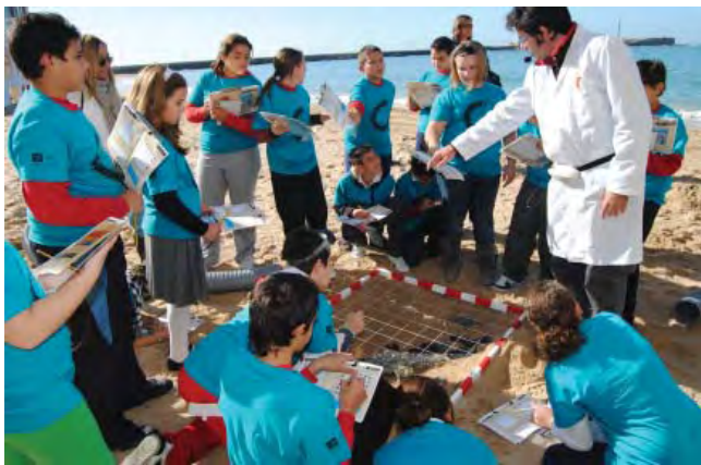
Figura 5. Visitas escolares en la sede de Cádiz (Centro de Arqueología Subacuática).