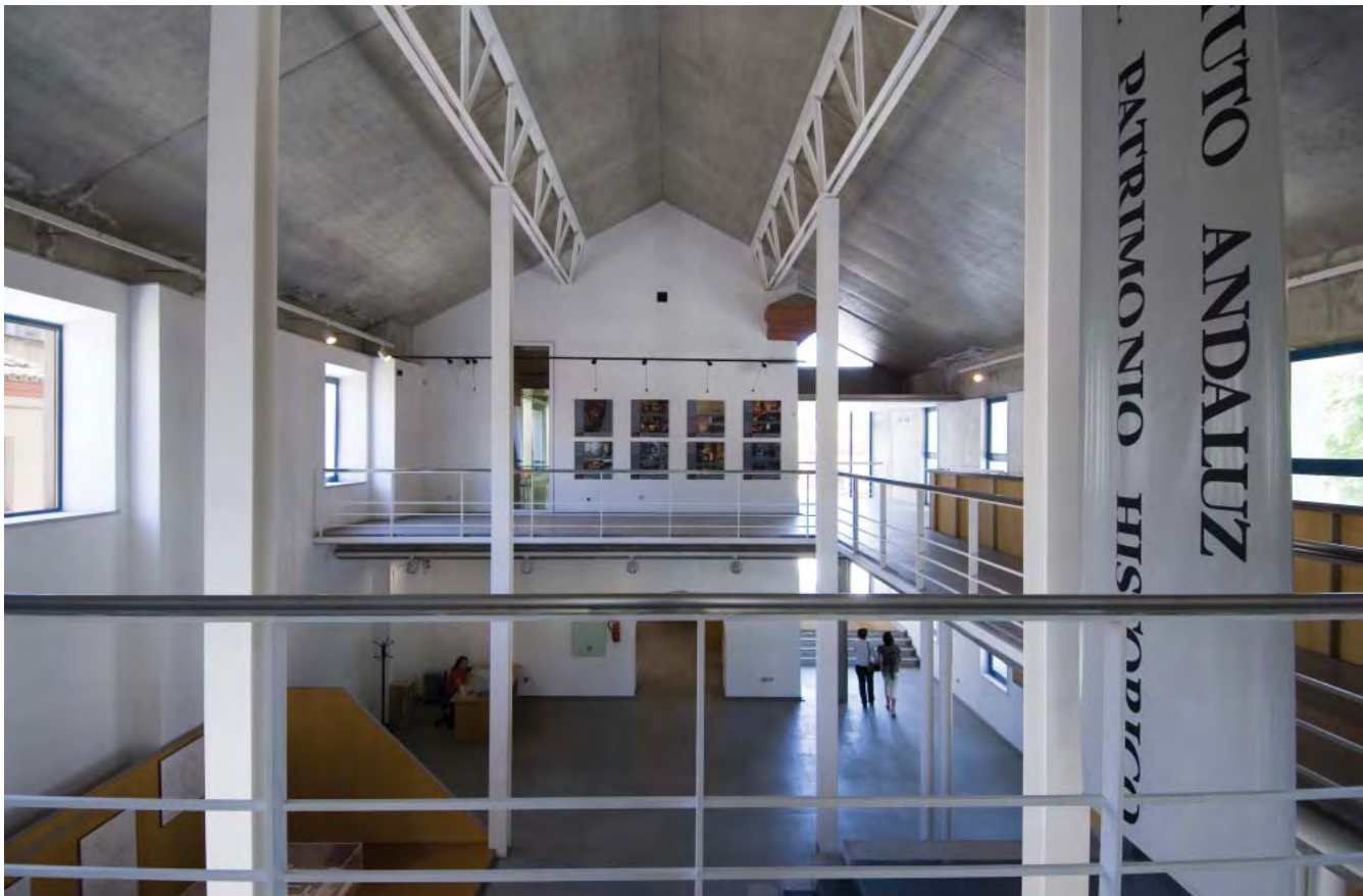
Figura 1. Sede principal del IAPH en el Monasterio de la Cartuja de Sevilla.