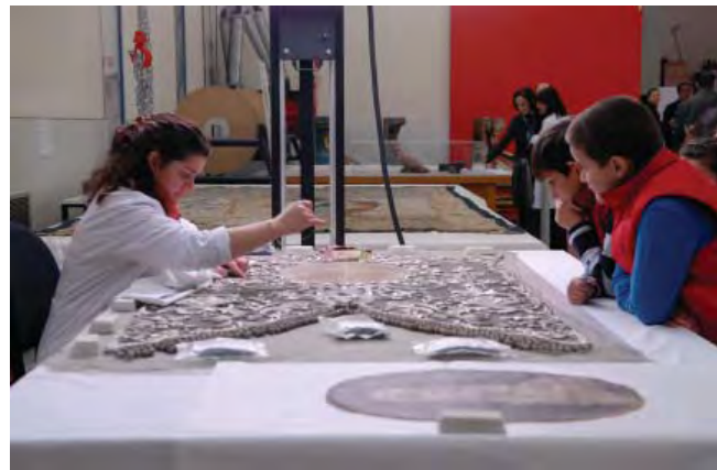
Figura 4. Visitas escolares en la sede de Sevilla.