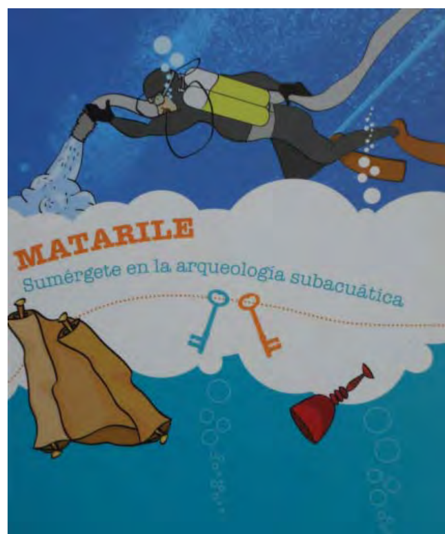
Figura 9. Cuaderno didáctico “Matarile”