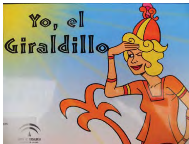
Figura 8. Cuaderno didáctico “Yo, el Giraldillo”

Financiado en 2009 por el Ministerio de Ciencia e Innovación y generado por la Consejería de Cultura (Centro de Arqueología Subacuática, IAPH), el proyecto “Sumérgete en el patrimonio arqueológico subacuático” conforma un conjunto de productos para difundir los valores del patrimonio arqueológico sumergido y fomentar actitudes de participación en su defensa y disfrute. Los tres productos básicos del proyecto (fig. 9) son la recreación de un centro de arqueología subacuática virtual, cuadernos didácticos