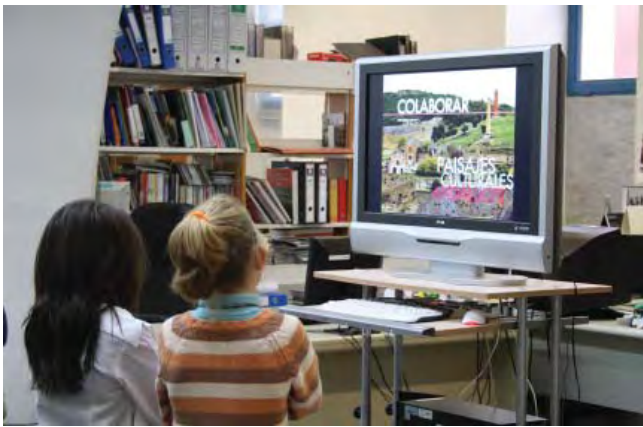
Figura 3. Visitas escolares en la sede de Sevilla.