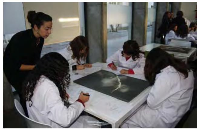
Figura 6. Talleres didácticos.

y difusión del patrimonio arqueológico subacuático.