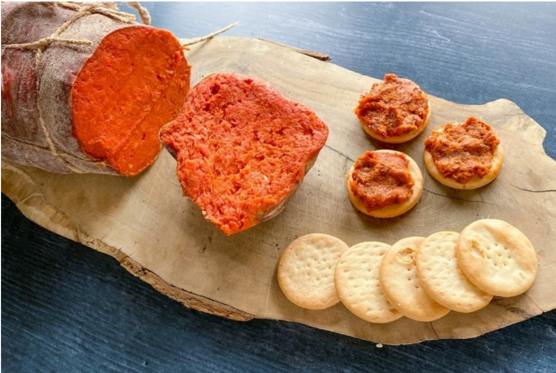
Imagen 4.16. Sobrasada.

A continuación se muestran diversas imágenes extraídas de la fuente recetasmallorquinas.es para ilustrar la rica gastronomía de Mallorca: