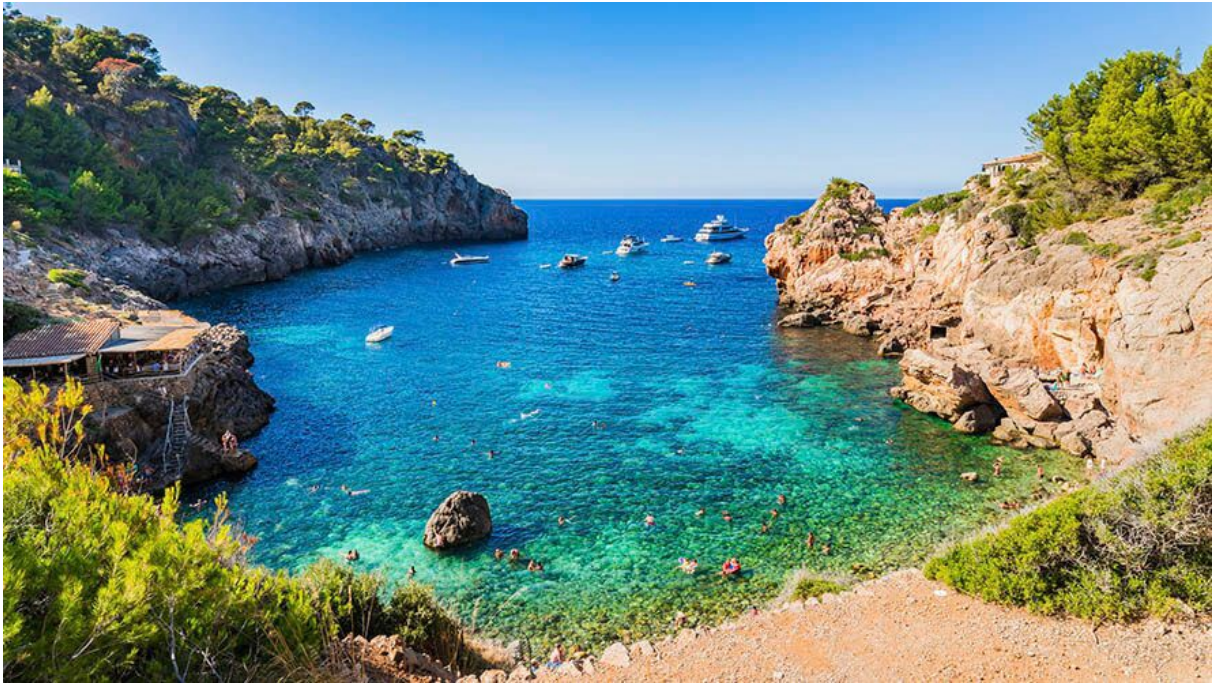
Imagen 5.2. Cala Dèia.