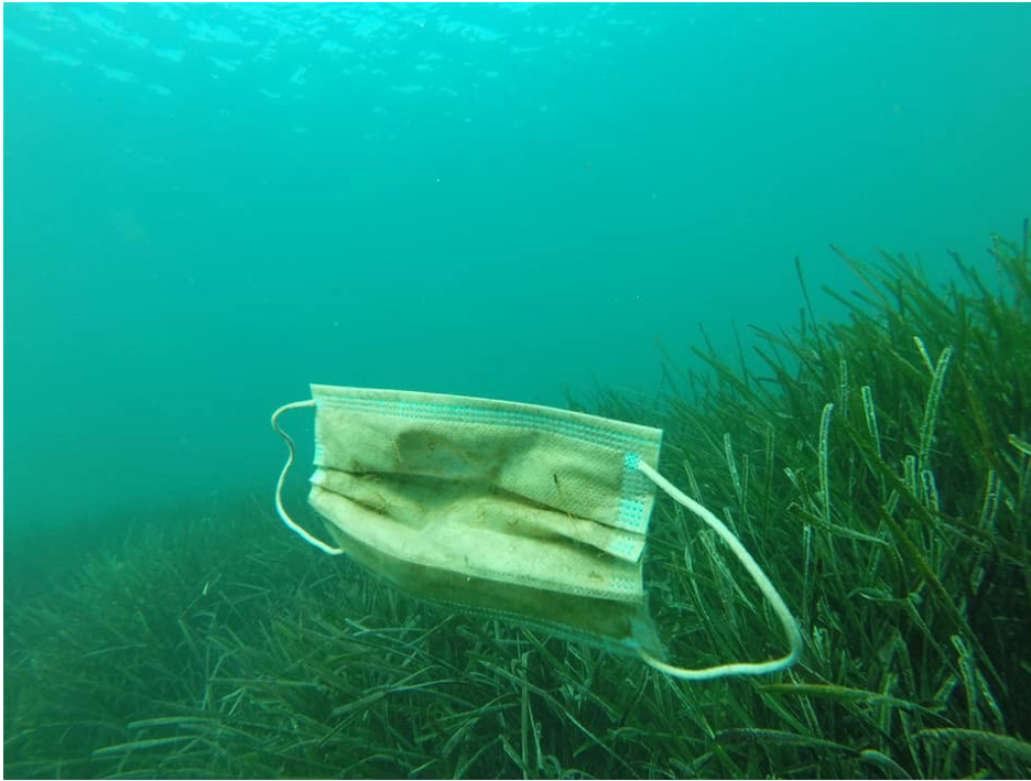
Imagen 3.4. Mascarilla en el mar.