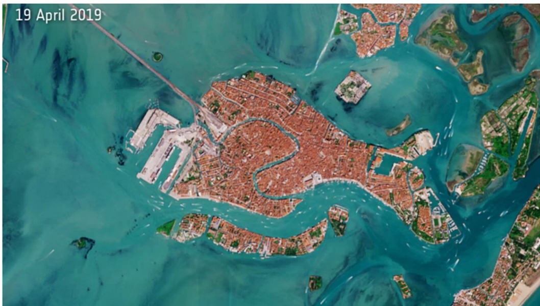
Imagen 3.2. Venecia 2019.

La primera imagen corresponde al mes de abril de 2019 en la ciudad italiana de Venecia, y la segunda, donde podemos observar un fondo marino mucho más notorio y llamativo, corresponde al mismo mes pero en el año siguiente durante la pandemia.