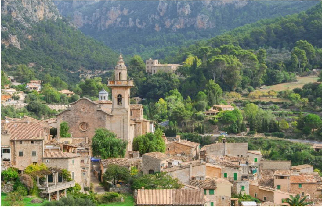
Imagen 4.6. Real Cartuja de Valldemossa.