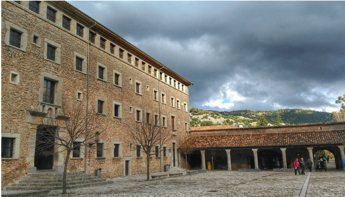
Imagen 4.8. Hospedería de Lluc.

La zona es un punto de partida para múltiples excursiones y actividades al aire libre como el senderismo o el ciclismo, de las cuales podremos disfrutar en pareja o en familia; entre ellas destacamos la subida al monte del Rosario. Podremos igualmente degustar la comida típica mallorquina, o vivir una experiencia espiritual, ya que Lluc ha sido considerado desde siempre un lugar ideal para la meditación y la oración, así como el punto final de la una de las "marxas" más conocidas de Mallorca llamada "Des Güell a LLuc a Peu", desde Palma hasta el monasterio a pie.