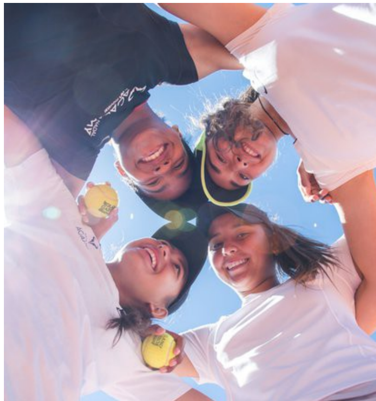
Imagen 4.27. Team in Rafa Nadal Tennis Centre.