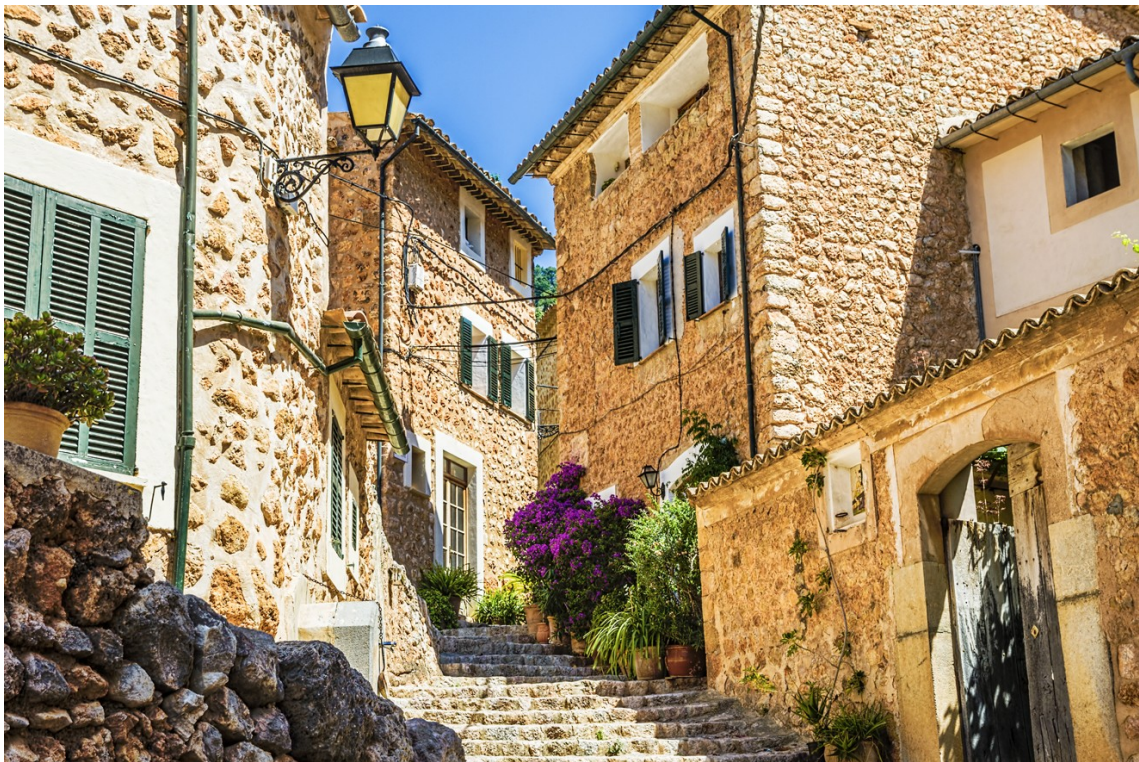
Imagen 5.4. Fortnalux.