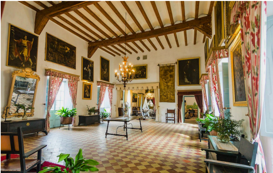
Imagen 4.12. Interior de la mansión de Esporles