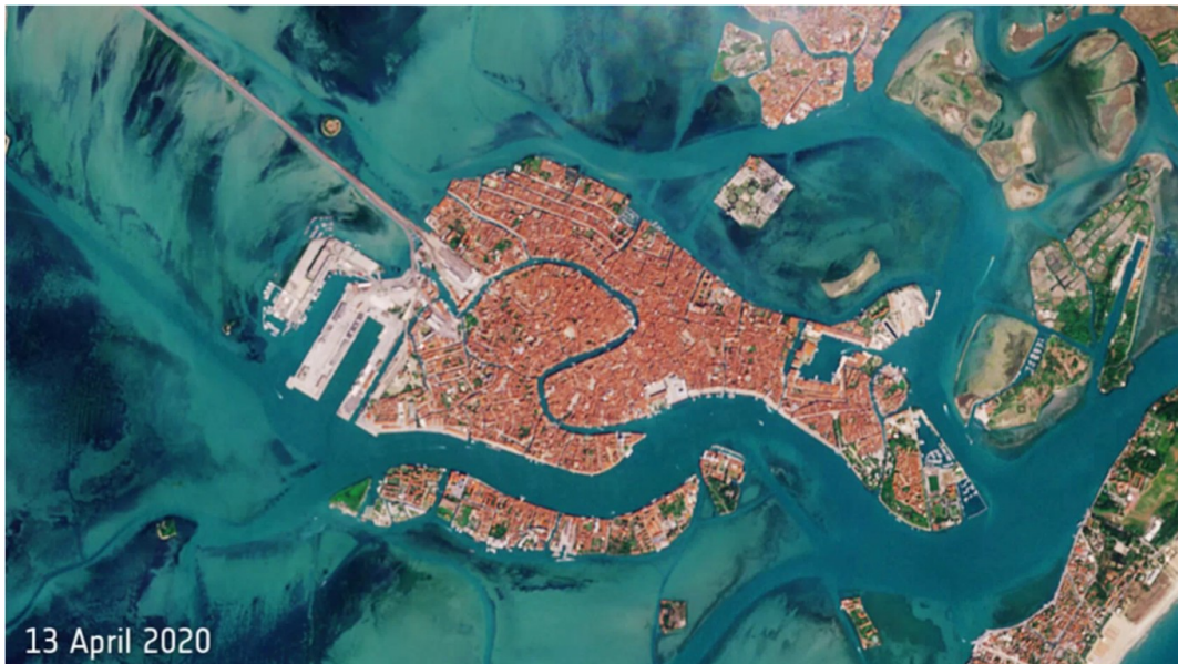
Imagen 3.3. Venecia 2020.