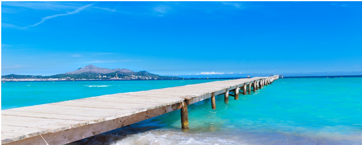
Imagen 5.6. Muro beach.

21:30h Dinner at Posidonia, Port of Alcudia. Later, walk around the old town of Alcudia and visit to the small typical street markets.