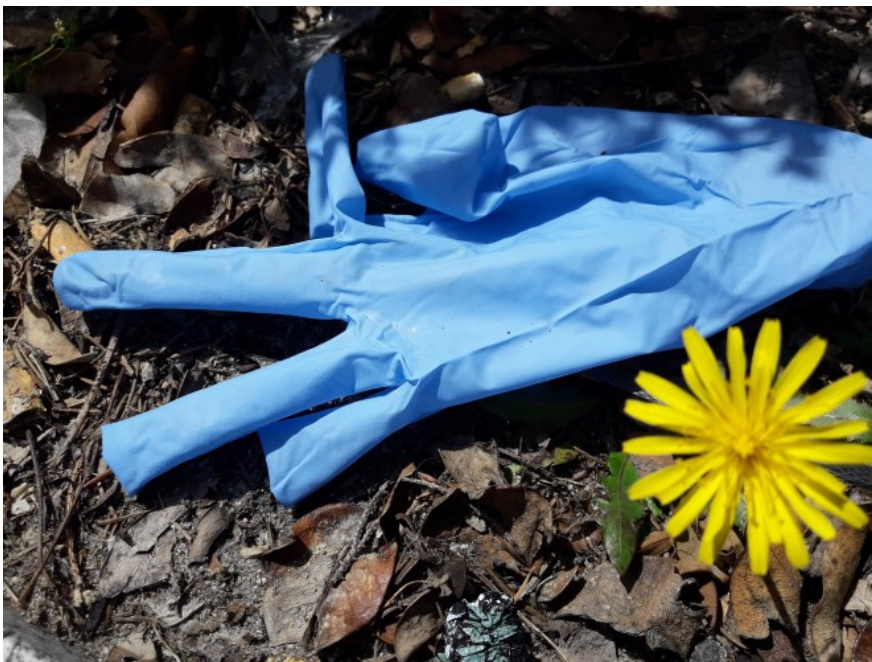
Imagen 3.5. "Recoge el Guante"

Ya varias ONGs, entre ellas WWF, una de las mayores organizaciones de defensa de lanaturaleza, se manifestaron tras la pandemia con relación a este fenómeno mediante campañas como la llamada "recoge el guante", en la que informaban que una mascarilla tarda más de 400 años en desintegrarse, lo que está provocando en la primavera del 2020 un escenario muy preocupante sobre todo ante la llegada del verano y del turismo con él.