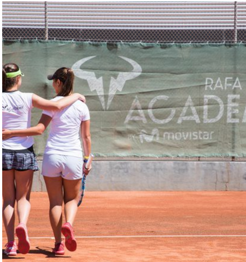
Imagen 4.26 Rafa Nadal Tennis Centre.