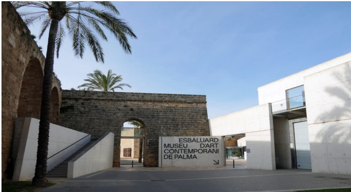
Imagen 4.3. Plano de Es Baluard.