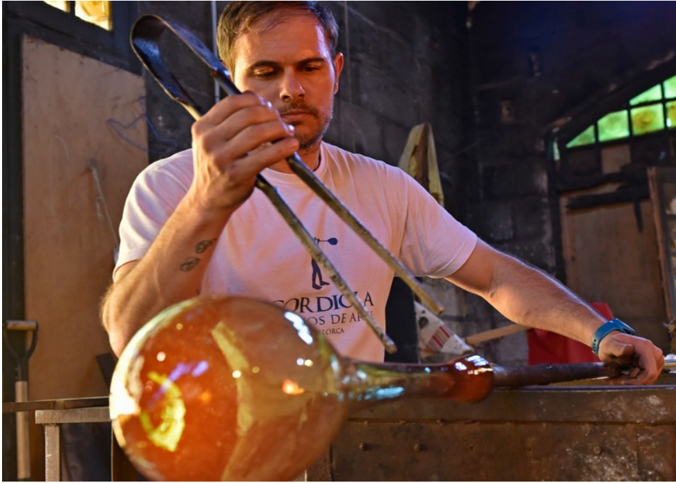
Imagen 4.9. Artesano de la vidriera Gordiola