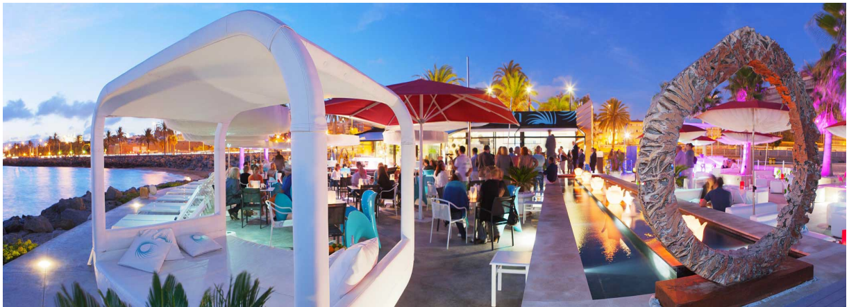
Imagen 5.1. Anima Beach restaurant.

22:00h Dinner and drinks in Anima Beach at the port of Mallorca.