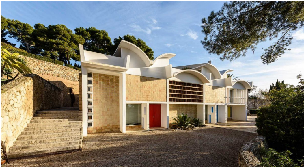
Imagen 4.4. Fachada Taller Sert.

Único museo dedicado a Miró donde vamos a poder visitar los talleres donde trabajó, desarrolló su obra y vivió. El taller Sert fue todo un sueño hecho realidad por Miró, quién quedó prendado de la isla cuando viajó en su niñez y en donde se instaló ya en 1956. El taller es un edificio que se construyó adaptándose a los bancales del terreno, siguiendo las ideas y los múltiples bocetos del propio Miró, empleándose materiales tradicionales propios del mediterráneo como la piedra y la arcilla que ofrecen un atractivo contraste con otros materiales más austeros como el hormigón. Este contraste lo podemos observar fácilmente en su fachada, muy escultórica, con ondas y techos abovedados.