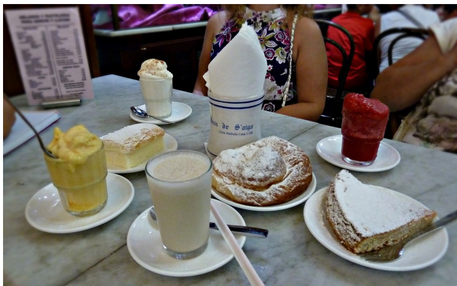
Imagen 4.15. Desayuno en Ca'n Joan de S'Aigo.