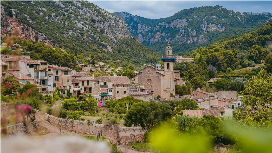
Imagen 5.3. Valldemossa.