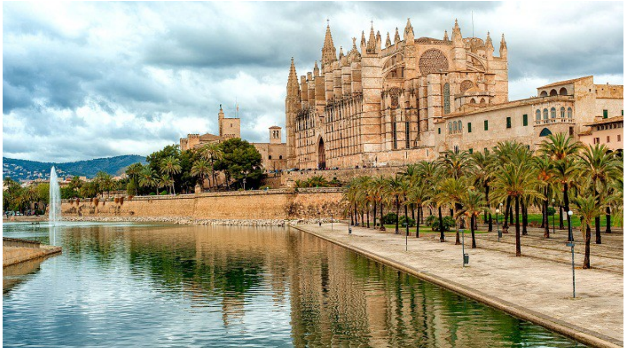
Imagen 4.2. Catedral de Santa María de Palma.

La Catedral de Santa María de Palma, ubicada en Palma, comenzada en 1229, representa uno de los edificios más emblemáticos del Gótico en toda Europa. Declarada monumento histórico-artístico en 1931, su historia está íntimamente ligada a la monarquía autóctona.