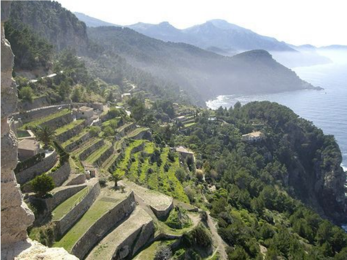
Imagen 4.21. Sierra de la Tramuntana.