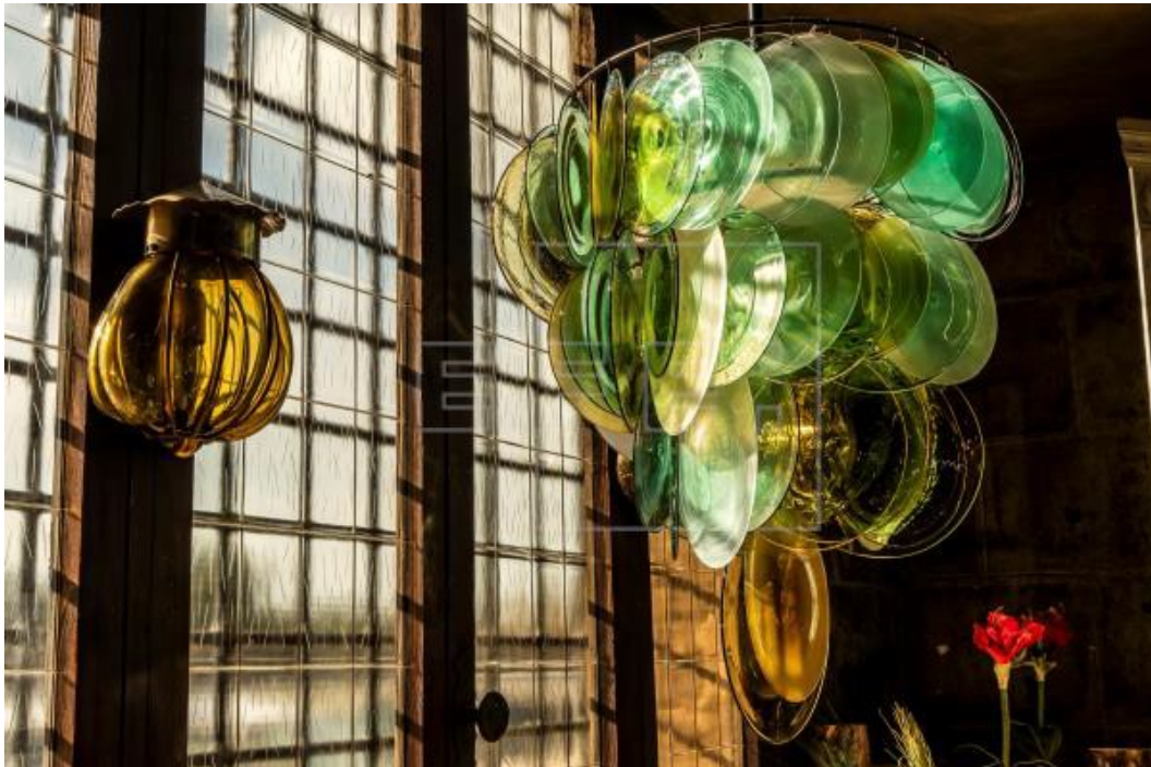
Imagen 4.10. Formas de vidrio de Gordiola.