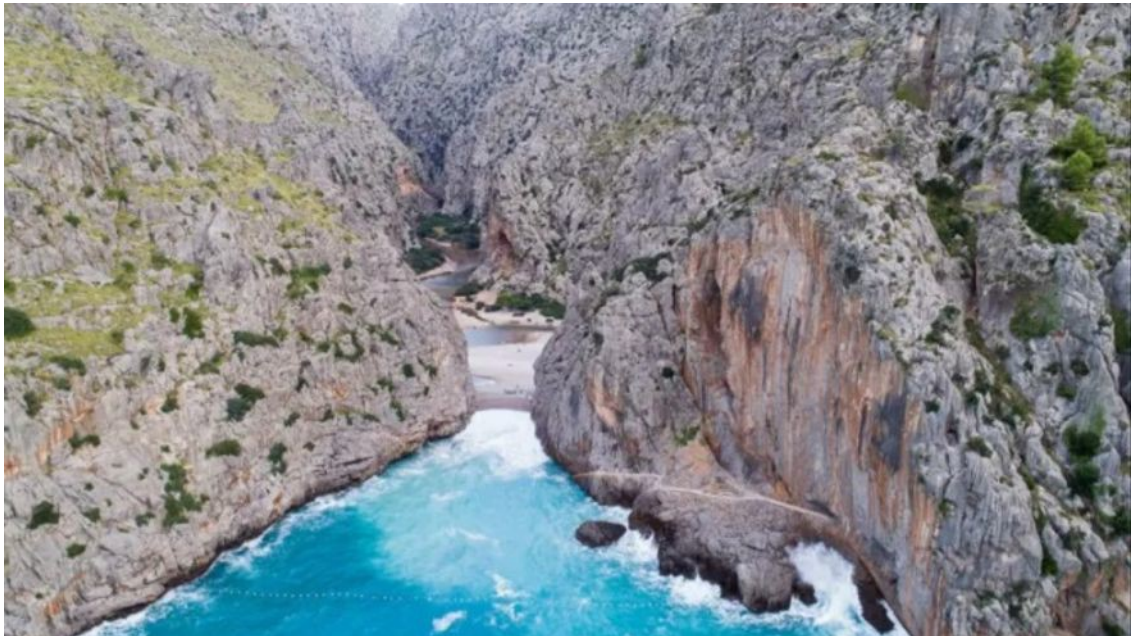
Imagen 4.22. Torrent de Pareis.