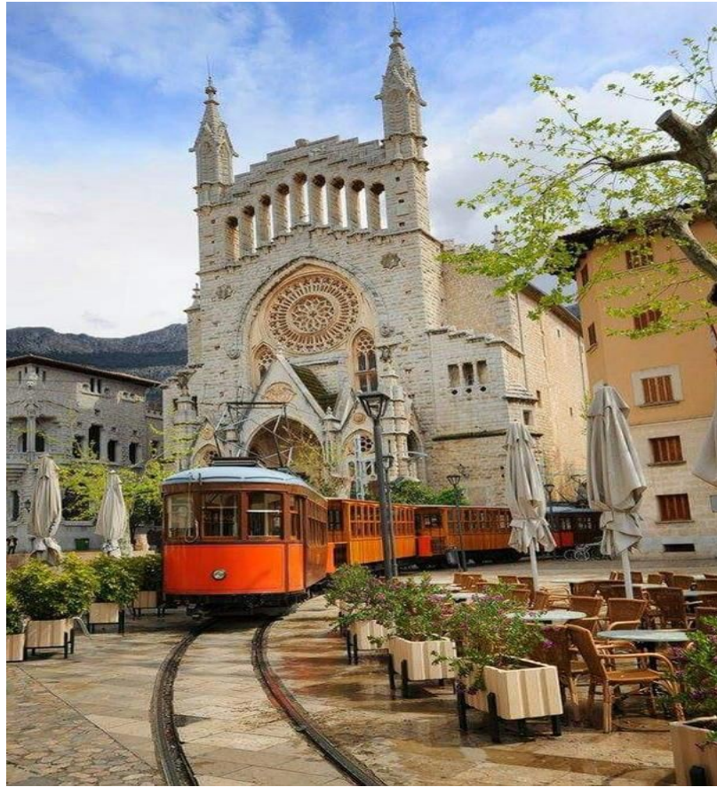
4.13. Iglesia de San Bartolomé.