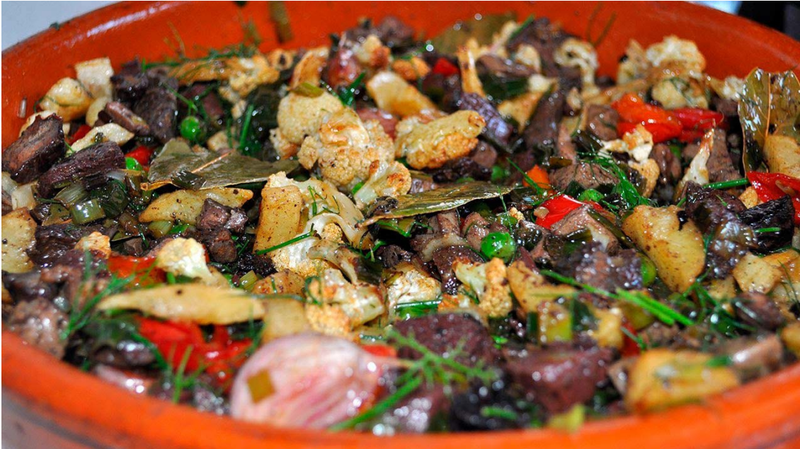
Imagen 4.18. Frit.