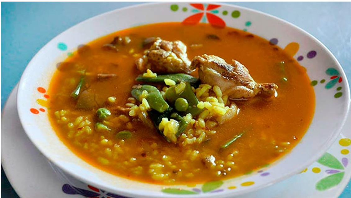
Imagen 4.19. Arròs brut.