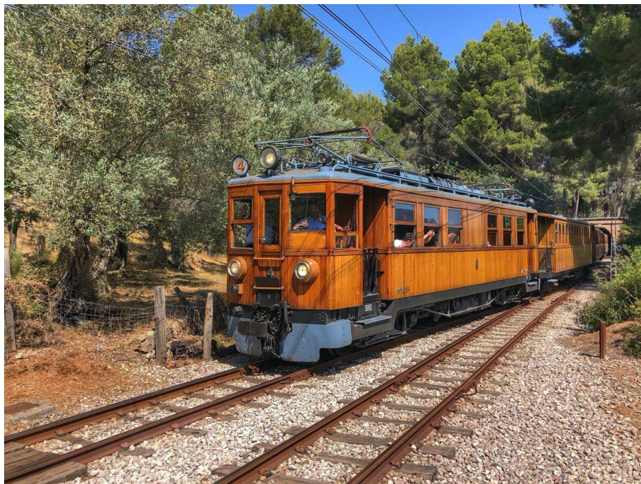
Imagen 4.14. Tranvía de Sóller.