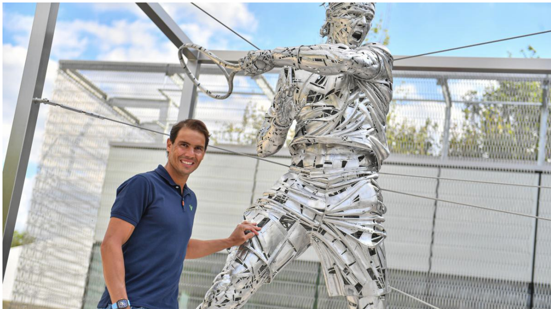
Imagen 4.25. Rafa Nadal next to his steel statue in Paris.