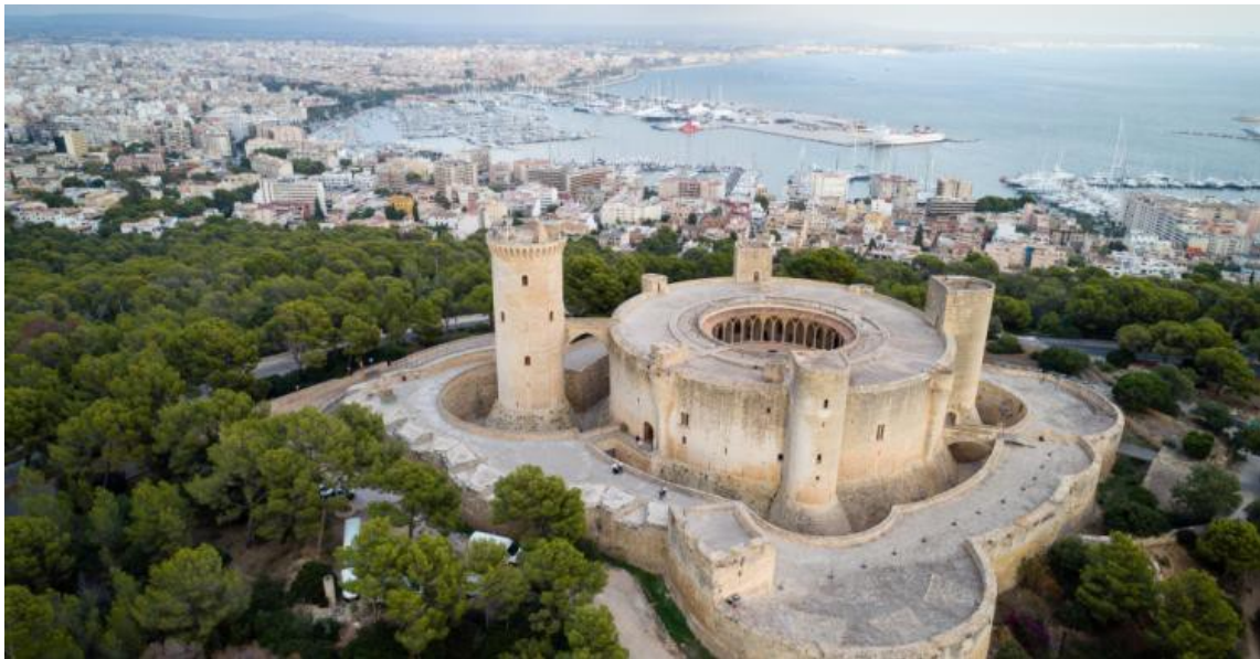
Imagen 4.1. Castillo de Bellver.

Situado en el suroeste de Palma, se trata de una peculiar construcción de principios del siglo XIV con planta circular, siendo el castillo más antiguo conocido con esta característica. Desde él se puede contemplar toda la línea de costa y la Bahía de Palma, haciendo merecido honor a su nombre Bellver (“vista bonita”).