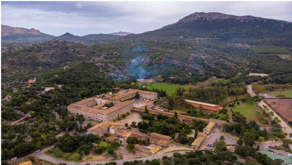
Imagen 4.7. Monasterio de Lluc.

Santuario de Santa María de Lluc, cuyo nombre proviene del latín “bosque sagrado”. Se encuentra en Escorca, a unos 400 m de altitud en la Sierra de la Tramontana. En uno de los enclaves más emblemáticos de la isla de Mallorca, se ha erigido en lugar de peregrinación para muchos mallorquines.