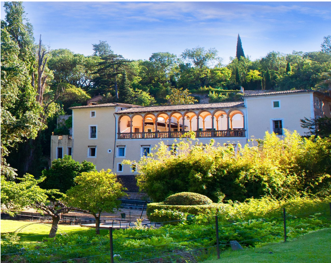
Imagen 4.11. Granja de Esporles.

En nuestra visita podremos disfrutar del museo, donde descubriremos los oficios tradicionales de la isla, además de conocer cómo se vivía en épocas pasadas; podremos dar un paseo por sus frondosos y exuberantes jardines en los que varias estancias se dedican al cuidado de animales autóctonos. La granja presenta una mezcla entre un estilo rústico y otro señorial, ya que se trataba de una residencia señorial pero también una explotación agrícola, de ahí que encontremos en ella una fauna y flora tan valiosas.