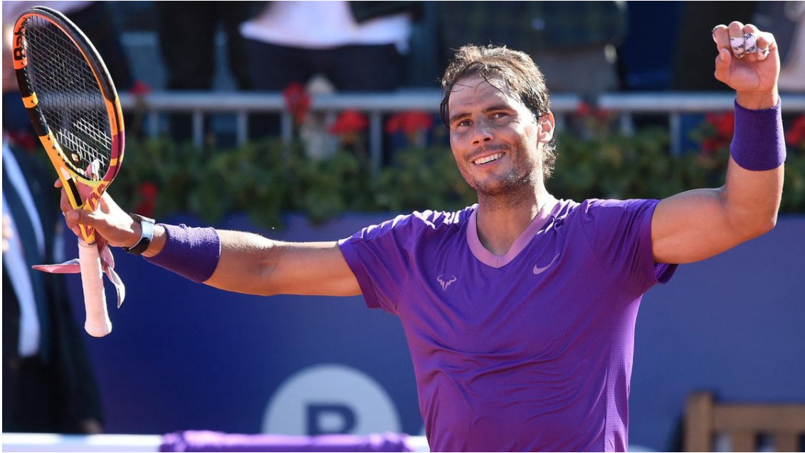
Imagen 4.24. Rafael Nadal, Barcelona Open Han Sabadell-Trofeo Conde de Godó.