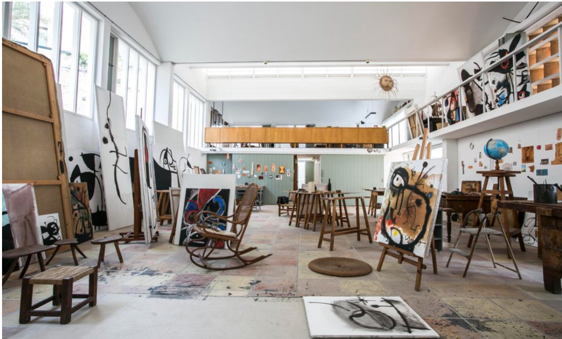
Imagen 4.5. Interior del taller Sert

Miró tenía como principal objetivo la creación de un espacio que se dedicase al desarrollo de la creatividad, lo que consiguió mediante la integración de sus utensilios, el propio estilo arquitectónico del taller y otros instrumentos, legando a la posteridad lo que hoy en día constituye un edificio declarado bien de interés cultural (BIC).