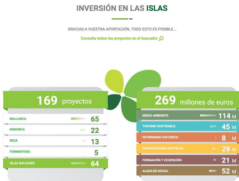
Imagen 4.20. Inversión en las islas del archipiélago balear.

Además, el gobierno de las islas Baleares implantó en 2016 el impuesto del turismo sostenible para así poder financiar más de 150 proyectos sostenibles, sobre los que podemos obtener información en http://www.illessostenibles.travel/es/ . En concreto, en Mallorca están en marcha actualmente 65 proyectos.