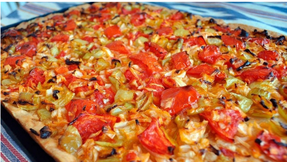
Imagen 4.17. Coca de trempó.