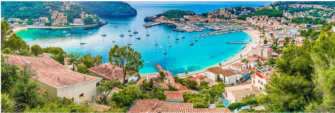
Imagen 5.5. Sòller.