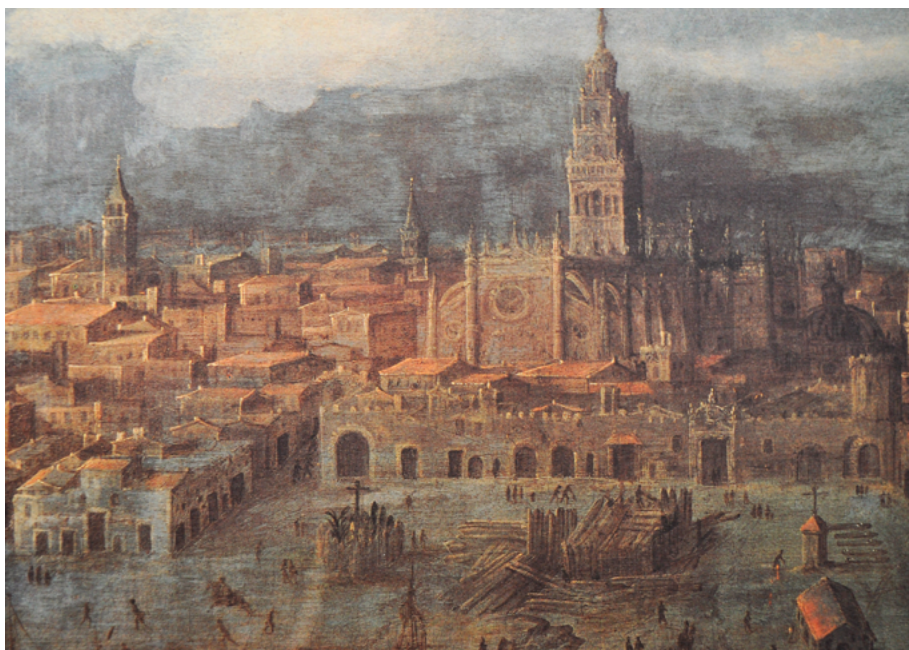
FIG. 4. Rendición de Sevilla a Fernando III . Detalle. Círculo de Francisco Pacheco. 1600-1650. The Bowes Museum. Reg.: BM69.