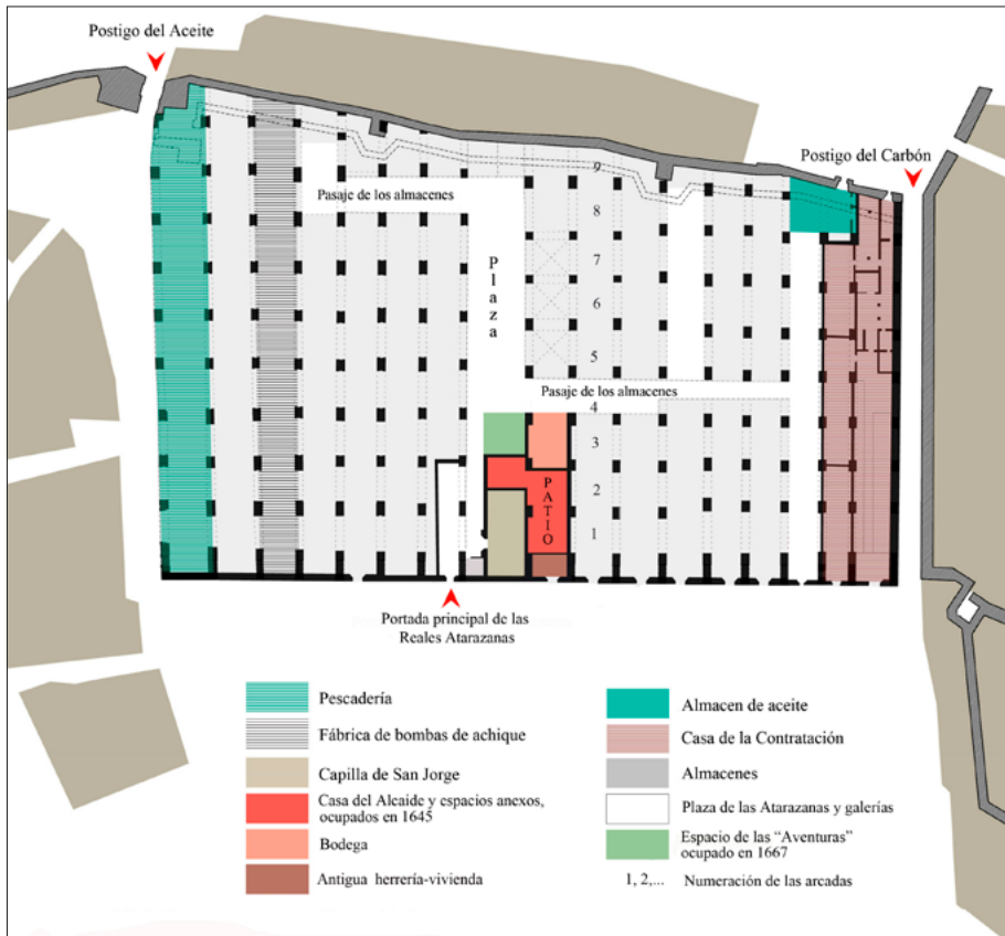
FIG. 1. Capilla de San Jorge en 1575 y sus sucesivas ampliaciones.

sidio construida en la misma época, pudiéndose considerar una obra mudéjar. 20 Tenía planta rectangular y estaba abovedada. Sobre el tipo de bóveda, no se han encontrado referencias, pero pudo presentar la misma de cañón apuntado que aún se conserva en las naves de la antigua Maestranza de Artillería y en el propio Hospital, en la sala de