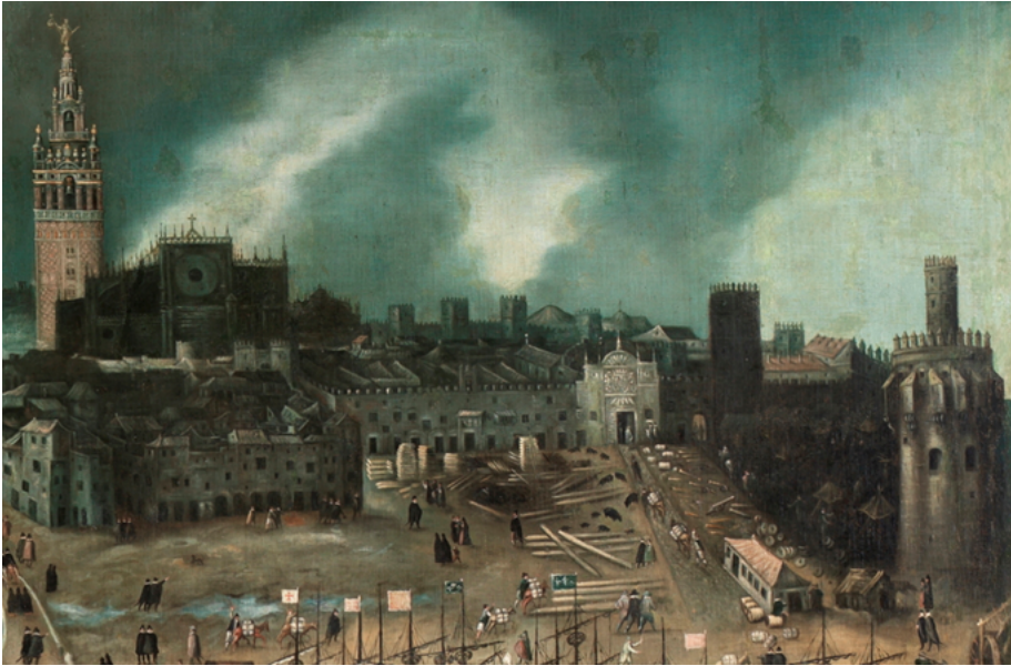
FIG. 2. Vista de Sevilla . Detalle. Atribuido a Alonso Sánchez Coello. 1576-1600. Museo de América. Inv.: 00016.

retablo, representándose un Calvario flanqueado por las figuras de la Caridad con los niños, a la derecha, y la de San Jorge, a la izquierda. Remataba el conjunto la imagen de Dios Padre sobre un trono de ángeles (FIG. 2). 26