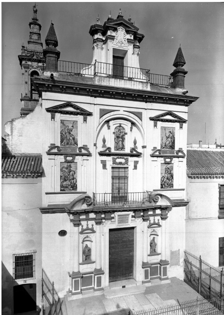
FIG. 6. Fachada y torre de la iglesia de la Caridad de Sevilla en 1958. Autor: Alberto Palau. Fototeca Laboratorio de Arte. Universidad de Sevilla. Registro: 3-8859.