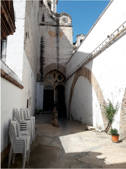
FIG. 5. Hospital de la Santa Caridad. Zona del callejón de acceso a la antigua plaza de las Atarazanas.

Esteban García, maestro mayor de obras de la Catedral; a Juan Domínguez, al que se le denomina «maestro de obras y albañilería y alarife que a sido de esta ciudad», siendo en ese momento maestro mayor del Hospital de los Venerables, y a Leonardo de Figueroa, que desempeñaba el cargo de maestro mayor del Hospital de la Caridad. Tras la visita a la iglesia el 14 de septiembre, presentaron un memorial donde se detallaban las causas del desplome de la pared. Había sido ocasionado por los empujes de las paredes de la capilla mayor y por haberse cargado la estructura del edificio sobre la «muralla», refiriéndose a la hilera de arcos y a la propia fachada de las Atarazanas, así como por el «enjugo», el haber menguado el volumen de los cimientos de ese lado. Para solucionar el problema se construirían dos contrafuertes con sus respectivos arbotantes, eliminando los antiguos levantados en 1672. Los nuevos tendrían 4 varas, (unos 3,5 m), de ancho y largo por 12 de altura, (10 m). 93 Dichos entibos, construidos dos años más tarde, en 1681, son los que se encuentran actualmente en el antiguo callejón de acceso a la plaza de las Atarazanas rematados con una voluta.