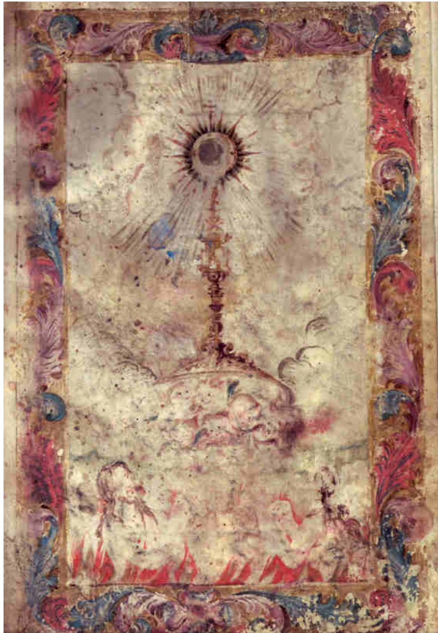
6. Ostensorio eucarístico adorado por las ánimas benditas del purgatorio. Miniatura del Libro de Regla de la Hermandad Sacramental de la Magdalena, f. 44r.