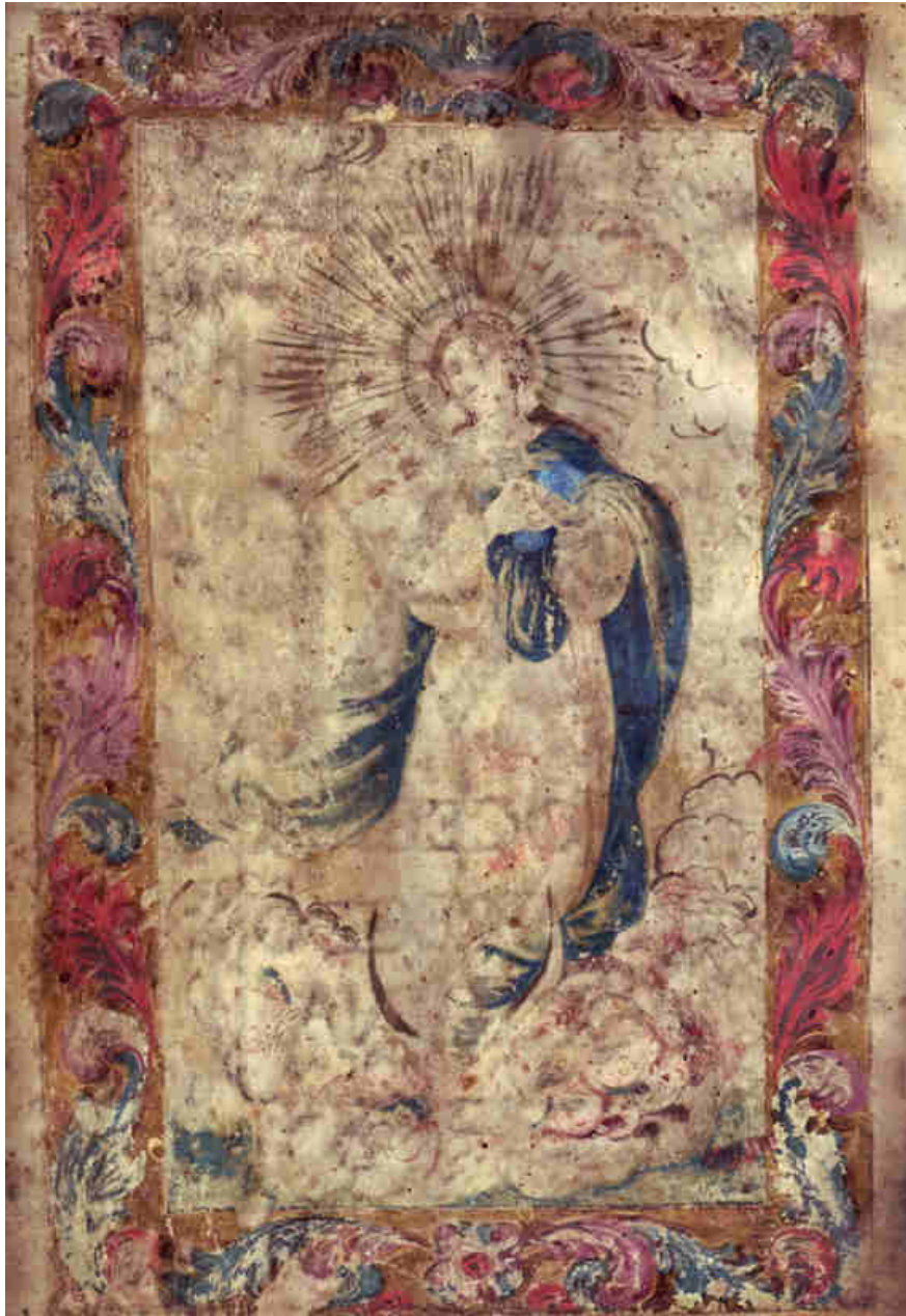
5. Inmaculada Concepción. Miniatura del Libro de Regla de la Hermandad Sacramental de la Magdalena, f. 43v.