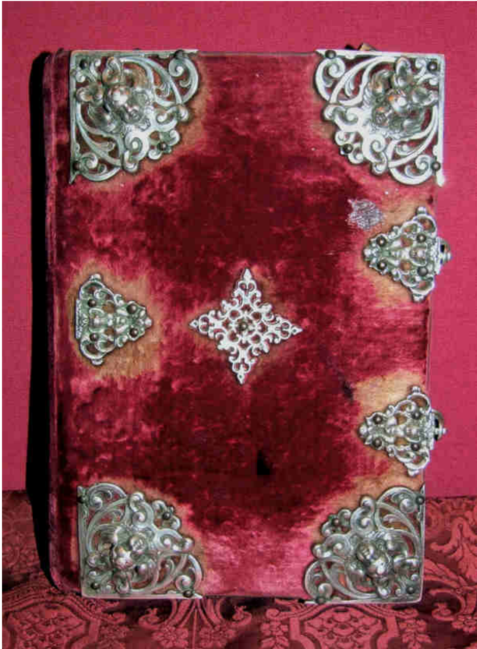
1. Libro de Regla de la Hermandad Sacramental de la parroquia de Santa María Magdalena de Sevilla, 1575. Encuadernación y apliques de plata del siglo XVIII.