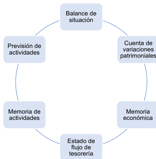
Gráfico 2.1. Estados contables.

El modelo contable que puede aplicarse a otra entidad cualquiera no es aplicable a las fundaciones por la principal diferencia en cuanto al fin. Estas entidades, las fundaciones, deberán realizar los siguientes estados contables: