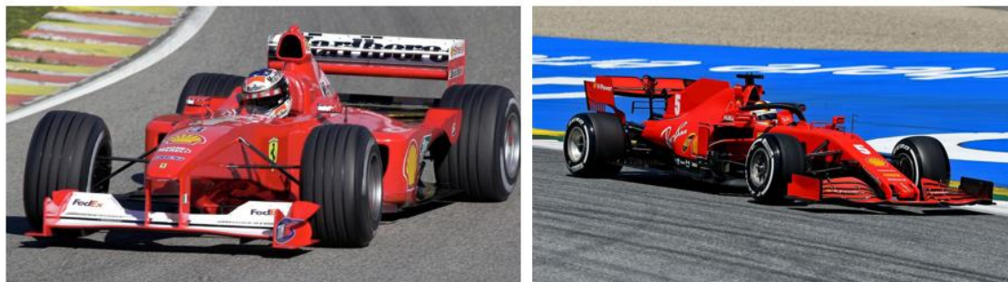
Comparativa de un coche del 2000 y uno de 2020

A partir del año 2000, un piloto se convertiría en el más laureado de la Fórmula 1. Un joven alemán ya había ganado dos títulos mundiales antes de dicho año y, a bordo de su Ferrari, se hizo con cinco títulos más hasta 2004. Michael Schumacher batió el récord de victorias, que ha estado vigente hasta 2020, cuando Lewis Hamilton lo ha superado. El fin a la ‘era Michael’ lo puso un joven español, Fernando Alonso, que ganó en 2005 su primer mundial con Renault. Desde entonces y hasta ahora, es importante destacar que hay dos escuderías que se han hecho con el monopolio de los triunfos desde 2010: Red Bull y Mercedes. Hay que retornar a 2009 para ver un equipo campeón que no sea uno de estos dos.