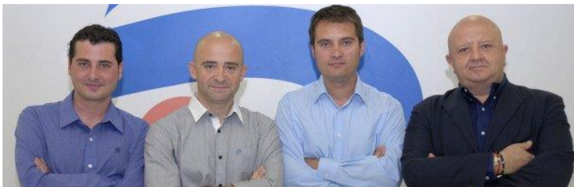
Equipo de Telecinco encargado de cubrir la F1

En ese mismo informe anual de 2004 se hace una comparativa de la audiencia de la Fórmula 1 en Telecinco y RTVE (emitían las carreras en 2003). Telecinco obtuvo un 32,9% de share en 2004 y, por su parte, en 2003, el dato de RTVE era del 19,7%, superando por poco el millón y medio de espectadores. En el target comercial también hay una clara diferencia. Telecinco marcó un 39,8% y, en cambio, RTVE, un porcentaje del 23,4. La diferencia era de 16,4 puntos en el target comercial y de 13,2 en la audiencia. Además, la retransmisión del Gran Circo incrementó el interés de este deporte en el Teletexto.