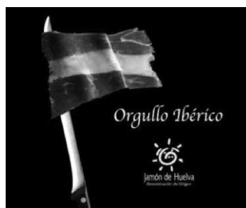
Figura 4. Imagen publicitaria de la DOP Jamón de Huelva

Tal como señalamos antes, la tradición productiva del jamón ibérico de bellota es inherente a la identidad cultural de las sociedades locales de las zonas de dehesa. La dehesa es el paradigma de la base de la calidad que vincula a un territorio (adehesado) con un histórico producto (jamón ibérico de bellota). Es un ejemplo, utilizado por todas las DOP s de jamones ibéricos, de los términos que encarnan la calidad suprema según sus consejos reguladores: la raza (ibérico) y el alimento (bellota).