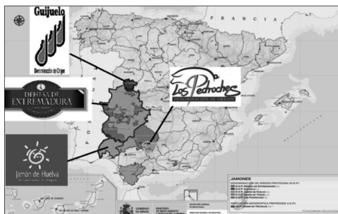
Figura 3. Mapa y logotipo de las cuatro DOP's de jamón ibérico en España

Por su parte, las DOP s del sector porcino ibérico en España comenzaron a gestarse en la década de los 80 del siglo pasado y actualmente representan el máximo exponente de la vinculación de un producto como el jamón ibérico con una profunda identificación de las poblaciones de este territorio con su medio ecológico: la dehesa; así como con los manejos agroganaderos e industriales que forman parte indisociable de la historia y la cultura locales. En la actualidad existen cuatro DOP s: Guijuelo, Dehesa de Extremadura, Jamón de Jabugo y Valle de los Pedroches.