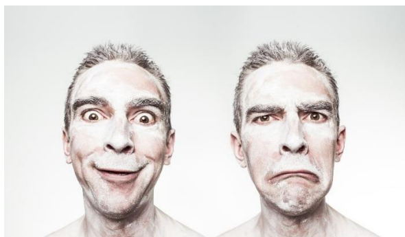
Imagen 2. Felicidad y tristeza