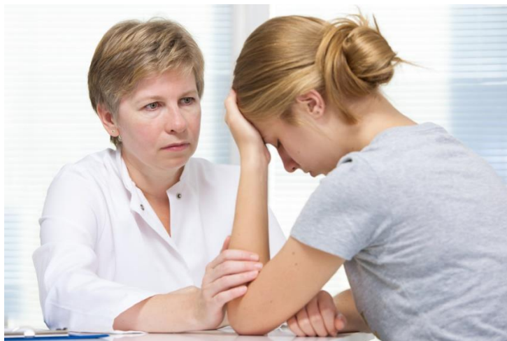
Imagen 3. Ejemplo de háptica

este acto de acercamiento no es conocida o en ese momento no es un sujeto de confianza puede agravar la situación, al no respetar el espacio corporal y sobrepasar los límites personales. En la siguiente imagen (3), se puede observar un ejemplo en el que un personaje está abatido y otro lo consuela poniendo una mano sobre su brazo. Sin necesidad de escuchar qué dicen se puede saber que no tiene ninguna intención maligna sino al contrario, quiere ayudar. Esto lo delata ese gesto.