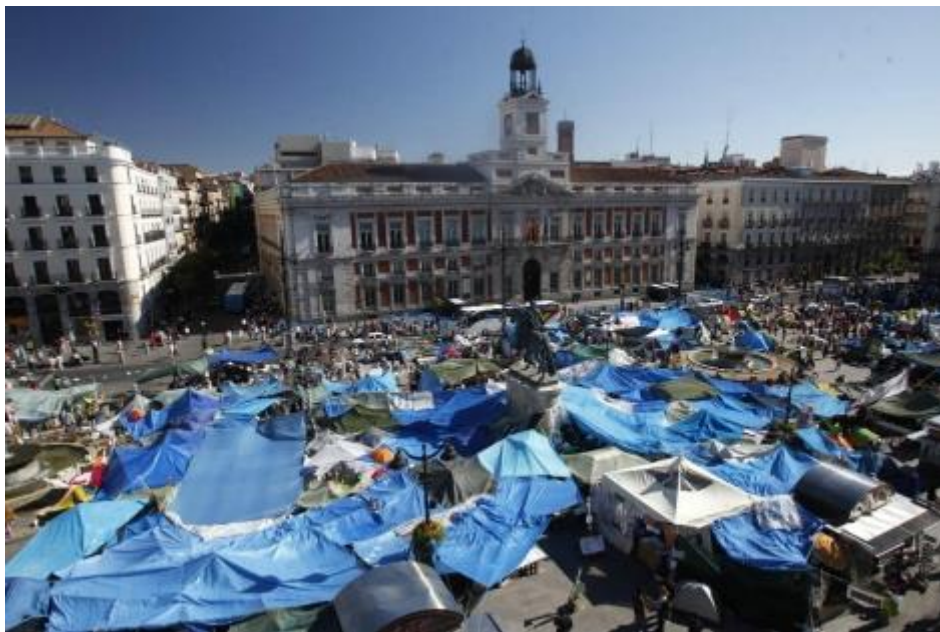
Imagen 6. Acampada en la Puerta del Sol por el 15M

Podemos es un partido que nació a raíz del 15M, un movimiento que se originó el 15 de mayo de 2011 en el que diferentes grupos de personas decidieron acampar en distintas plazas de España, siendo la más popular la Puerta del Sol en Madrid (Imagen 6). “Es una opinión extendida que Podemos constituía la expresión política del 15-M. Más bien debería decirse que Podemos capitalizó el profundo malestar social y político del 15-M” (Elorza, 2021). Capitanado por Pablo Iglesias, que antes de involucrarse de esta manera en política era profesor de Ciencias Políticas en la Universidad Complutense de Madrid, comenzó su éxito en las elecciones al Parlamento Europeo en 2014.