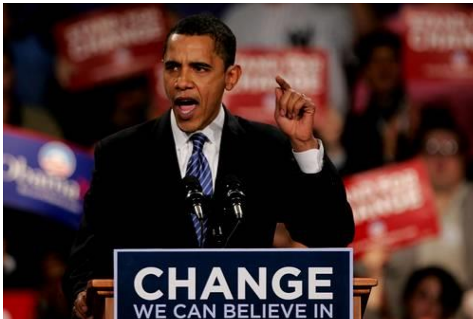
Imagen 5. Obama en el Caucus de Iowa

Barack Obama fue el primer presidente de origen afroamericano de la historia de EE. UU. No llegó a este puesto por casualidad, pues, su lenguaje corporal es uno de los más trabajados y carismáticos. Pero entre todos los marcadores, el más pronunciado y natural que se puede distinguir es el paralenguaje. La forma de hablar, su tempo y su entonación lo convierten en uno de los mejores oradores de entre todos los presidentes de este país. En su discurso después de haber ganado el Caucus de Iowa en 2008 se observa como mueve al público a su antojo y como sin gesticular en exceso, con su voz moldea las emociones de los espectadores, haciendo que vitoreen cada frase que llega a decir.