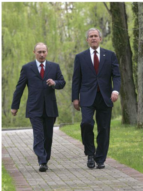
Imagen 4. Putin y Bush caminando

Putin, donde se puede ver caminando al lado de Bush en el documental, muestra una postura y una apariencia parecida al expresidente americano, pero al mismo tiempo, totalmente diferente. Los dos muestran signos de poder y dominancia, pero, no obstante, mientras Bush es elegante y controlado, Putin es descontrolado y más salvaje. Al igual que al presidente americano, en la imagen 4 se le puede ver caminando, siendo todo lo contrario al otro. Sus movimientos parecen desbocados, pero buscan una posición de autoridad. El movimiento de hombros está claramente marcado y las zancadas intentan ir centímetros por delante de Bush. Se evidencia que está en suelo norteamericano y debe mantener su imagen, la que lo ha llevado al éxito.