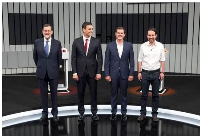
Imagen 7: Candidatos del primer debate a 4