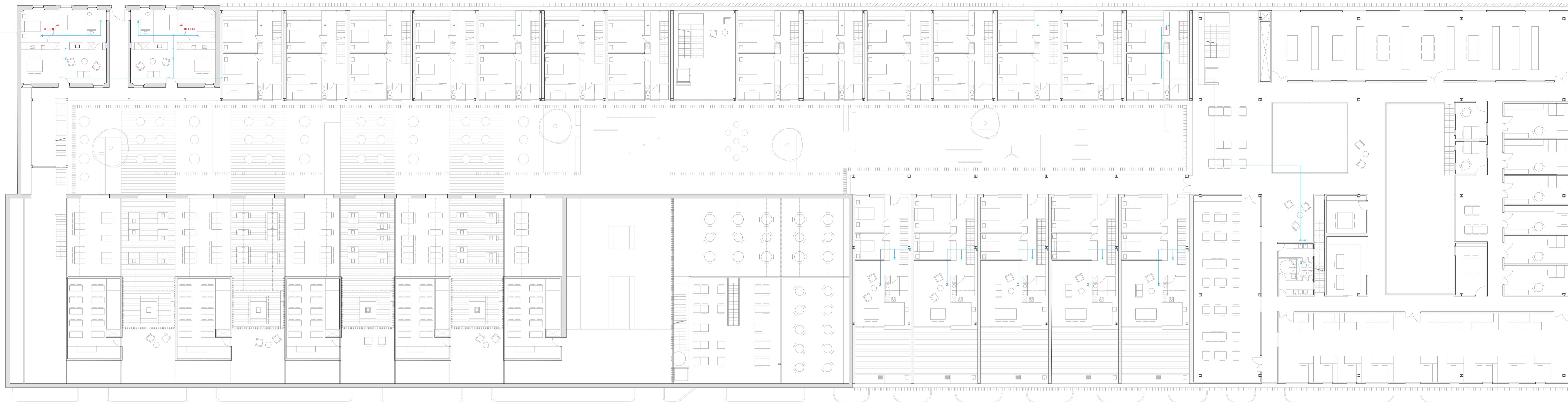
PLANTA PRIMERA +4.30 m