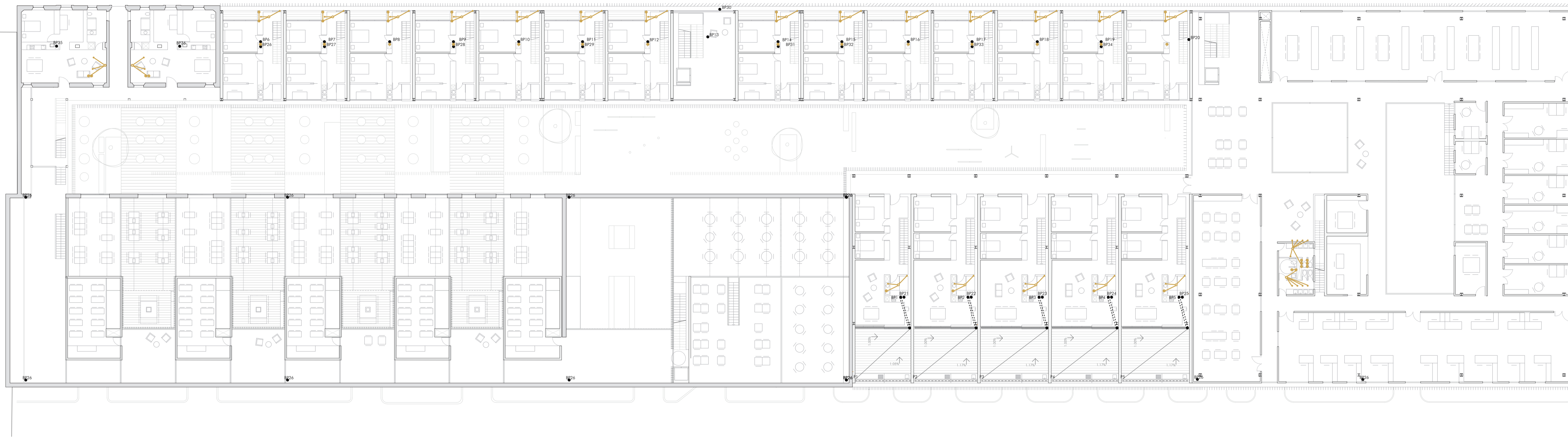
PLANTA PRIMERA +4.30 m