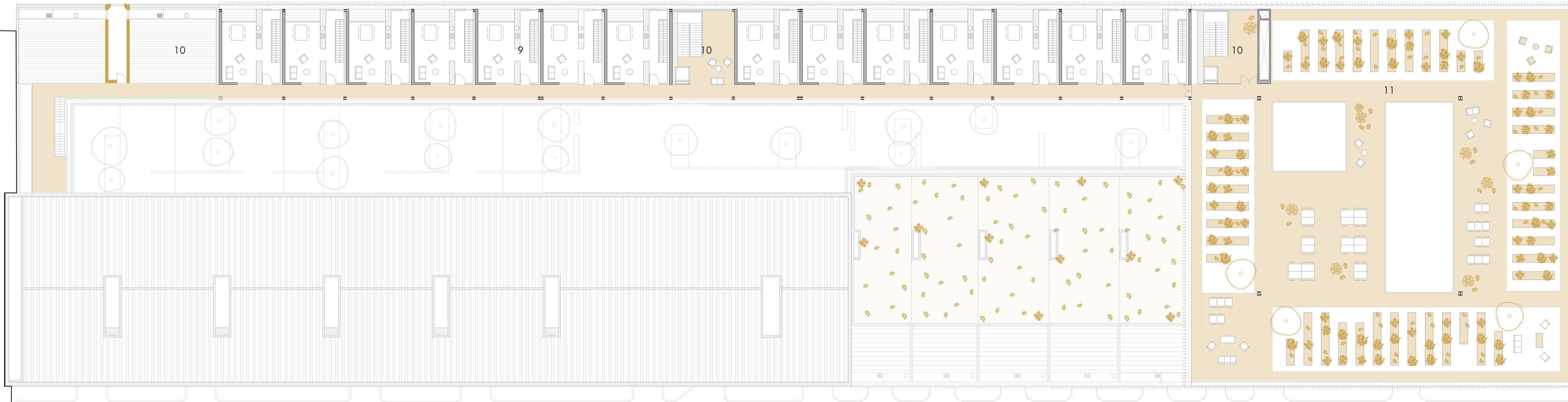
PLANTA SEGUNDA +8.60m