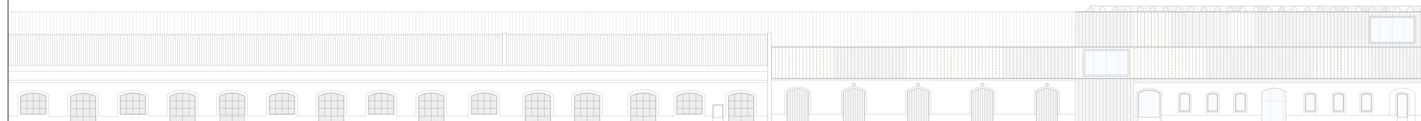
ALZADO B-B' CALLE INTERIOR NAVES