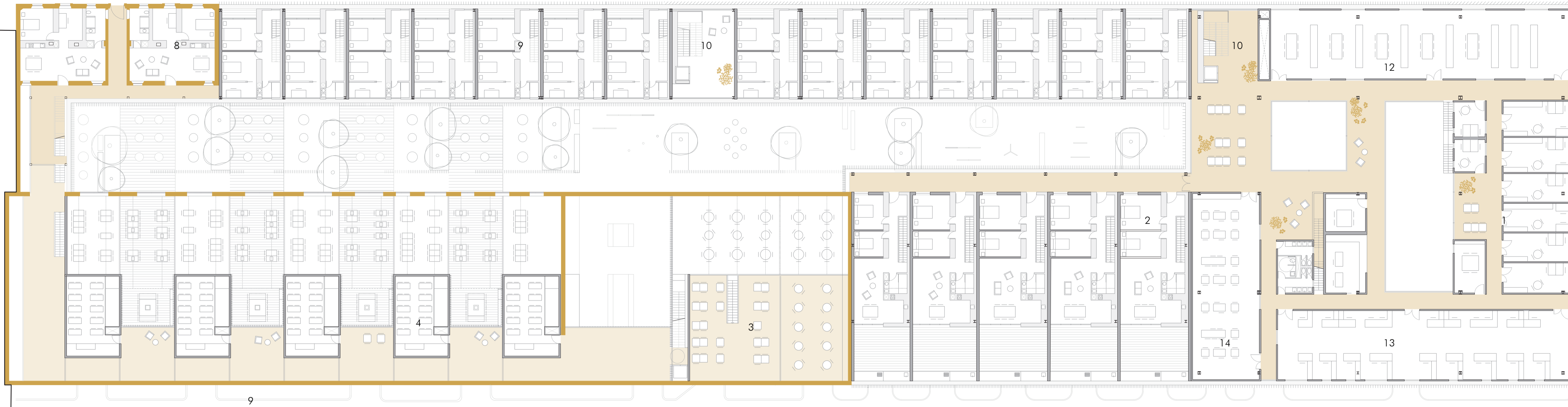
PLANTA PRIMERA +4.60m