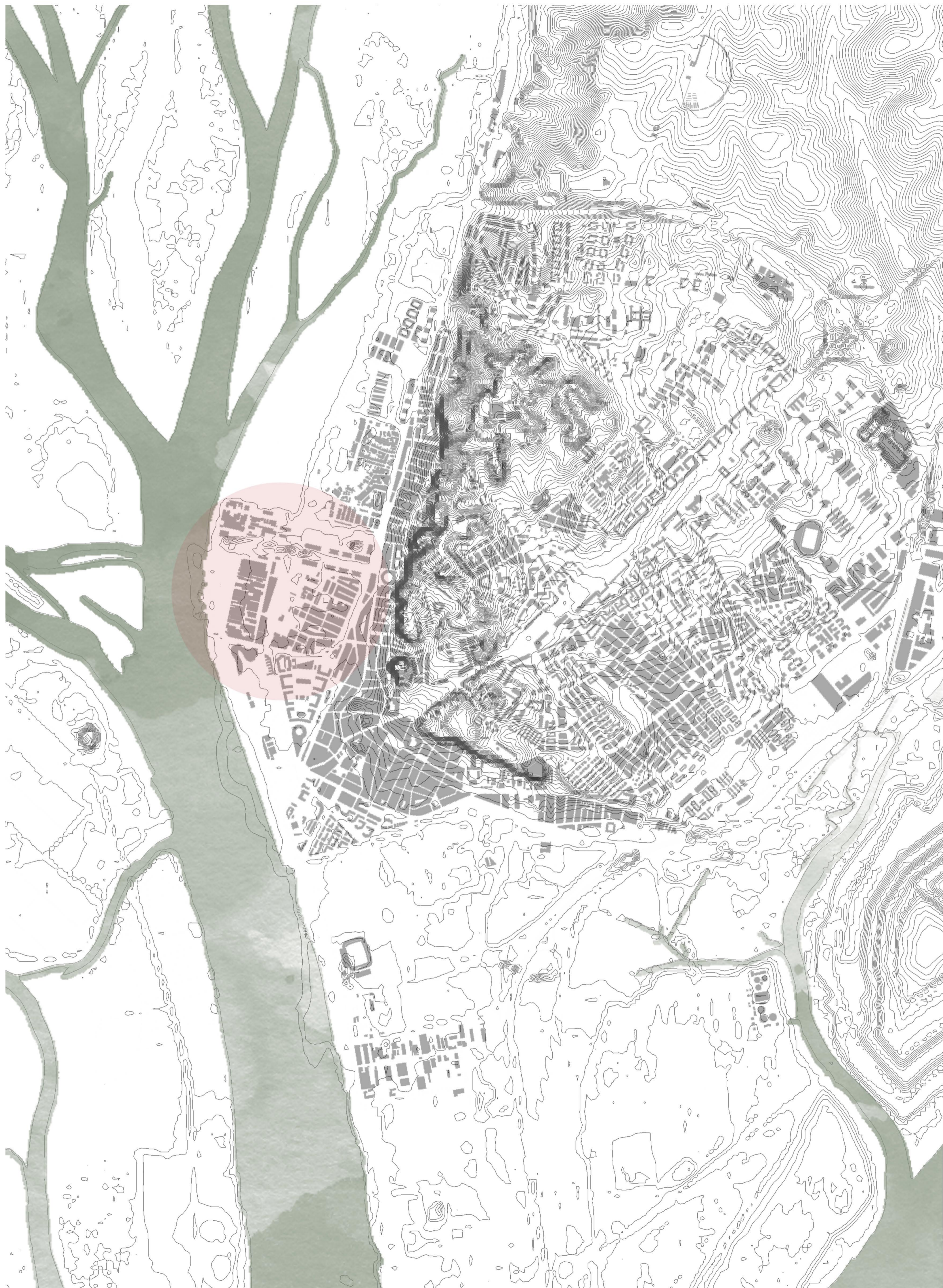
ESCALA CIUDAD - LOCALIZACIÓN ÁREA DE INTERVENCIÓN E 1/15.000