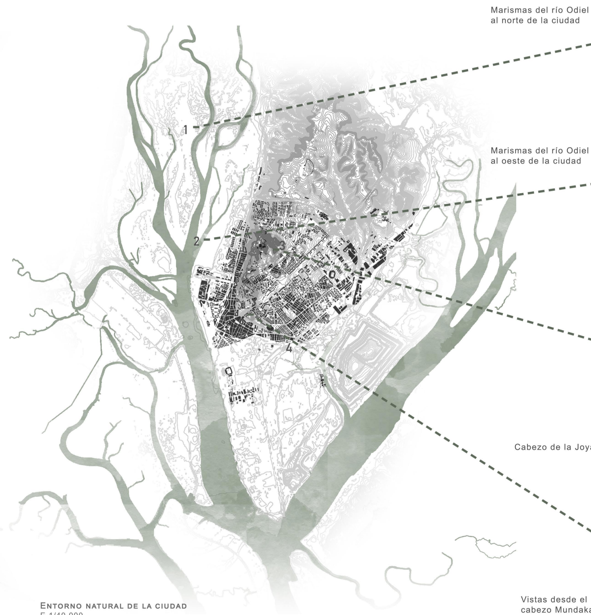
ENTORNO NATURAL DE LA CIUDAD E 1/40.000

Junto a esta topografía plana, el otro elemento natural ya comentado, son estas marismas. Este elemento se extiende con una forma característica, bifurcándose mediante formas orgánicas en diferentes ramales y adentrándose en la tierra de diferentes maneras. Estos dos elementos han sido determinantes a la hora de llevar a cabo el proyecto urbano, pues son dos claros referentes de la ciudad de Huelva.