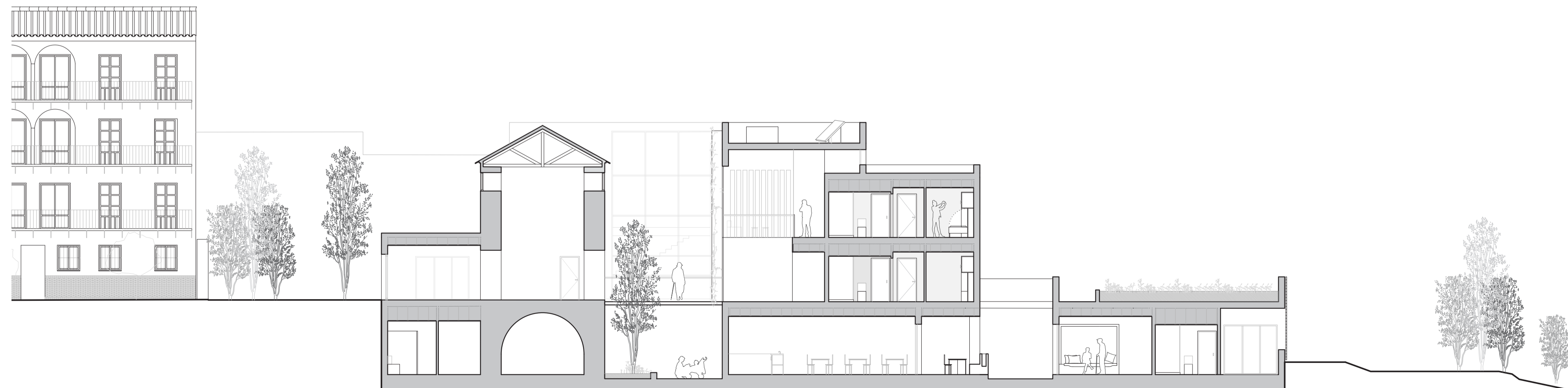
SECCIÓN TRANSVERSAL A-A'