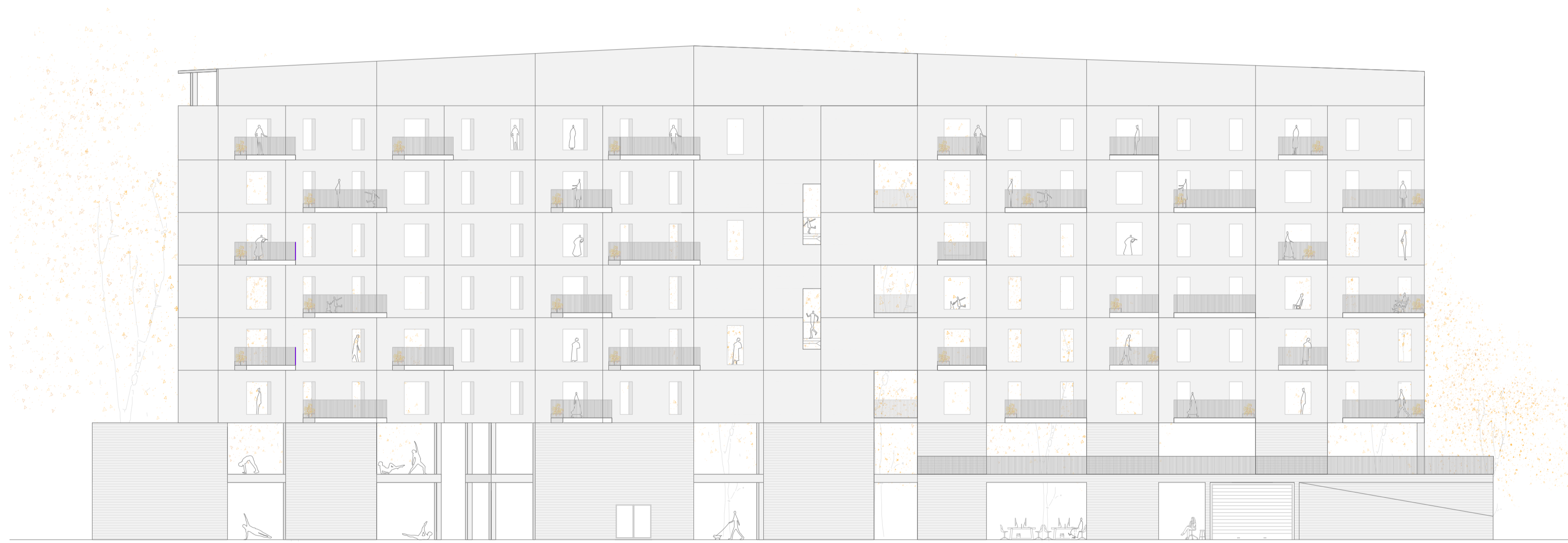
ALZADO OESTE-AL PARQUE 1-1'