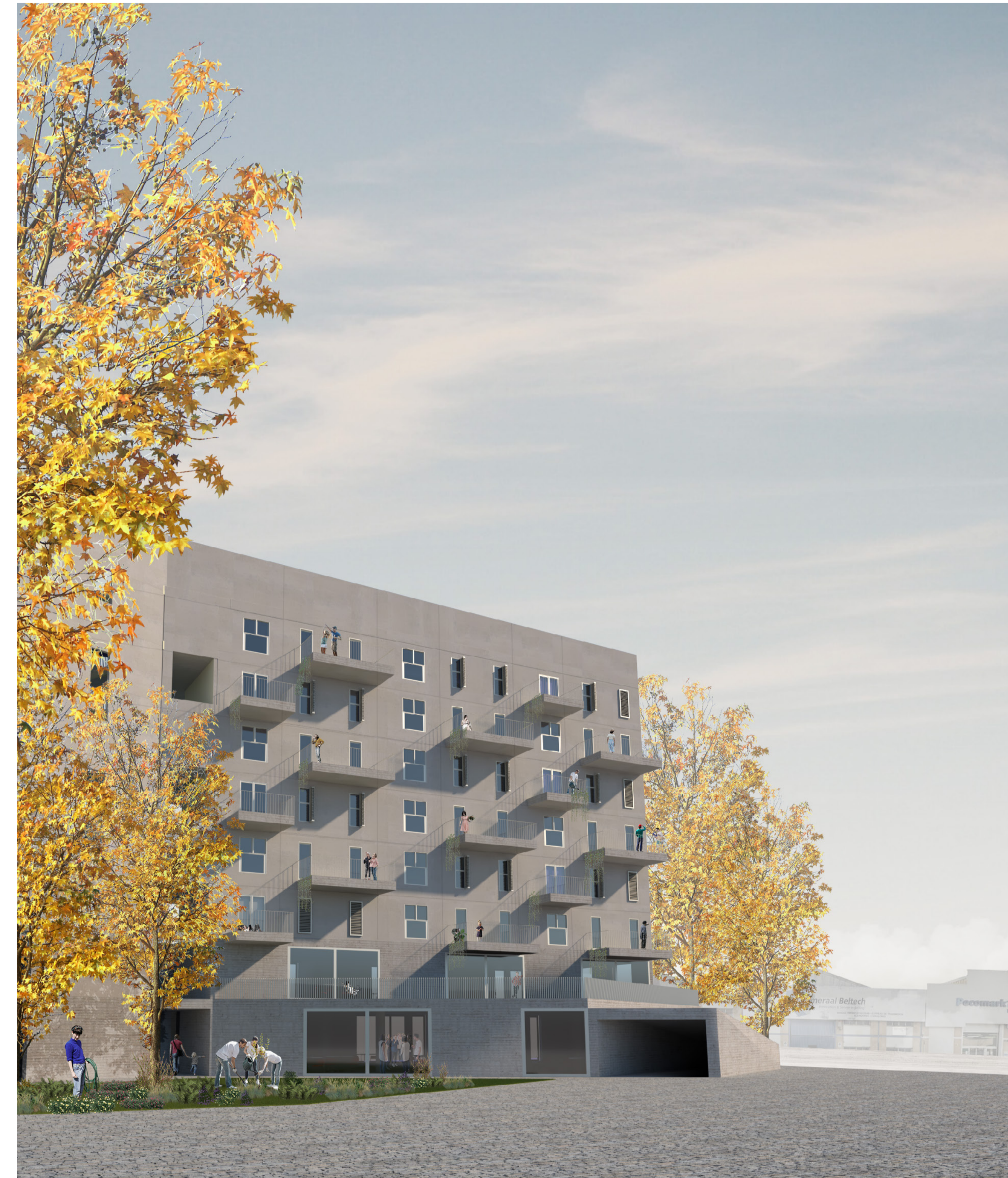
VISTA FACHADA AL PARQUE

LA PLANTA DEL PEATÓN Es la estereotómica del edificio, aspecto que abarca como campo Baeza define: aquello en que la gravedad se transmite de una manera continua, en un sistema estructural continuo donde la continuidad constructiva es completa. Es la arquitectura masiva, pétrea, pesante. La que se asienta sobre la tierra como si de ella naciera. Es la arquitectura que busca la luz, que perfora sus muros para que la luz entre en ella. Es la arquitectura del podium, del basamento. Es, para resumirlo, la arquitectura de la cueva. En el edificio Es la planta que invita al paseo, a recorrerla, a pararte y entrar, en esta cota se albergan las acciones más públicas y comunes, en concreto un coworking y un gimnasio, que se desarrollan hasta la siguiente y última planta de este basamento. Constructivamente se materializa mediante la continuación del muro de sótano que envuelve estas plantas y les da sentido.