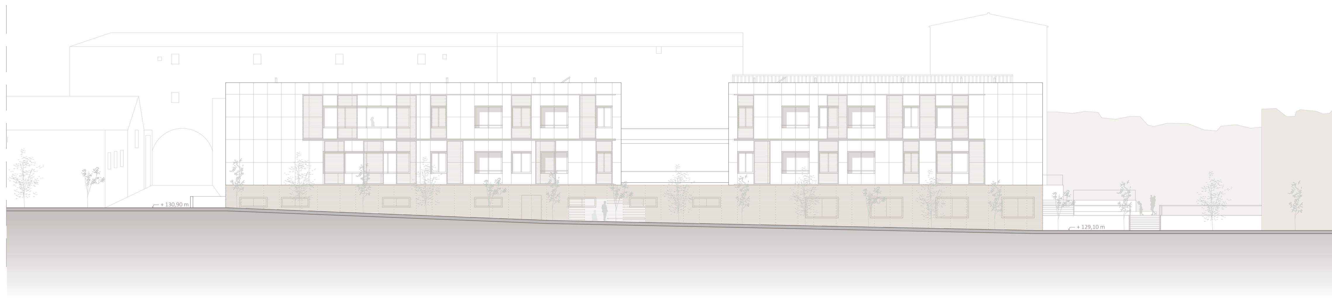
ALZADO DE LA CTRA. DE CARMONA; SECCIÓN A-A'