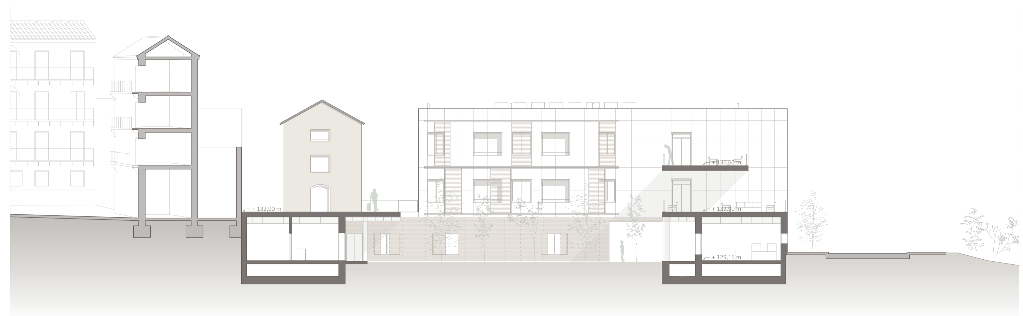
ALZADO INTERIOR; SECCIÓN B-B'