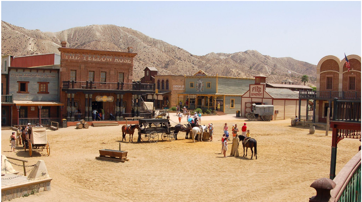
-Pueblo de Tabernas: