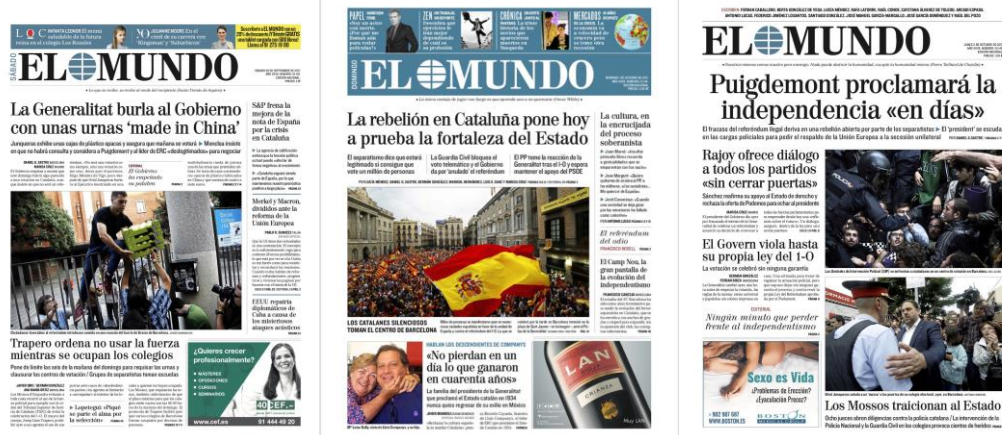
Portadas de El Mundo ordenadas por fecha, de más antigua a más reciente.