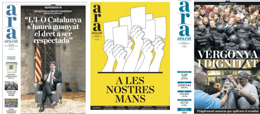
Portadas del Diari ARA ordenadas por fecha, de más antigua a más reciente.

Ya de primera vista, observamos como el Diari ARA llama más la atención debido a su fotoportada, pero el mensaje de cada una de las portadas lleva connotaciones de opinión. Empezando por el 30 de septiembre, una entrevista al President de la Generalitat abre el periódico del día. Teniendo en cuenta que los medios de comunicación no pueden posicionarse fuera de campaña electoral, que finaliza dos días antes del día correspondiente a la emisión de los votos. El 1 de octubre insta a la población catalana a salir a la calle a votar bajo el lema “ A les nostres mans ” (en nuestras manos). Además, el color amarillo es predominante en la portada, emulando así el significado del color amarillo asociado con la independencia de Cataluña. Ya el 2 de octubre, la portada define la jornada y los actos del día anterior como “ Vergonya i dignitat ” (“Vergüenza y dignidad”), además observamos cómo se resaltan los