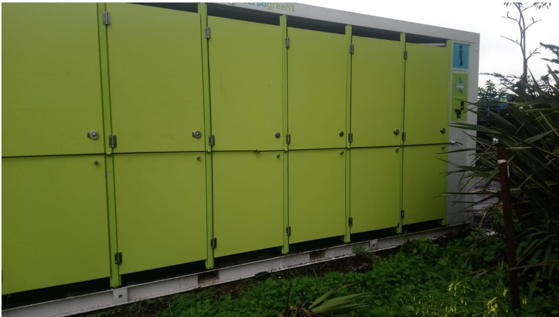
Espacios habilitados para el aseo