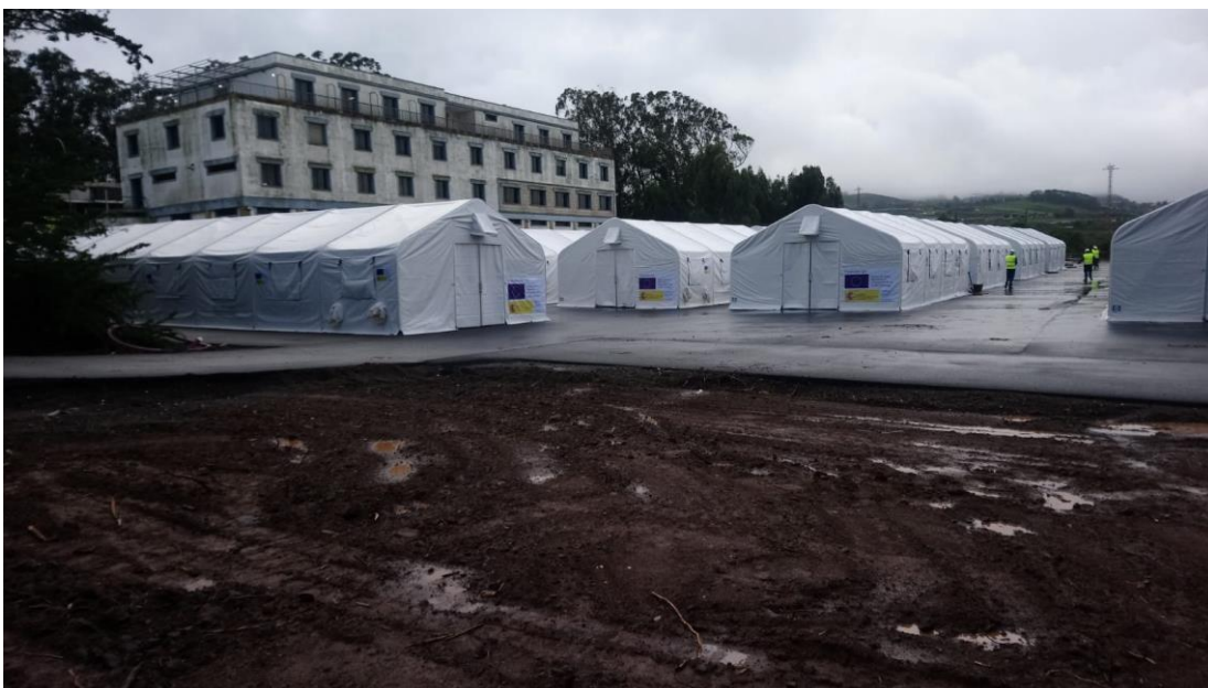
Campamentos para inmigrantes en La Esperanza, El Rosario, Tenerife.