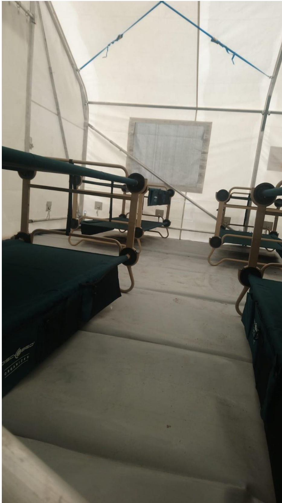
Espacios habilitados como dormitorios