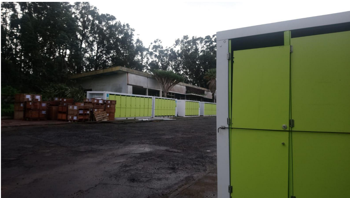
Espacios habilitados para el aseo