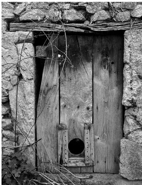
Puerta con gatera

y, teniendo tres, un rodeo sí y otro no» (SPC 253). La rotación era continua de año en año: donde se hubiese interrumpido la correcasa al concluir la temporada, allí daba comienzo al año siguiente: «acabándose la velía de correcasa, los alcaldes tengan obligación de asentar en nuestro libro de concejo en qué casa quedó dicha velía para que al año siguiente se comience a guardar [la velía] desde donde feneció en adelante» (Fresno de la Valduerna, 1643 SPC 395).