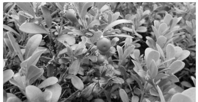
Gayuba ( Arctostaphilus uva-ursi )

variantes genuinas del nombre de la gayuba: agabuja (Luna; Argüellos), agabuchas (Villacidayo), agaúja (Luna y Riaño), gabusa y gabuja (Luna), gabujal (Luna y Babia), gabusia (Babia), gabuxa (Bierzo y Ancares) (Sanz Elorza 2013: 56; Esgueva y Llamas 2005: 146; LLA IV: 13; PET III: 246; DGLA); en gallego, agallúa (DdD). 3 Agauja ‘gayuba’ consta en el DRAE desde 1817 como voz propia de León (RL 141, 224; es voz consignada en 1763 por el botánico José Quer). Corominas la considera forma castellanizada de * agauya (DCECH s.v. gayuba). Aluden claramente a Arctostaphilus uva-ursi ciertos topónimos menores: El Gabusal (Poladura de la Tercia, BLE 3.2.1950; Campo [Cármenes]); El Abaujalon (Lorenzana, monte de La Matona, 1926 PñL). En San Feliz de Torío, pueblo a unos 8 km de Lorenzana, E. Presa Valbuena registra la voz agauja ‘gayuba’ (RL 224).