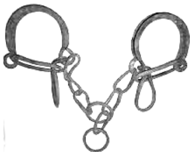
Trabas o sueltas para caballerías

rión P). En Prioro, El Praizuelo (BLE 27.4.1933) = El Prauzuelo (Canal Sánchez-Pagín 1999: 81). Dado que prada es voz conocida en el área, 6 cabe partir de *pradizuela , praduzuela para llegar a prazueta , pranzuela . De hecho, en Molinaseca hay un paraje La Praizuela . La nasalización puede haberse visto favorecida por la tendencia a disimilar ambos diptongos *prauzuela > pranzuela .