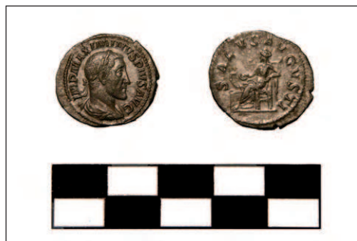
Lámina II. Denario de Maximino I (nº 39)

Todos estos datos numismáticos (Figs. 1 y 2), como indicábamos antes, precisan la corroboración de la documentación recabada en el registro estratigráfico de la excavación, encontrándonos a la espera de que la dirección de la intervención arqueológica nos facilite dicha información para concluir nuestro estudio.