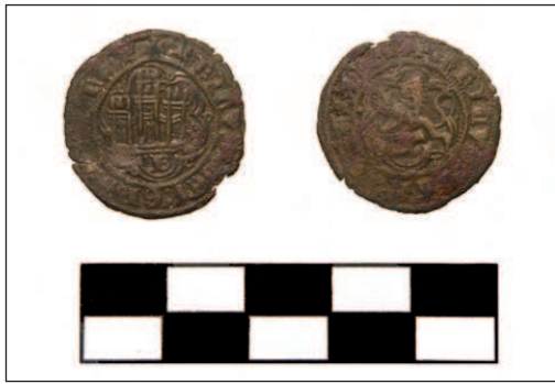
Lámina IV. Blanca de Enrique III (nº 477)