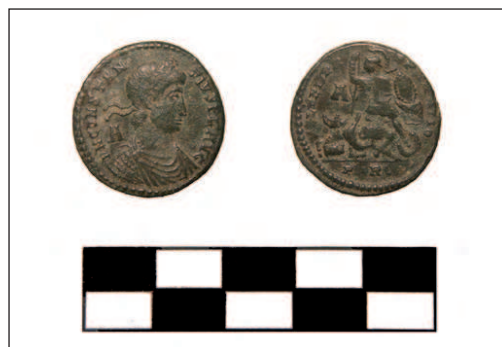
Lámina III. AE 2 de Constancio II (nº 227)