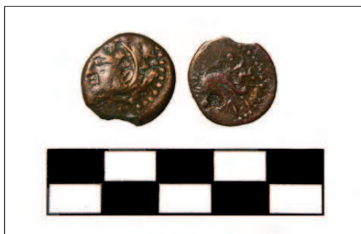
Lámina I. Cuarto de Gadir (nº 1)

Las piezas recuperadas en estas dos campañas arqueológicas ofrecen una buena muestra de la evolución histórica de la ciudad. Las cecas hispanas están representadas, entre otras, por monedas de Gadir (Lámina I), de Obulco y Corduba , todas fechadas entre fines del siglo III a.C. e inicios del siglo I a.C. Esta cronología anterior a la primera ocupación antrópica de esta zona, que tiene lugar a inicios del Imperio, nos llevaría a pensar bien en un uso muy prolongado de estas monedas, o bien, en un depósito secundario de materiales procedente del cercano asentamiento humano anterior a la fundación de la colonia romana.