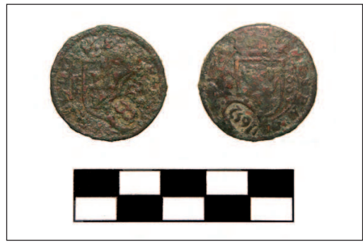
Lámina V. 8 maravedíes de Felipe IV (nº 510)