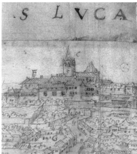
Lám. 3. Sanlúcar de Barrameda en el plano de Antón Van den Wyngaerde.