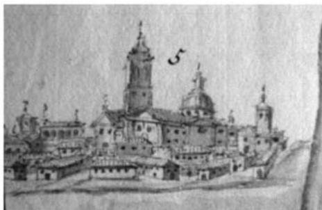
Lám. 2. Detalle de la ciudad de Sanlúcar en el plano de Díaz Pinto.