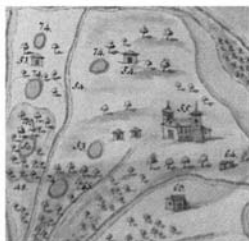
Lám. 5. Santuario del Rocío (nº 55) y alrededores.