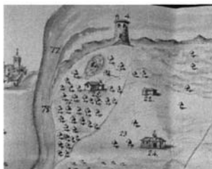
Lám. 4. Venta la Berraca (nº 25) y hacienda con capilla (nº 24).