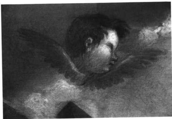
4. José María Arango. La Santísima Trinidad . Detalla de cabeza angélica.