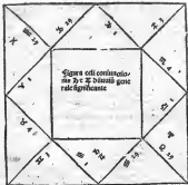
Figura loca est ad latitudinē 31-gra. Chierusalem. Tameñ fm aliquo afel sine natiuitate pfi fuit 2-gra. 51. mi. 34. fecunda hōc: e sic natus fuit per terciā partem hōc ante mediam noctem sed ponendo 3-gra. virginis natus fuit ceter per duas hōc ante mediam noctem ut patet.