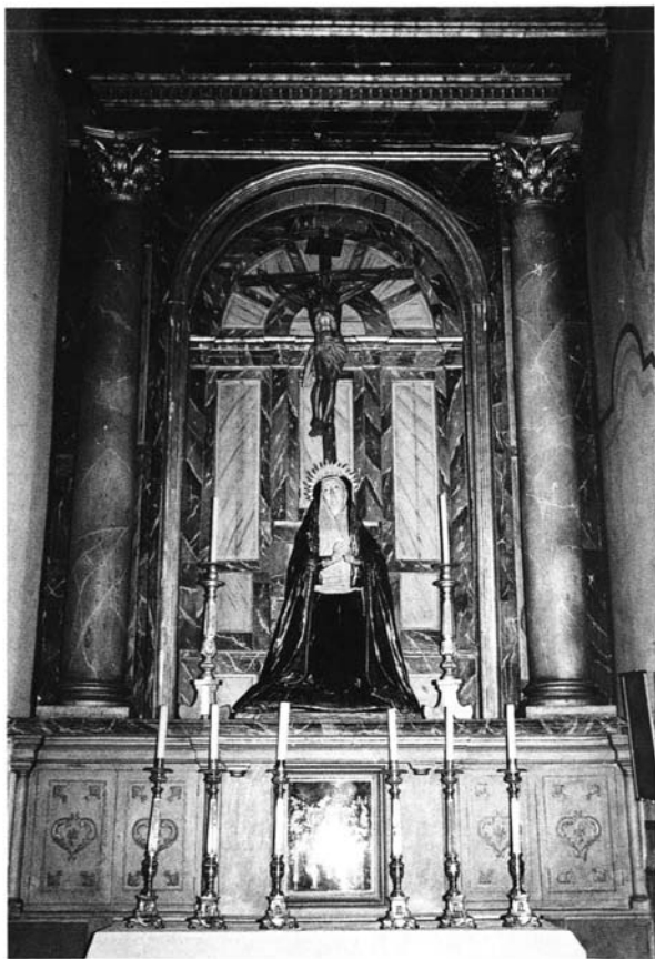
Lámina 5: Caja central del retablo de Jesús Nazareno. Parroquia de Santa Genoveva, Sevilla.