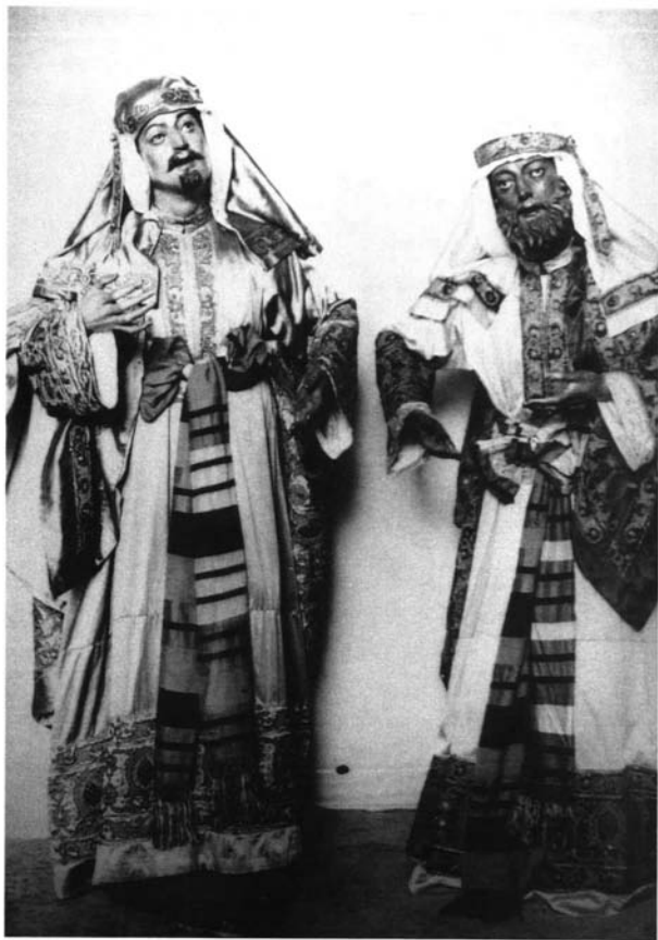
Lámina 1: Hebreos de la Sagrada Entrada de Jesús en Jerusalén. Año 1805.