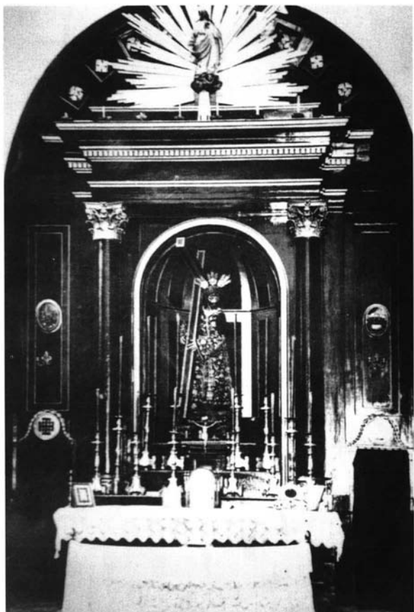
Lámina 4: Retablo de Jesús Nazareno. Capilla de Jesús Nazareno, Sevilla. Año 1828.