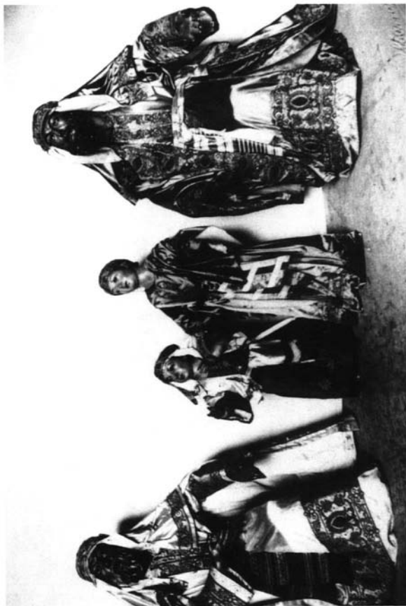
Lámina 2: Hebreos de la Sagrada Entrada de Jesús en Jerusalén. Año 1805. Los dos niños son del siglo XVIII.