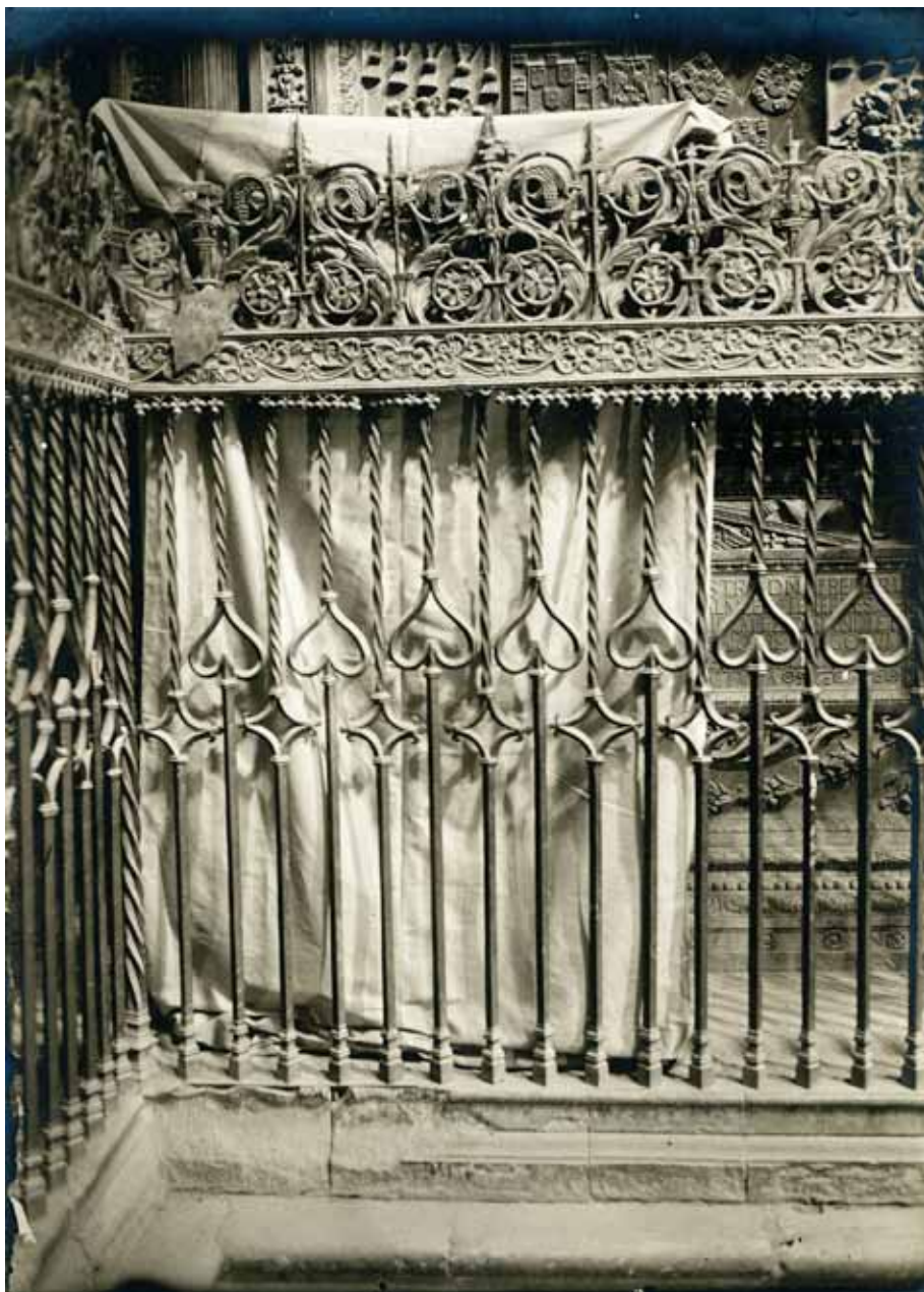
Figura 4. Reja de la capilla de santa Librada. Antes de su destrucción en 1936. Archivo Fotográfico. Biblioteca Tomás Navarro Tomás (CCHS-CSIC). Reg. 40.689.