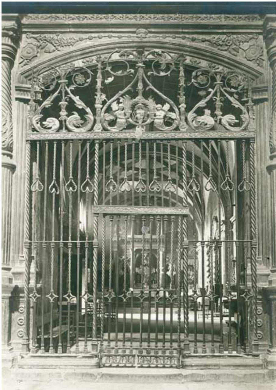
Figura 1. Reja de la capilla de san Pedro. Imagen fotográfica anterior a la Guerra Civil. Reg. 40.692.