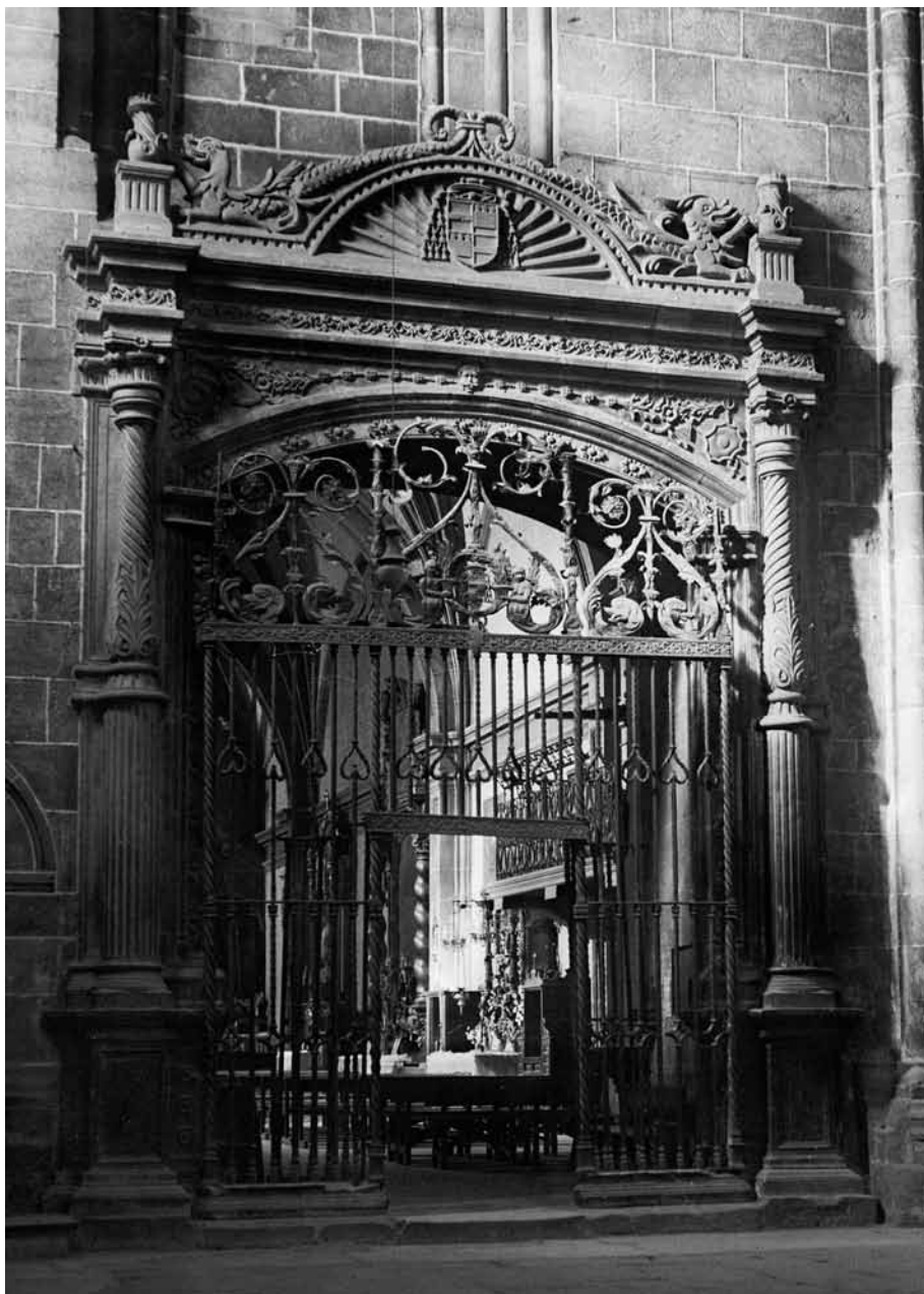
Figura 2. Reja de la capilla de san Pedro. Año: 1920-1940.