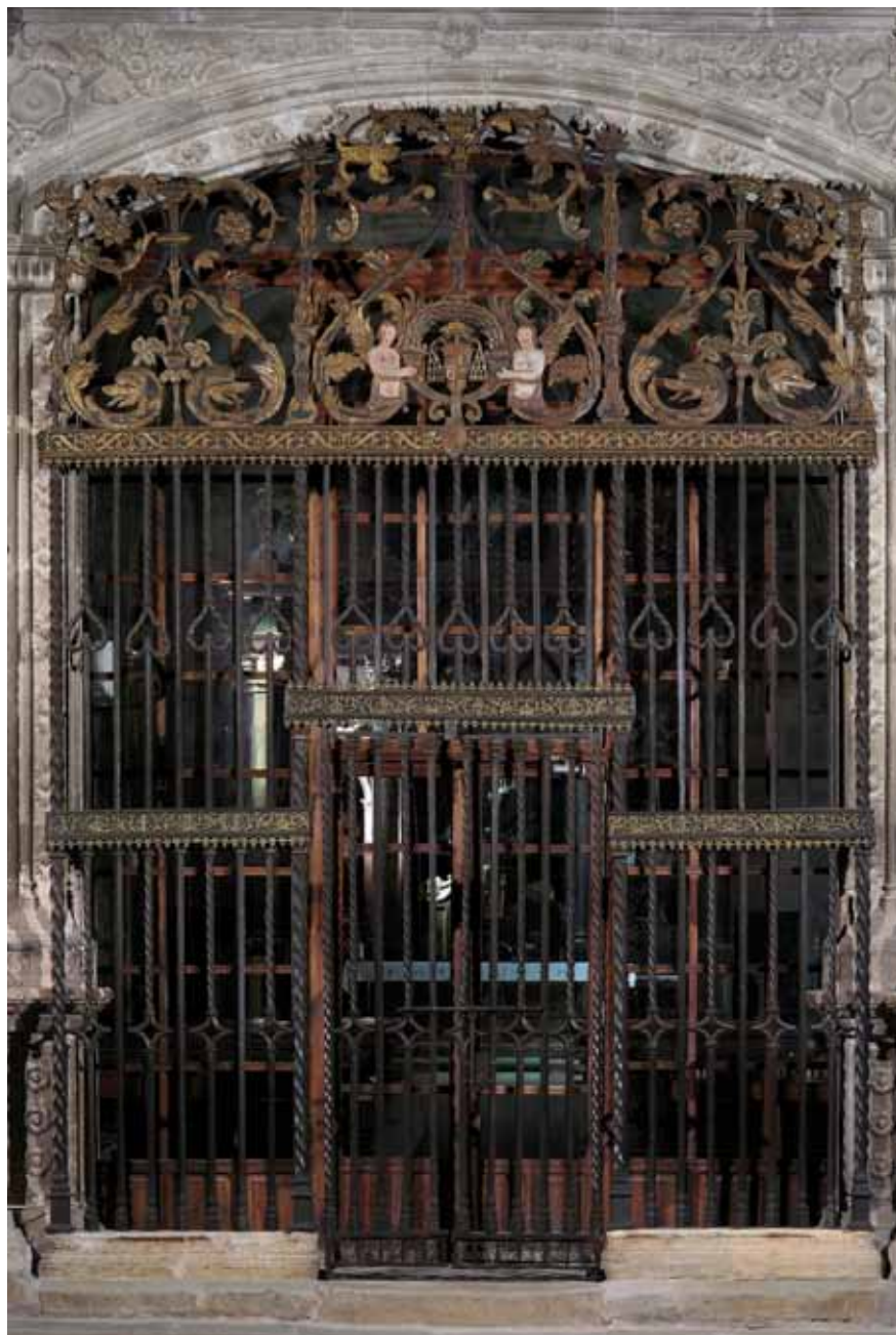
Figura 5. Reja de la capilla de San Pedro. Tras su restauración. Autor: J. Gómez de Llarena.