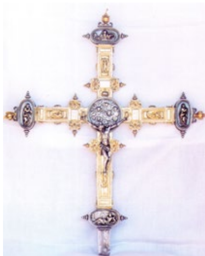
Figura 9. Cruz parroquial, hacia 1610, atribuida a Gabriel de Cevallos, parroquia de Copernal (Guadalajara).