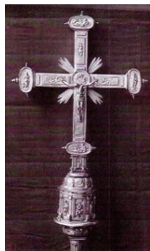
Figura 3. Cruz parroquial, hacia 1590, atribuida a Francisco Merino, parroquia de Colmenar Viejo.