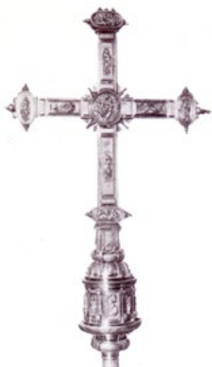
Figura 2. Cruz parroquial, hacia 1580, atribuida a Francisco Merino, parroquia de Villacarrillo.