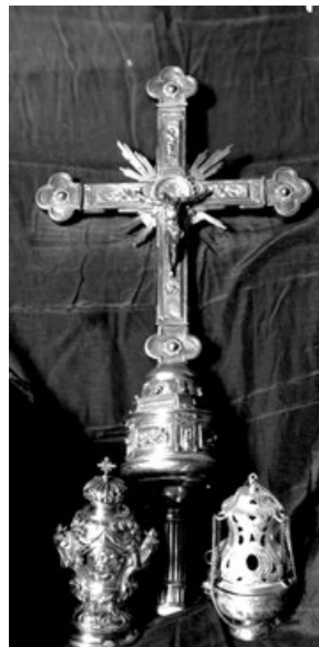
Figura 1. Cruz patriarcal de Francisco Merino, 1587, Catedral de Sevilla.