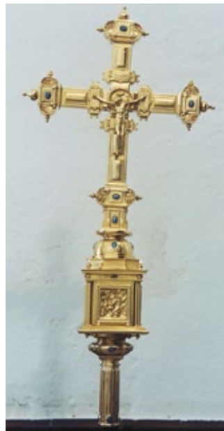
Figura 5. Cruz parroquial, 1595, Francisco de Alfaro, parroquia de San Juan de Marchena.