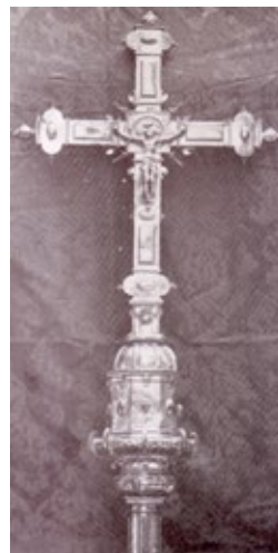
Figura 7. Cruz parroquial, 1601, Francisco de Alfaro y Oña, parroquia de Santa Cruz de Sevilla.