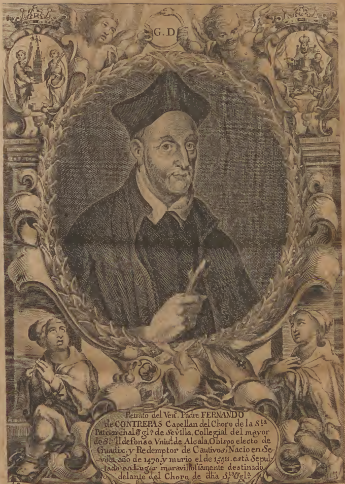
Retrato del Ven. Padre FERNANDO de CONTRERAS Capellan del Choro de la S ta Patriarcal y Gl ia de Sevilla, Collegial del mayor de S ta Ildefonso Vni er . de Alcala, Obispo electo de Guadix, y Redemptor de Cautivos; Nacio en Se- villa año de 1470, y murio el de 1548. está sepul- tado en Lugar maravillosamente destinado delante del Choro, de d ha S ta y Gl ia .