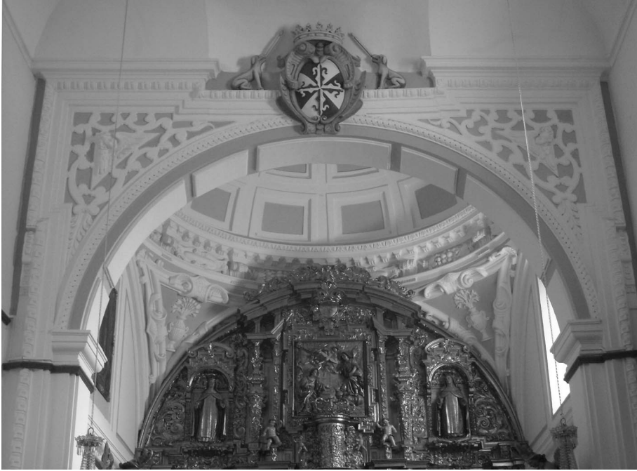
Figura 5. Arco triunfal y capilla mayor.