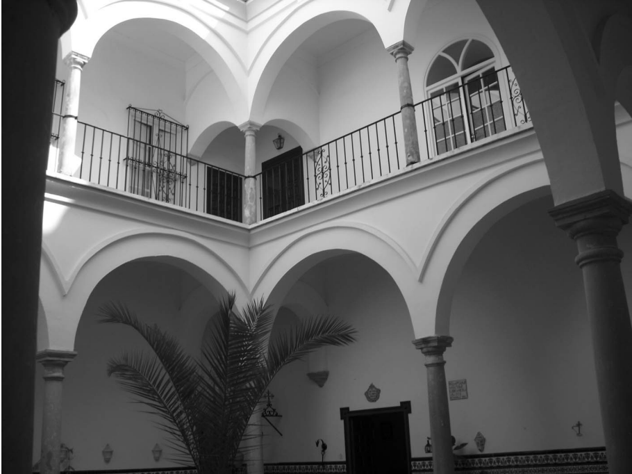
Figura 12. Patio de la condesa.