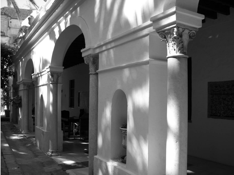
Figura 1. Galería del patio. Palacio ducal de Medina Sidonia. Sanlúcar de Barrameda.