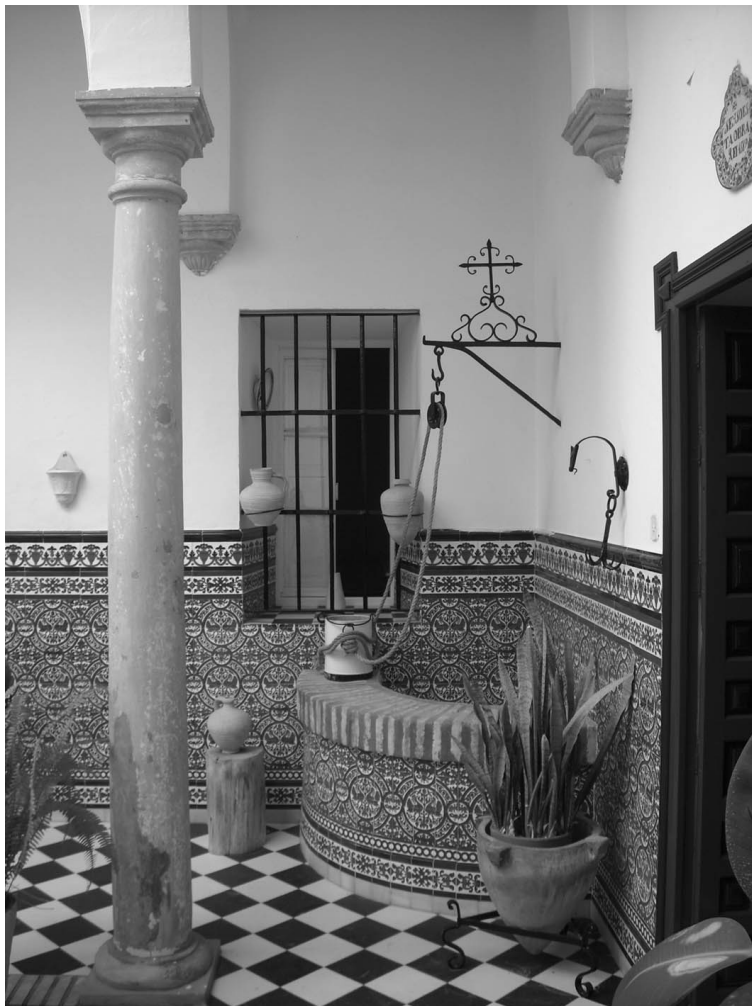
Figura 11. Patio de de la condesa. Arcada y pozo angular.