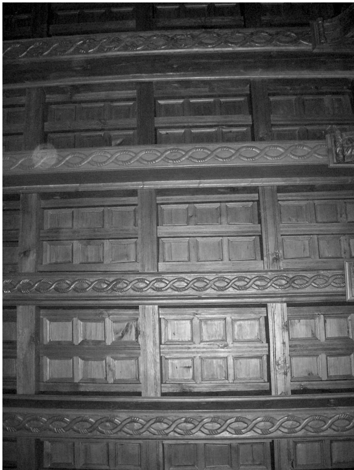
Figura 8. Artesonado del coro bajo.