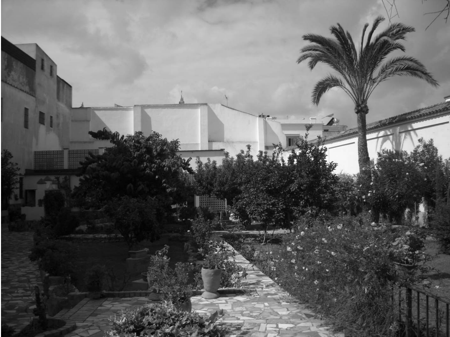
Figura 3. Actual huerta y jardín conventual.