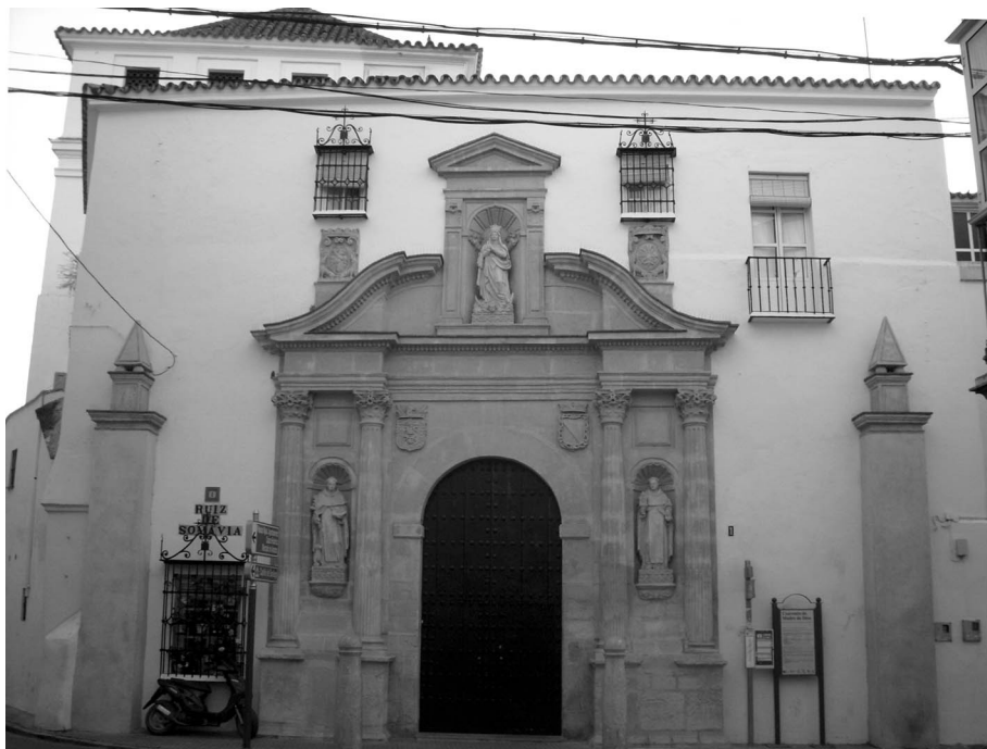
Figura 2. Portada de la portería. Convento de Madre de Dios. Sanlúcar de Barrameda.