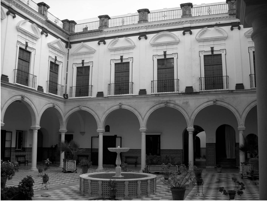
Figura 10. Claustro principal.