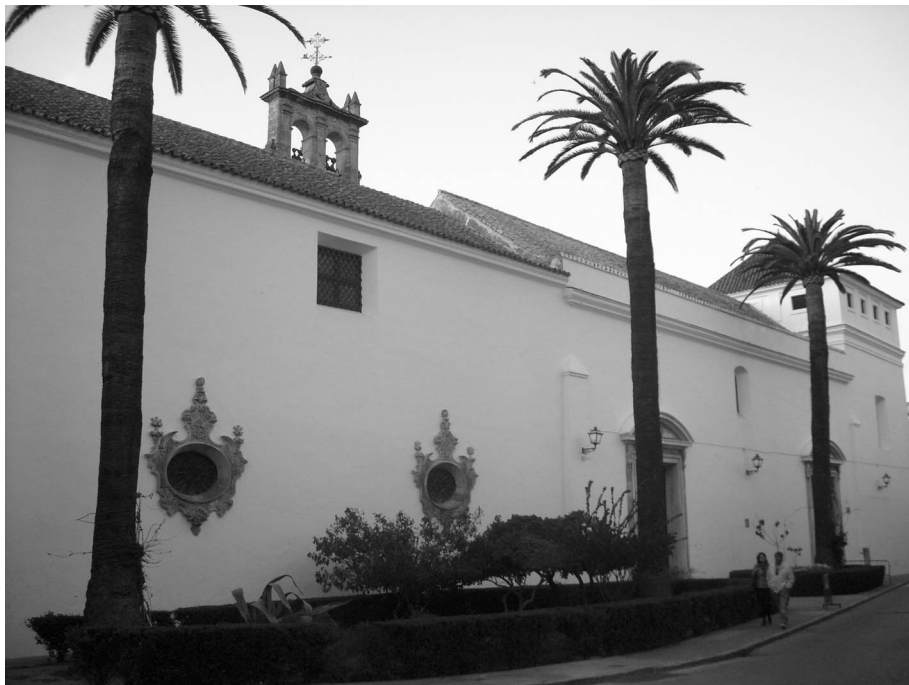
Figura 9. Volumen exterior de los coros alto y bajo e iglesia a la plazuela de Madre de Dios.