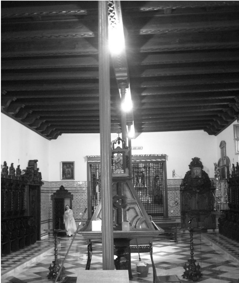
Figura 7. Coro bajo.