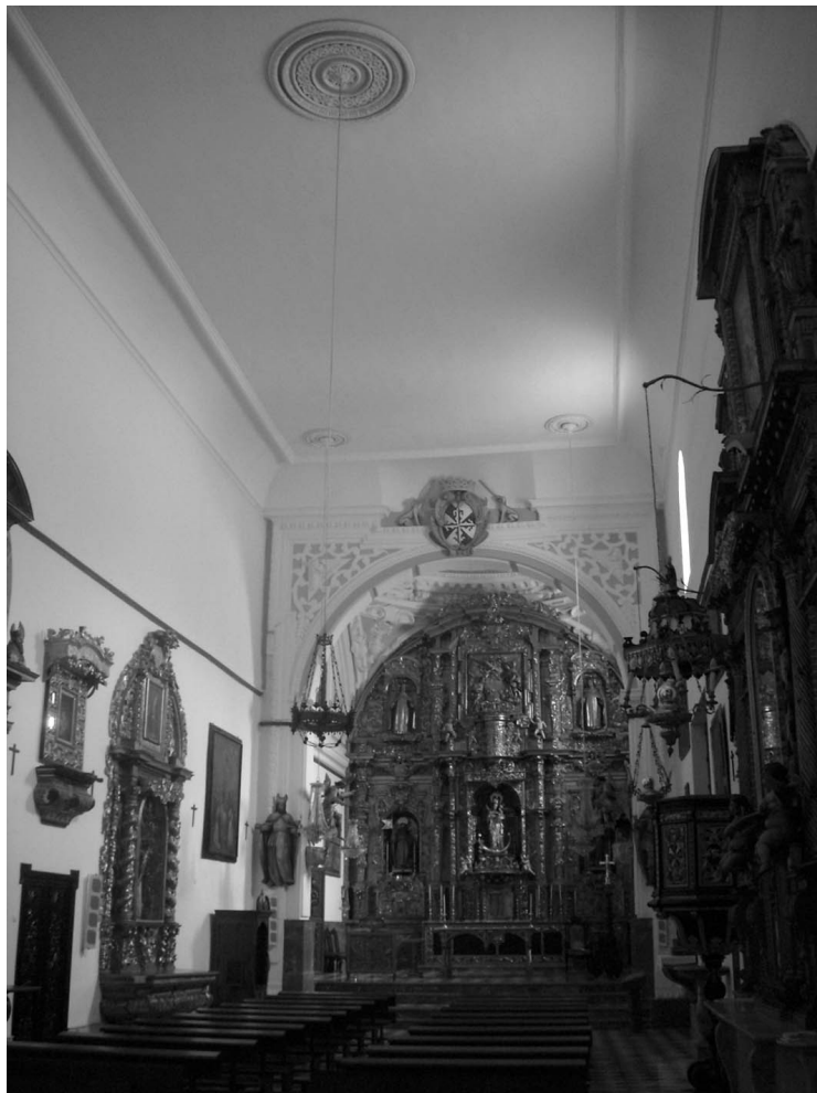
Figura 4. Interior de la iglesia.