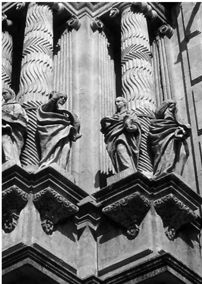
Figura 3. Segundo cuerpo de la portada del Palacio de San Telmo, con fustes de estrías en zig-zag.