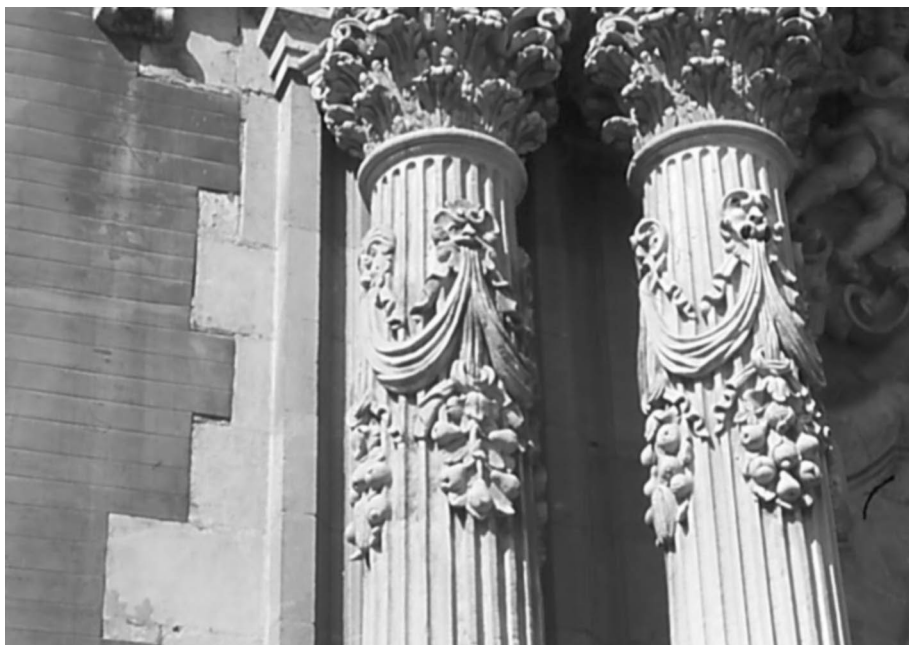
Figura 4. Carátulas con cintas y frutos de la portada del Palacio arzobispal.