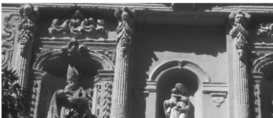
Figura 5. Segundo cuerpo de la portada de la iglesia de San Juan de Dios, con cabezas entre volutas.