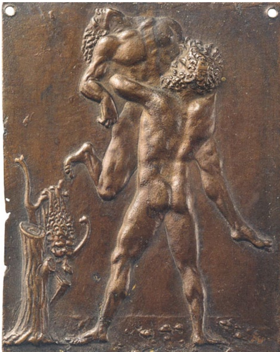
Fig. 8b. Lucha de Hércules y Anteo. Plaqueta de Maestro de las Hazañas de Hércules (c. 1500).