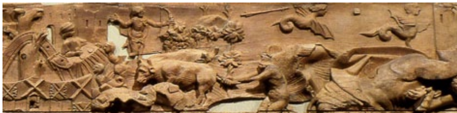
Fig. 4. Hércules y las Harpías en la mesa del rey Fineo. Detalle de un friso del castillo de Vélez Blanco. Museo Nacional de Artes Decorativas de París.