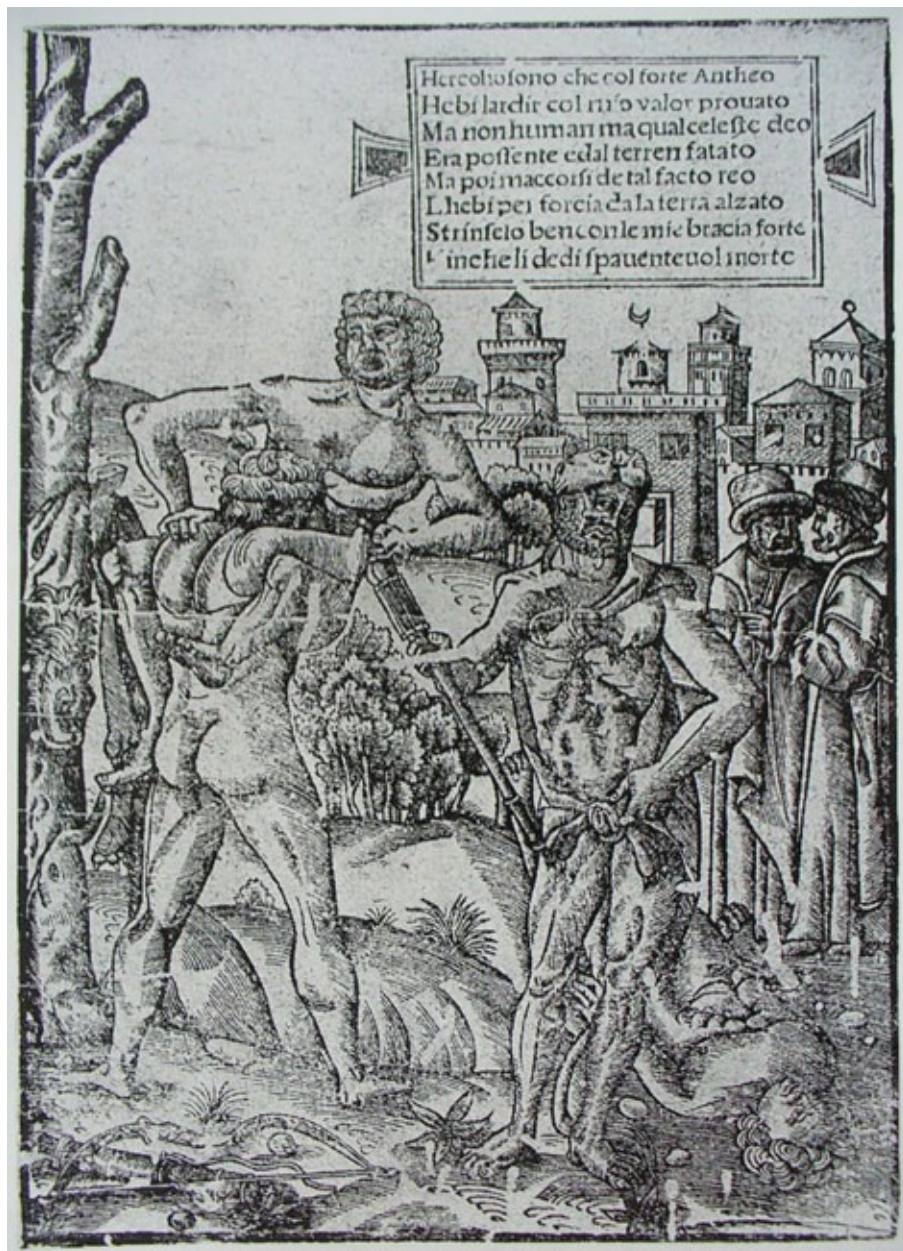
Fig. 7a. Lucha de Hércules y Anteo. Grabado de Giovanni Andrea Valvassori (c. 1506).