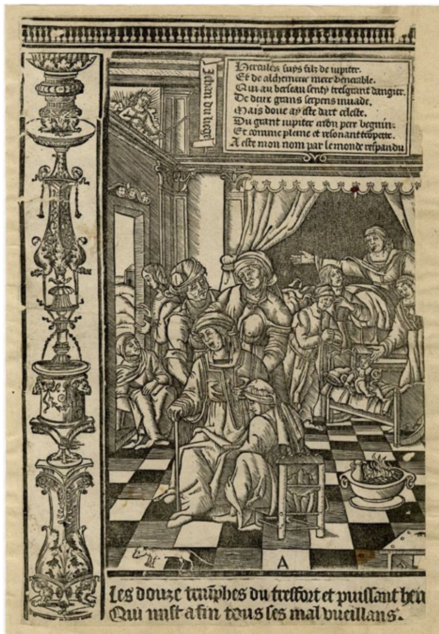
Fig. 3. El Nacimiento de Hércules. Grabado de Jehan de Liège (c. 1520).