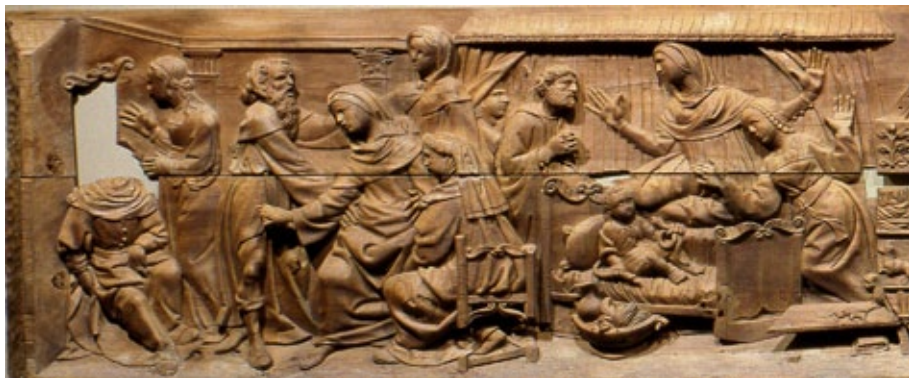
Fig. 1. El Nacimiento de Hércules. Friso del castillo de Vélez Blanco. Museo Nacional de Artes Decorativas de París.