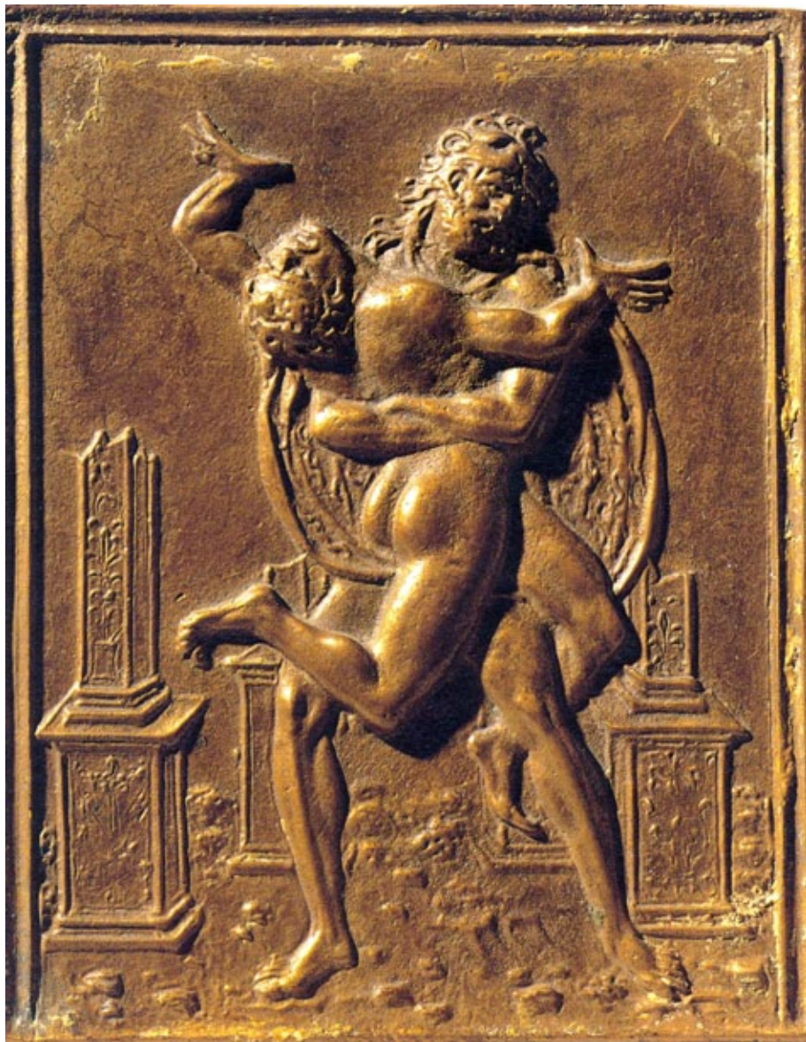
Fig. 8a. Lucha de Hércules y Anteo. Plaqueta de Moderno (c. 1490).