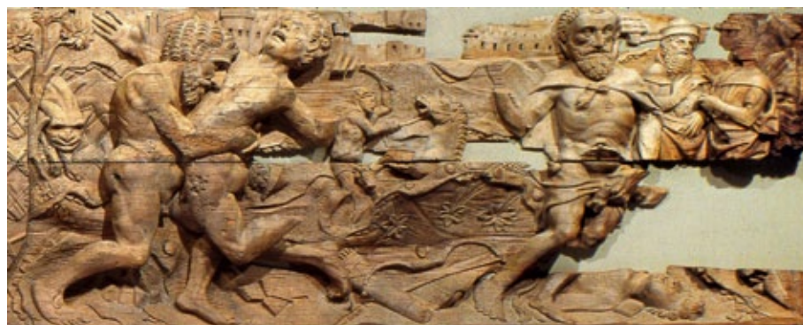
Fig. 6. Lucha de Hércules y Anteo. Friso del castillo de Vélez Blanco. Museo Nacional de Artes Decorativas de París.