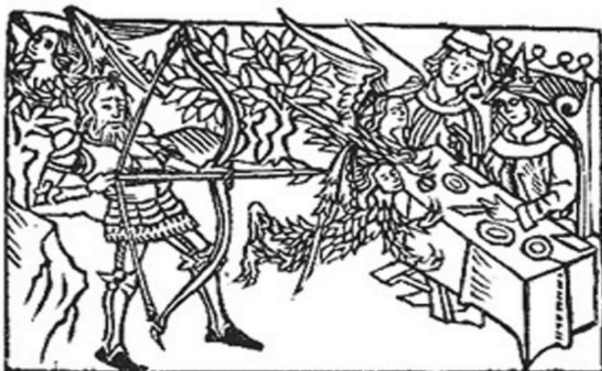
Fig. 5. Hércules y las Harpías en la mesa del rey Fineo. Grabado de la obra de Enrique de Villena, Los doze Trabajos de Hércules (Zamora, 1483).