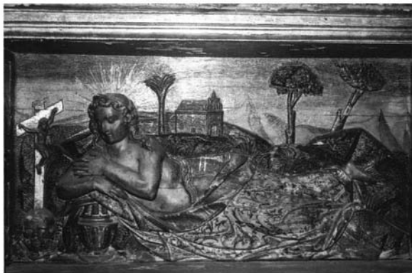
Lámina 2.- Francisco de La Gándara. Retablo de Santo Tomás de Aquino. Magdalena penitente. Relieve central del banco. 1605.