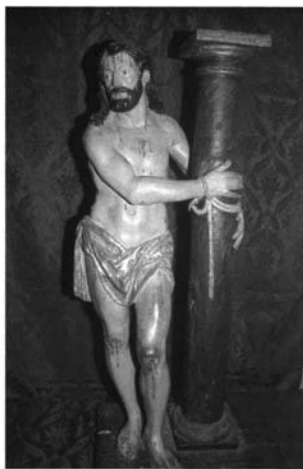
Lámina 5.- Francisco de La Gándara. Cristo atado a la columna, llamado del Perdón. 1605. Basílica menor de Ntra. Sra. de la Caridad. Antecristía. Sanlúcar de Barrameda (Cádiz).