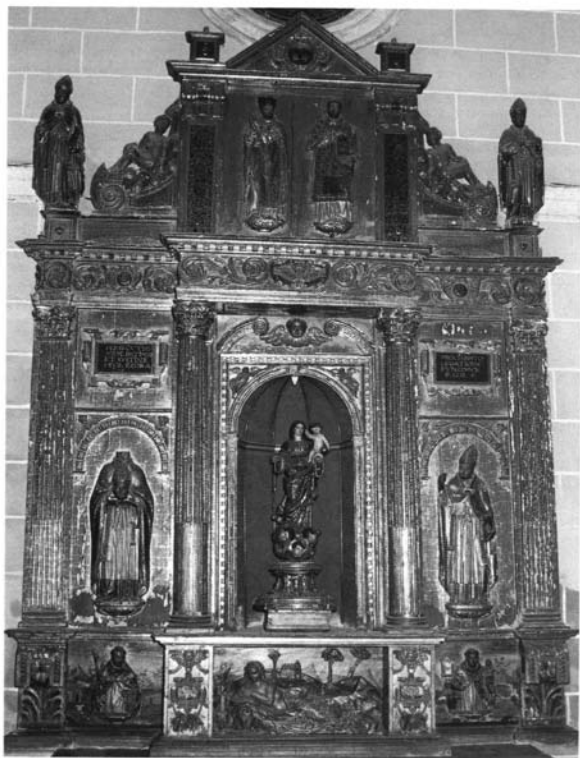
Lámina 1.- Francisco de La Gándara y Martín Christiano. Retablo de Santo Tomás de Aquino. 1605. Iglesia de Santo Domingo de Guzmán. Sanlúcar de Barrameda (Cádiz).