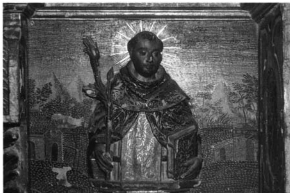
Lámina 3.- Francisco de La Gándara. Retablo de Santo Tomás de Aquino. San Jacinto. Relieve izquierdo del banco. 1605.