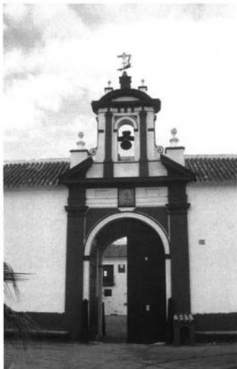
Lám. 10. Portada de la hacienda La Nava, Carmona.

y cuyas torres de contrapeso en esta ocasión se ubican al fondo del edificio, siendo una de ellas también mirador 30 .