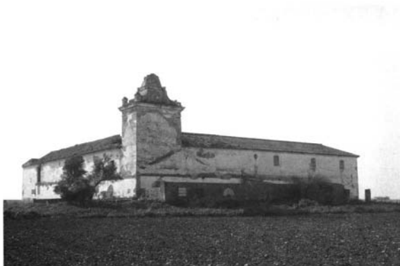
Lám. 5. Hacienda de Aguirre, Carmona.

Muy semejante a Córdoba es la inédita hacienda conocida actualmente como Los Guirris, degeneración de su nombre original: Aguirre. Se encuentra muy próxima a la carretera Carmona-Brenes y en la actualidad su imponente caserío está en ruinas, a pesar de lo cual es evidente su íntimo parentesco con Córdoba, por lo que sospechamos que la levantaría el mismo alarife local, también a finales del siglo XVIII 23 . (Lám. 5).