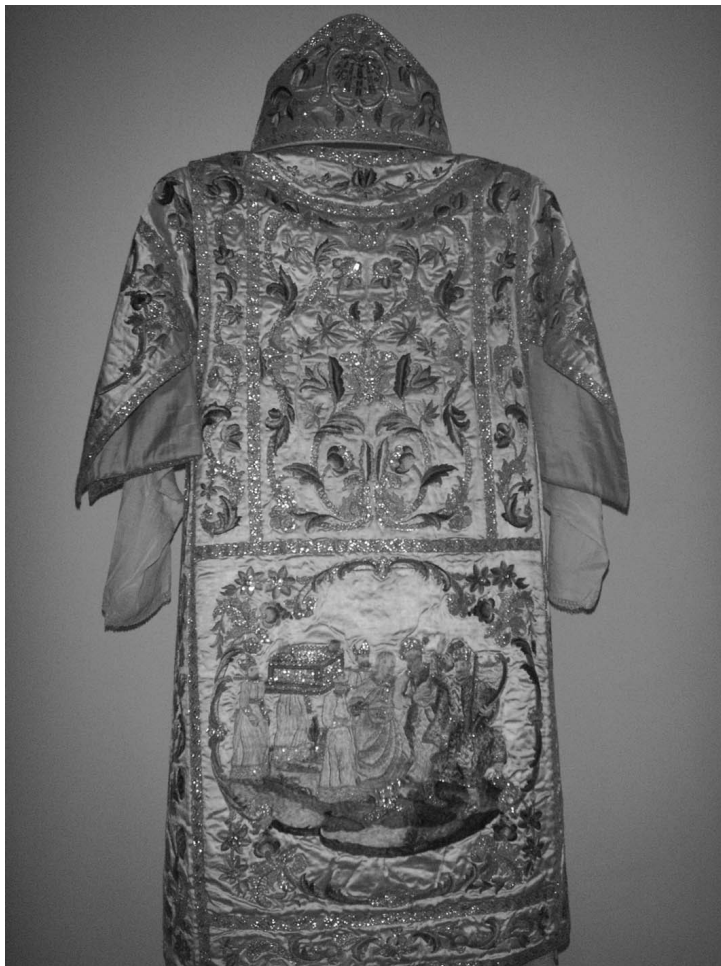
Figura 7: Terno conmemorativo del convento de San Joaquín y Santa Ana de Valladolid. Dalmática. 1787.