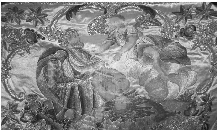
Figura 4: Terno conmemorativo del convento de San Joaquín y Santa Ana de Valladolid. Dalmática (detalle de la bocamanga derecha). 1787.