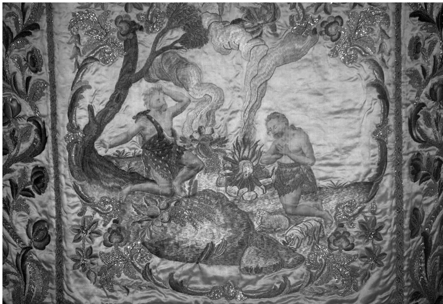
Figura 3: Terno conmemorativo del convento de San Joaquín y Santa Ana de Valladolid. Dalmática (detalle del faldón trasero). 1787.