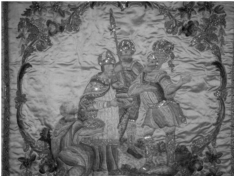
Figura 8: Terno conmemorativo del convento de San Joaquín y Santa Ana de Valladolid. Dalmática (detalle del faldón trasero). 1787.