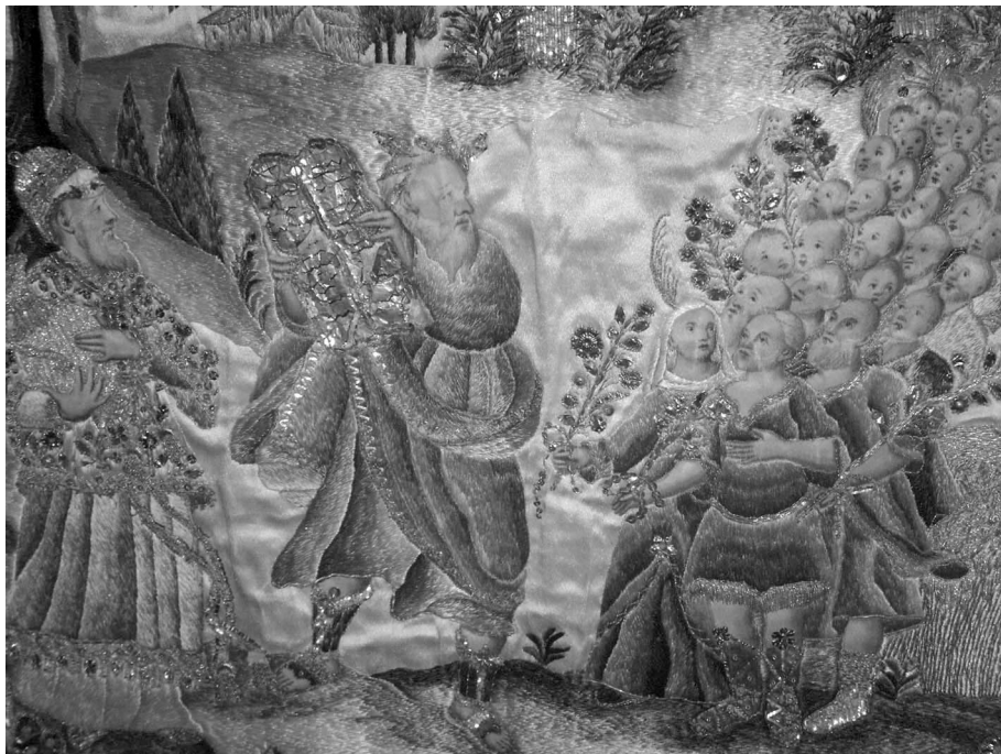
Figura 9: Terno conmemorativo del convento de San Joaquín y Santa Ana de Valladolid. Capa pluvial (detalle del capillo). 1787.