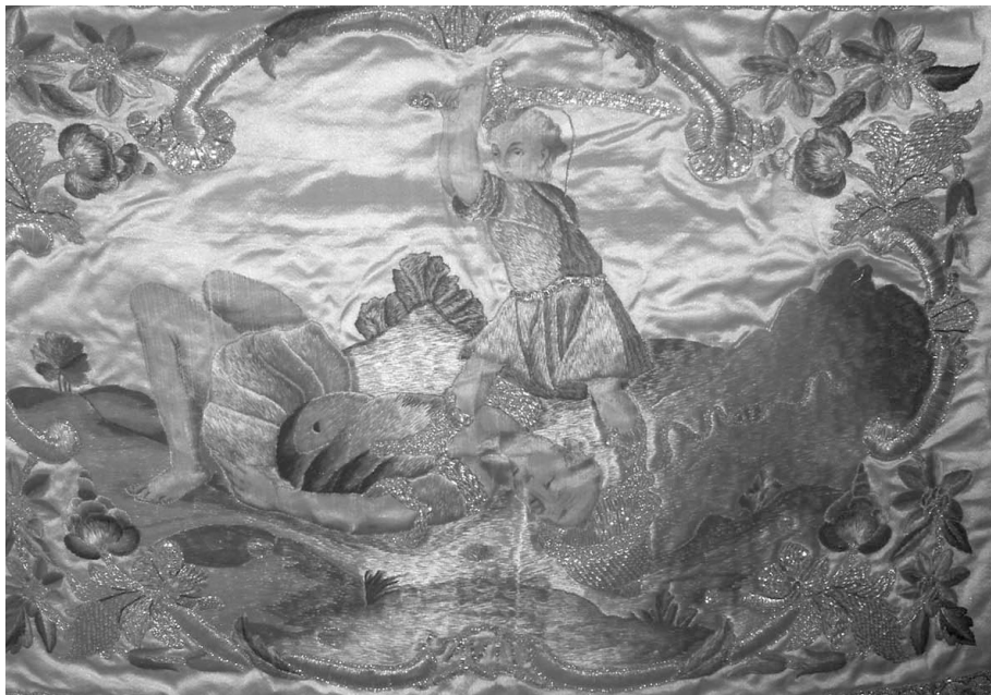
Figura 5: Terno conmemorativo del convento de San Joaquín y Santa Ana de Valladolid. Dalmática (detalla de la bocamanga izquierda).1787.