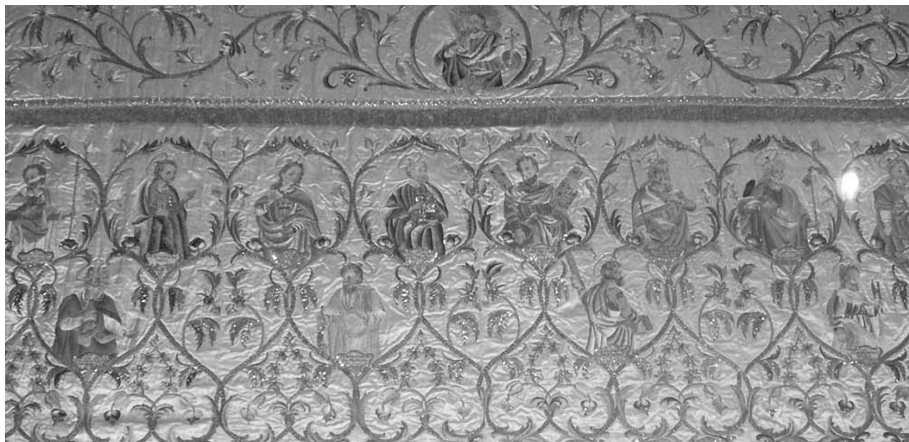
Figura 6: Terno conmemorativo del convento de San Joaquín y Santa Ana de Valladolid. Paño de altar. 1787.