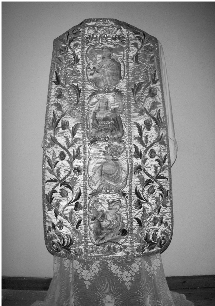
Figura 1: Terno conmemorativo del convento de San Joaquín y Santa Ana de Valladolid. Casulla. 1787.