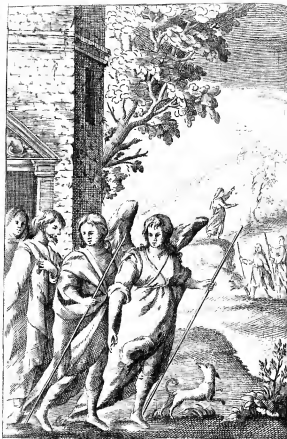
Pl. 1. Nudavit, et redussit sanum.