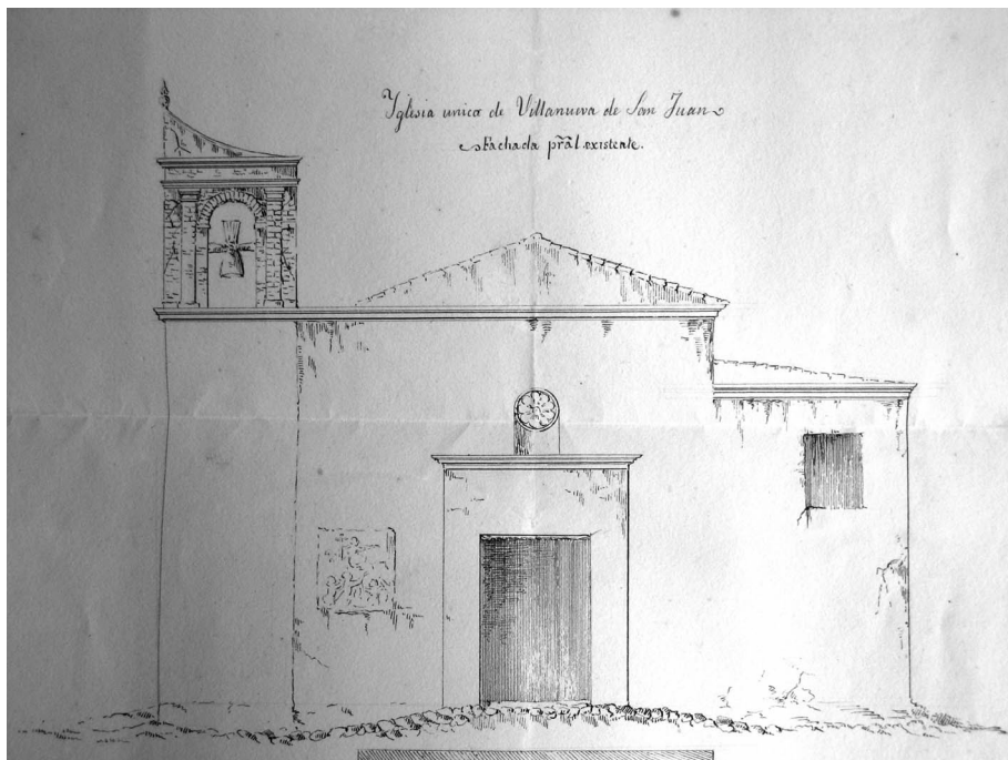
Figura 3. Alzado de la fachada de la parroquia de Villanueva de San Juan. Detalle del documento anterior.