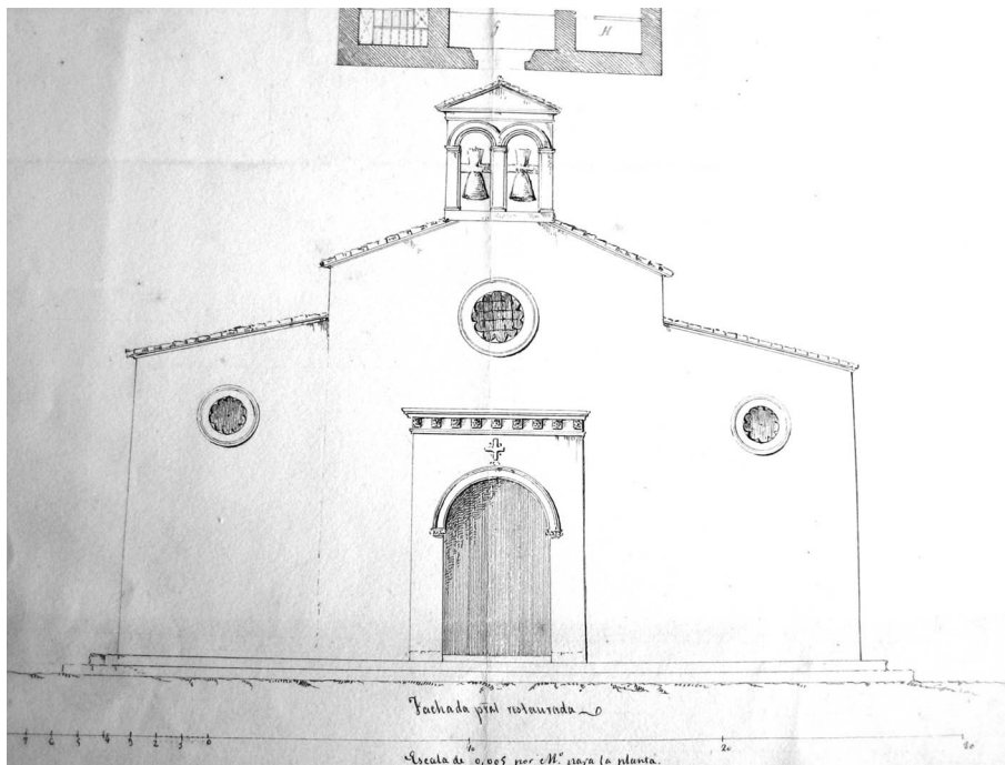
Figura 4. Propuesta de fachada de Demetrio de los Ríos. Detalle del documento anterior.